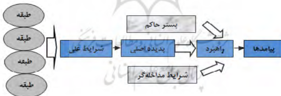
شکل ۱. مدل پارادایمی کدگذاری محوری

۴. پیامدها: برخی طبقه ها بیانگر نتایج و پیامدهایی هستند که در اثر اتخاذ راهبردها به وجود می آیند. این روش کدگذاری که در اصطلاح به آن مدل پارادایم کدگذاری محوری گفته می شود، توسط استراوس و کوربین ارائه شده است و به این دلیل محوری گفته می شود که کدگذاری حول «محور» یک طبقه انجام می گیرد (شکل ۱).