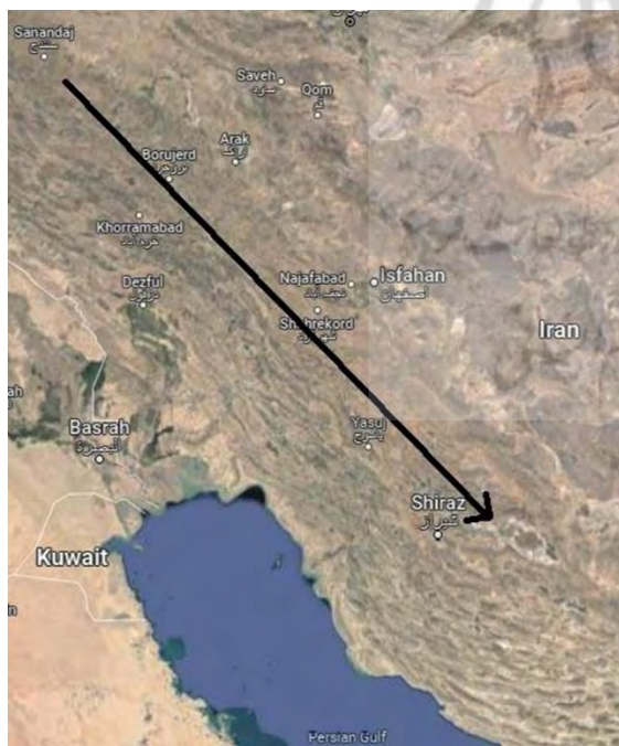
شکل ۱: مسیر مهاجرت گروهی اهالی پرسوا (پرسو، پرسواش، پرسومش) از زاگرس مرکزی به زاگرس جنوبی.

50-41) نشان می‌دهد که این سرزمین و شهری به همین نام در روزگار سارگن (بنگرید به ادامه) در آن از اهمیت بالایی نزد شاه آشور برخوردار بوده است که تا این اندازه به آن بها داده شد. احتمالاً این موضوع به موقعیت جغرافیایی پرسوا وابسته بوده است و خوب می‌دانیم که سارگن البری‌ا و میسی (KUR.mi-is-si) یا همان مسو را (که دومی در این زمان جزئی از ماننا یا مان: KUR.ma-an-a-a-a بود) همچون شاهان پیشین در نزدیکی پرسوا گزارش کرده است (ibid.: 51 & 37-38b; Sargon II 280-281). همچنین پیرو بخشی از نبشته ۶۵، سارگن آشکارا خواجه دست‌نشانده خود در پرسوا/پرسواش را صاحب اختیار دو شهر اَپتر (URU.ap-pa-tar) و کیتیت (URU.ki-) در حدود گیزیلوند (KUR.gi-zi-il-) (it-pat-a-a) معرفی کرده است که این موضوع به خوبی گستردگی قلمروی اختیارات خواجه حاکم بر پرسواش را نشان می‌دهد (ibid.: 70-71; Sargon 65, 282-283). (شکل ۱).