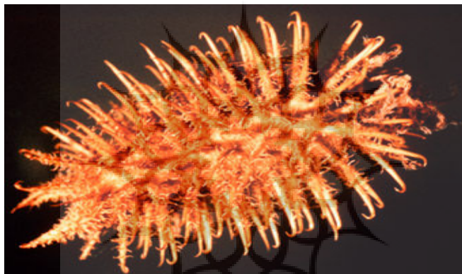
شکل ۱: گیاه Cockleburs که منجر به ساخت ولکرو شد [۶]

۳.۲. در سال ۱۹۲۷ مهندس سویسی، جورج د مسترال ۳ ، متوجه شد که دلیل چسبیدن نوعی گیاه به نام کوکلیبرس ۴ به پوستین او (شکل ۱-۱) هزاران قلاب کوچکی است که هر جوانه گیاه را پوشانده است. او هشت سال بعد ولکرو ۵ (کفپوش و قلابهای چسبنده) را مشابه قلابهای این گیاه ابداع کرد [۶].