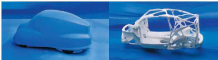
شکل ۳: اسکلت ماشین [۲۰]