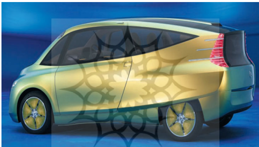
شکل ۴: ماشین بنز ۲۰۰۵ Bionic Car [۲۰]

۷.۲. محققان دانشگاه تافتس آمریکا با بررسی ساختار سیستم بویایی سگها و دیگر جانورانی که از قوه بویایی قوی برخوردارند، موفق شده اند دستگاه بویاب نوینی را تکمیل کنند که از حسگرهای متعارف به مراتب کارآمدتر است. نتیجه این پژوهش در سال ۲۰۰۶ در هفته نامه علمی نیچر به چاپ رسیده است. محققان دانشگاه تافتس در بررسی ساختار سیستم بویایی سگها و برخی دیگر از پستانداران به این نکته پی برده اند که درون بینی این جانوران دارای دالانهای باریک و پر پیچ و خم مینیاتوری فراوانی است که درون آنها از هوا پر شده است و به این جانوران در تشخیص رایحه‌های مختلف کمک می‌کند [۶].