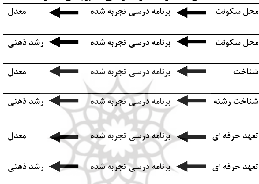
شکل ۲: مسیرهای مورد بررسی در پژوهش حاضر

می‌گردد. برنامه درسی تجربه شده شامل متغیرهای مهارت‌های عمومی، ادراک از محیط، خوداثربخشی و رضایت بود که در نهایت منجر به موفقیت دانشجویان می‌شوند.