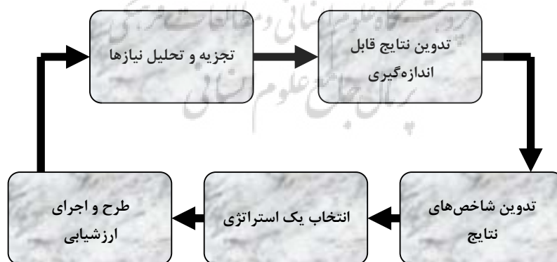
شکل ۱. فرایند ارزشیابی مدل آموزش مؤثر ایمنی در بنادر

ارزشیابی آموزشی گردآوری و تجزیه و تحلیل نظام‌ند اطلاعات مورد نیاز برای تصمیم‌گیری است. ارزشیابی آموزشی شامل ارزشیابی تکوینی و ارزشیابی پایانی یا تراکمی است. در ارزشیابی تکوینی دو اطمینان حاصل می‌شود: ۱. برنامه آموزشی به خوبی سازماندهی و به راحتی اجرا می‌شود؛ ۲. فراگیران با این برنامه آموزشی هم یاد می‌گیرند و هم راضی می‌شوند. ارزشیابی تکوینی در اجرای برنامه آموزشی به منظور هدایت مجریان آموزش به اجرا در می‌آید و همچنین، از آن برای اصلاح فرایند اجرای برنامه آموزشی بهره‌گیری می‌شود. ارزشیابی تکوینی معمولاً شامل جمع‌آوری داده‌های کیفی [مثل نظرها و احساسات] در باره برنامه آموزشی است. ارزشیابی پایانی یا تراکمی برای تعیین میزانی که فراگیران در نتیجه شرکت در برنامه آموزشی تغییر یافته‌اند، به کار می‌رود و همان گونه که از نامش برمی‌آید، در پایان اجرای برنامه آموزشی به اجرا در می‌آید. موفقیت نهایی برنامه آموزشی معمولاً با کاهش نرخ حوادث قابل مشاهده خواهد شد. در شکل ۱ فرایند ارزشیابی مدل کاربرد آموزش ایمنی در صنایع ارائه شده است.