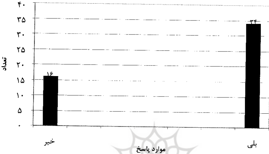
شکل ۲. نظر مهندسان در باره ارائه واحدی با عنوان تاریخ علم در دانشگاه‌ها

انگیزه‌های بیشتر آنها برای خدمت و مشارکت در توسعه کشور کمک کند.