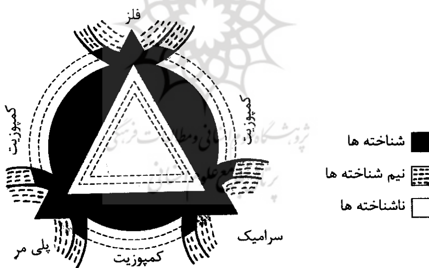
شکل ۲. دامنه مهندسی مواد