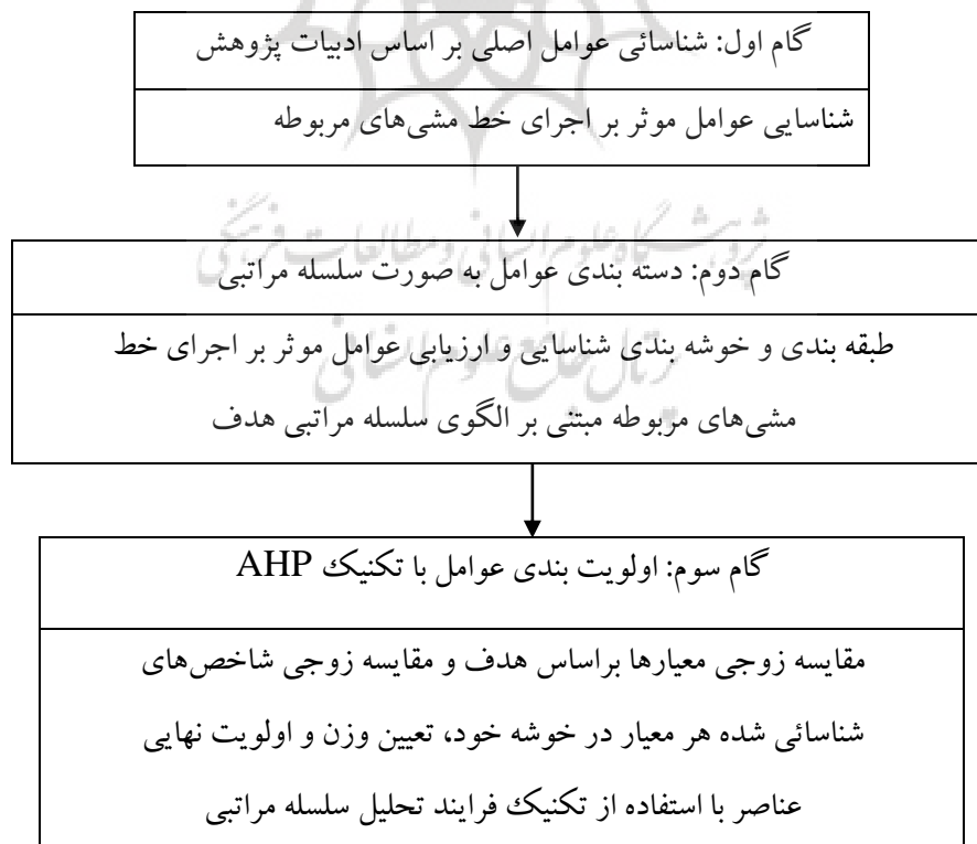
شکل ۱. فرایند اجرای تحقیق

روش تحقیق مطالعه حاضر با هدف شناسایی و رتبه بندی عوامل موثر بر اجرای خط مشی های مرتبط در ایران انجام شده است. این مطالعه از لحاظ هدف، کاربردی و از لحاظ ماهیت و شکل اجراء، توصیفی - پیمایشی است. الگوریتم اجرایی تحقیق در شکل ۱ نشان داده شده است.