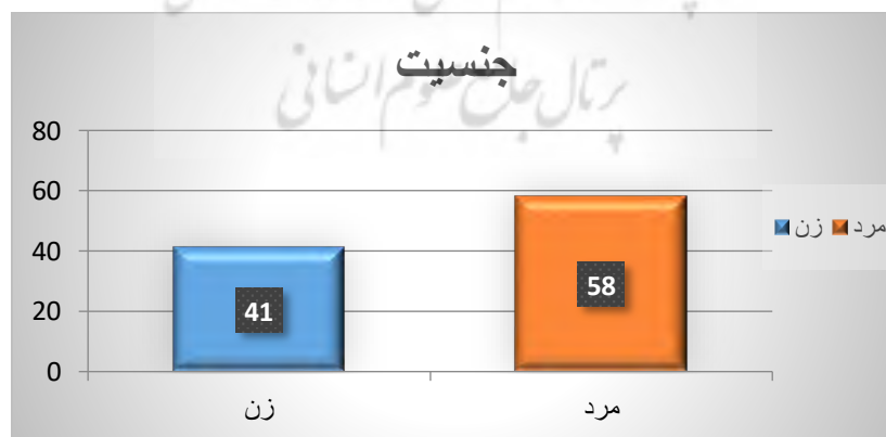
شکل ۱. جنسیت مشارکت کنندگان در پژوهش

بر اساس نتایج تحقیق، شرکت کنندگان در این پژوهش حدود ۴۱/۶۶٪ زن و حدود ۵۸/۳۳٪ پاسخ دهندگان مرد هستند