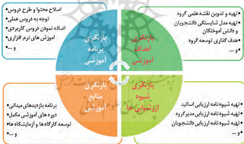
شکل ۴. فعالیت‌ها و اقدامات جهت بهبود و تقویت برنامه آموزشی

پس از محاسبه و تعیین میزان تحقق پیامدهای آموزشی، تحلیل نتایج ارزیابی و سپس ارائه پیشنهادات و اعمال اصلاحات لازم در برنامه جهت ارتقا و بهبود برنامه انجام می‌گیرد. این کار در خصوص ارزیابی پیامدهای آموزشی رشته خط و سازه‌های ریلی انجام گرفت و مجموعه اقداماتی جهت اصلاح و بهبود برنامه آموزشی هدف‌گذاری شد. در این راستا رؤس اقدامات و همچنین فعالیت‌های مربوط به هر اقدام به شرح نمودار شکل ۴ قابل مشاهده است.