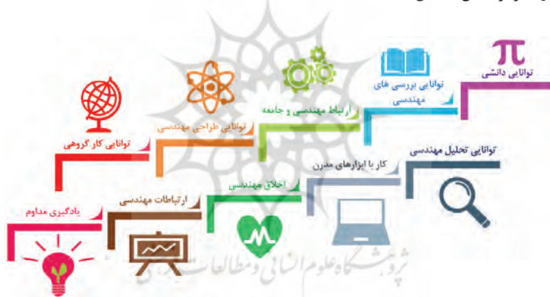
شکل ۲. انواع پیامدهای استاندارد آموزشی

در مقدمه ذکر شد، مطرح‌ترین نهاد فعال در این زمینه شورای ارزشیابی مهندسی و فناوری آمریکا معروف به ABET می‌باشد. (ABET, 2021)، این سازمان در سال ۱۹۹۷ ملاک‌های جدید را برای ارزشیابی مهندسی عرضه کرد که اصطلاحاً EC2000 نامیده می‌شوند (ABET, 1998). این ملاک‌ها در کشورهای زیادی مبنای سنجش آموزش و ارزیابی برنامه‌های مهندسی قرار گرفته است. بر اساس روش ارزیابی ABET، یک مجموعه ملاک‌های عمومی جهت سنجش پیامدهای آموزشی معرفی می‌شود و نیز تأکید می‌گردد که یک مجموعه ملاک‌های اختصاصی، با توجه به دوره و برنامه آموزشی و اهداف مربوط، تعیین و مورد ارزیابی قرار گیرد. لذا در مطالعه حاضر با توجه به ملاک‌های عمومی و پیامدهای استاندارد آموزشی که ABET تعیین کرده است و نیز معیارهای اختصاصی که با توجه به اهداف خاص برنامه آموزشی رشته مهندسی خط و سازه‌های ریلی دانشگاه علم و صنعت ایران مورد توجه می‌باشد، در مجموع ۱۱ پیامد به عنوان معیارهای ارزیابی و سنجش برنامه آموزشی به کار گرفته شد که عناوین آن‌ها در تصویر شکل ۲ قابل مشاهده است (Heydari et al., 2021).