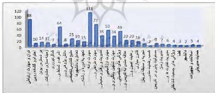
نمودار ۲. درصد فراوانی مضامین پایه مؤلفه‌های کیفیت آموزشی اعضای هیئت علمی

اطلاعات نمودار ۱ نشان می‌دهد فراوانی درصدی مضامین فراگیر مؤلفه صلاحیت‌ها و شایستگی‌های حرفه‌ای تدریس، بیشترین فراوانی را در بین ابعاد کیفیت آموزشی اعضای هیئت علمی دارد. نمودار زیر درصد فراوانی مضامین پایه مؤلفه‌های کیفیت آموزشی اعضای هیئت علمی را نشان داده است؛