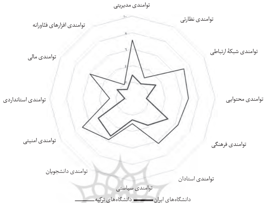
شکل ۲. نمودار مقایسه‌ای ابعاد توانمندی دانشگاه‌های منتخب دو کشور برای تحقق یادگیری الکترونیکی

براساس شکل فوق تقریباً عدم موفقیت دانشگاه‌های ایرانی در توسعه نظام‌های آموزش الکترونیکی قابل ملاحظه است که می‌توان این موضوع را متأثر از رشد نامتوازن ابعاد توانمندی الکترونیکی این دانشگاه‌ها دانست. به‌عنوان نمونه در مطالعه دانشگاه شیراز حدود ۳۰ درصد ابعاد (۴ بُعد از ۱۳) شامل: «قوانین و مقررات»، «استاندارد»، «نظارت و ارزیابی» و «منابع مالی» دارای امتیاز صفر و در سایر ابعاد (به جز بُعد «امنیت») نیز امتیاز «ضعیف» و «کمتر از متوسط» را به‌دست آورده است. در دانشگاه‌های خواجه‌نصیر و اصفهان نیز نتایج مشابهی به‌دست آمده است. اگرچه در دانشگاه تهران وضعیت بهتر است اما ابعاد توانمندی الکترونیکی این دانشگاه نیز دچار رشد نامتوازن است؛ به‌طوری‌که در حدود نیمی از ابعاد توانمندی امتیازهای «عالی» و «خوب» برآورد شده و بالعکس در نیمی از ابعاد امتیازهای «ضعیف» و «پایین‌تر از متوسط». بنابراین با وجود میانگین وضعیت حدود سطح «متوسط» برای این دانشگاه، توسعه غیرمنسجمی از منظر ابعاد توانمندی آموزش الکترونیکی رخ داده است. شایان ذکر است که اگرچه دانشگاه‌های منتخب ترکیه از حیث میانگین امتیاز، در وضعیت مشابهی با دانشگاه تهران قرار دارند، اما میزان پراکندگی ابعاد توانمندی در این دانشگاه‌ها کم‌تر است؛ به‌عنوان نمونه در این دانشگاه‌ها برای هیچ بُعدی امتیاز سطح «عالی» حاصل نشده (درحالی‌که دانشگاه تهران در بُعد «نظارت و ارزیابی» امتیاز «عالی» را کسب کرده)، لیکن در ۶۰ درصد ابعاد توانمندی امتیاز «خوب»