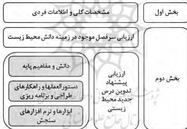
شکل ۲. بخش‌های مختلف پرسشنامه

تحلیل نتایج براساس آنها صورت گرفت و در مرحله نهایی راهکارهای پیشنهادی در زمینه محتوا و شیوه آموزش ارائه شد. تدوین پرسشنامه براساس ارزیابی سرفصل مصوب و مروری بر شرایط موجود در زمینه آموزش معماری در سه نمونه از دانشگاه‌های برتر جهان انجام شده است. در شکل ۲ بخش‌های مختلف پرسشنامه ارائه شده است. بخش اول پرسشنامه به مشخصات کلی و اطلاعات فردی پاسخ‌دهنده اختصاص دارد. در بخش دوم سؤالات پرسشنامه برای ارزیابی سرفصل موجود و پیشنهادهایی به منظور ارتقای آن در خصوص دانش محیط زیست شهری تنظیم شده است. در بخش اول از سؤالات بسته (۶ سؤال) با طیف لیکرت ۵ تایی استفاده شد. قسمت دوم سؤالات چندگزینه‌ای (۴ سؤال) و قسمت سوم سؤالات پاسخ باز (۳ سؤال) است. پرسش‌های مربوط به محتوای درس جدید در سه حوزه الف. دانش و مفاهیم پایه، ب. دستورالعمل‌ها و راهکارهای طراحی و برنامه‌ریزی؛ ج. ابزارها و نرم‌افزارهای سنجش نظرسنجی شده است. جامعه آماری تعداد ۱۲ نفر از استادان رشته‌های طراحی و برنامه‌ریزی شهری از سه دانشگاه از دانشگاه‌های ایران و روش نمونه‌گیری تصادفی بود. در جدول ۱ مشخصات پاسخ‌دهندگان در قالب جدول دموگرافیک نشان داده شده است.