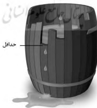
شکل ۱. شبیه‌سازی قانون لیبیگ (Davis, 1999)

بر طبق قانون حداقل، که لیبیگ ابتدا آن را در کشاورزی ارائه کرد، رشد گیاه با مجموعه منابع مغذی در دسترس کنترل نمی‌شود، بلکه عامل تعیین‌کننده در رشد، کمترین یا محدودکننده‌ترین منبع است؛ به عبارت دیگر، در جایی که بقیه عناصر موجود باشند، کمبود یا نبود یک عنصر ضروری عامل محدودکننده است و مانع تولید محصول زراعی می‌شود. این قانون را در یادگیری نیز شاید بتوان به کار برد. ممکن است دانشجو از همه پیش‌نیازهای ضروری برای یادگیری برخوردار باشد، ولی آنچه در عمل تعیین‌کننده است، عاملی است که کمترین مقدار را دارد (Davis, 1999). این قانون را به صورت یک بشکه چوبی آب شبیه‌سازی کرده‌اند (شکل ۱). در اینجا اگر هر یک از منابع و عوامل موجود را یکی از چوب‌های سازنده بشکه در نظر بگیریم، آن چوبی که کوتاه‌تر (کمتر) است، میزان کارایی بشکه را تعیین می‌کند. در فرایند یادگیری، این چوب کوتاه‌تر می‌تواند یکی از عوامل اثرگذار از جمله انگیزه باشد.