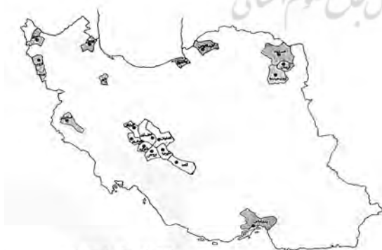
مراکز آموزشی دانشگاه آزاد ایران که در سال ۵۹-۱۳۵۸ دانشجویی پذیرند.

علاوه بر آن، برنامه‌ریزی‌های اولیه برای انتقال مرکز اصلی دانشگاه آزاد ایران از تهران به بهشهر مازندران، شامل احداث ساختمان‌های اداری و آموزشی، اقامتگاه‌ها برای استادان و کارکنان و مراکز تفریحی و تجاری نیز صورت گرفته بود (Free University of Iran, 1979a).