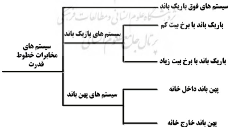
شکل ۴: دسته‌بندی‌های مختلف فناوری مخابرات خطوط قدرت