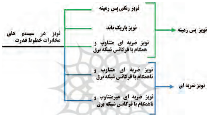
شکل ۲: منابع مختلف نوبه در سیستم‌های مخابرات خطوط قدرت

چالش مهم مخابراتی دیگر سیستم‌های مخابرات خطوط قدرت در وجود منابع مختلف داخلی و خارجی نوبه و آغستگی به انواع مختلفی از آن همچون نوبه ضربه‌ای است. در واقع، برخلاف اکثر سیستم‌های مخابراتی، یک فرایند طبیعی سفید به‌تنهایی قابلیت مدل‌سازی نوبه در کانال‌های مخابرات خطوط قدرت را ندارند، بلکه همانطور که در شکل ۲ نشان داده شده است نوبه این کانال‌ها متشکل از پنج منبع مختلف نوبه است که این منابع نوبه در یک دسته‌بندی جامع‌تر در قالب دو دسته کلی مدل‌سازی می‌شوند.