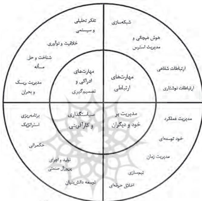
شکل ۱: مدل مهارت‌های نرم برای دانشجویان و دانش‌آموختگان رشته‌های مهندسی

پس از بررسی و مطالعات کتابخانه‌ای و مرور مدل‌های شایستگی و مهارتی دانشگاه‌های معتبر و نیز مصاحبه با دانشجویان دکتری، مدل نهایی مهارت‌های نرم برای دانشجویان مطابق شکل ۱ ارائه می‌شود: