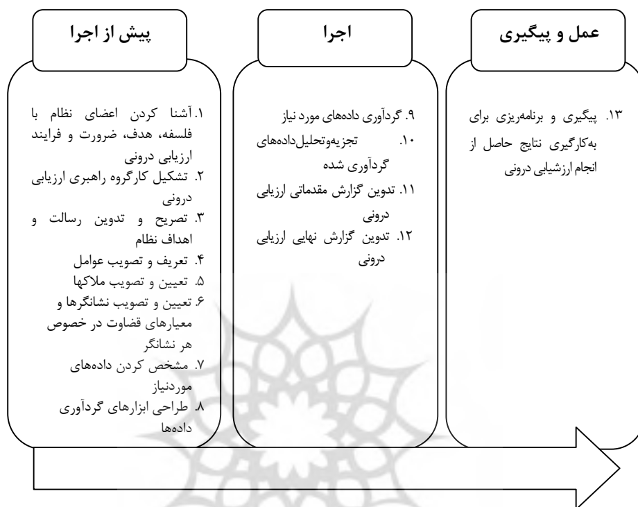
شکل ۱: مراحل انجام ارزشیابی درونی (محمدی، ۱۳۸۷)

سازکار ارزشیابی برنامه‌های آموزش مهندسی با ارزیابی درونی یا خودارزیابی آغاز می‌شود. در این مرحله، اعضای هیئت‌علمی برنامه موردنظر را بررسی و ارزیابی کرده و نتایج را در پرسش‌نامه‌ای، که به این منظور تهیه شده، درج می‌کنند. در این راستا، برقراری نظام خودارزیابی (ارزیابی درونی)، که حاصل تفکرات ارزیابی و انتقادی و تأمل در اجزای برنامه درسی است، آن‌چنان سیستم برنامه درسی را با اصلاح هدفها، تغییر و بازسازی ساختار محتوا و اصلاح روشها تنظیم خواهد کرد که بتواند به‌روز و کارآمد باشد و برون‌داده‌های مهم خود را، که همانا نیروی انسانی موردنیاز جامعه با بهره‌مندی از دانش و تخصص لازم است، ایجاد کند (جهانی، ۱۳۸۴). بر این اساس، بررسی کیفیت برنامه‌های درسی آموزش مهندسی، که نقش تعیین‌کننده‌ای در توسعه و پیشرفت کشور دارند، از اهمیت ویژه‌ای برخوردار است. با توجه به انتقادهای وارد بر برنامه‌ریزی درسی در نظام آموزش عالی کشور به‌طور عام و در آموزش مهندسی به‌طور خاص و ضرورت ارزیابی مستمر برنامه‌های درسی این تحقیق درصدد است