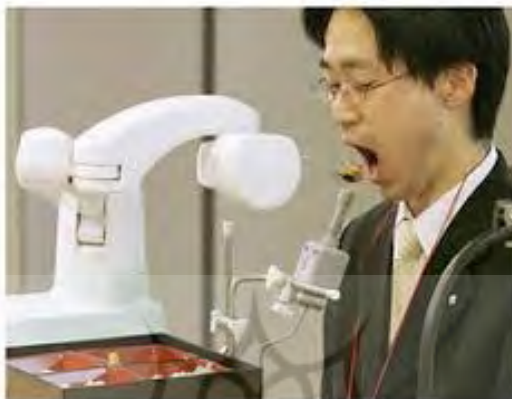
شکل ۸: ربات غذادهنده به بیمار معلول پس از عمل جراحی ( www.engadget.com/tag/RoboticArm/ 2012)

است، قادر به شروع، توقف، و تطبیق خود با کاربر با کمترین پیچیدگی است. همچنین باید با روال و خواسته‌های متغیر کاربر و مراقبان مطابقت داشته باشد، که این نیز چالشی ذاتی در این‌گونه سیستم‌های رباتیکی است (SelkGhafari, Meghdari and Vossoughi, 2009).