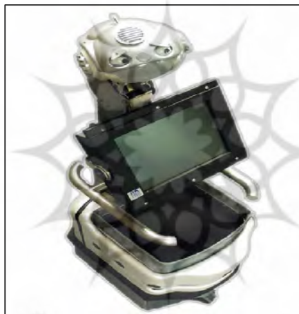
شکل ۷: نمایی از ربات پرستار پَرل (Nursebot Pearl, http://www.engadget.com , 2005)

«ماشین» داشته باشد، کم‌رنگ می‌شود. از طرفی ربات هوشمند نیز با برخی از عادت‌ها، علایق و دستورهای انسان آشنا می‌شود و از این رو سطح تعامل بالاتر رفته و بازدهی آن افزایش می‌یابد. ربات‌های پرستار از معمول‌ترین ربات‌های اجتماعی هستند که برای کمک به سالمندان و بیماران قطع‌نخاعی طراحی و برنامه‌ریزی شده‌اند. (Meghdari, Hossein khannazer, Selkghafari, 2004). بسیاری از سالمندان نمی‌توانند مستقل زندگی کنند، چراکه اختلال حواس آنها باعث می‌شود در مصرف داروها، ملاقات با دکتر و حتی مراجعه به سرویس بهداشتی دچار فراموشی شوند. در این‌گونه موارد ربات‌های یاری‌گر هوشمند مجهز به حسگرهای لامسه، نور، شنوایی، دما، و وضعیت می‌توانند به‌صورت خودکار به فرد سالمند کمک کنند (Broekens, Heerink, Rosendal, 2009).