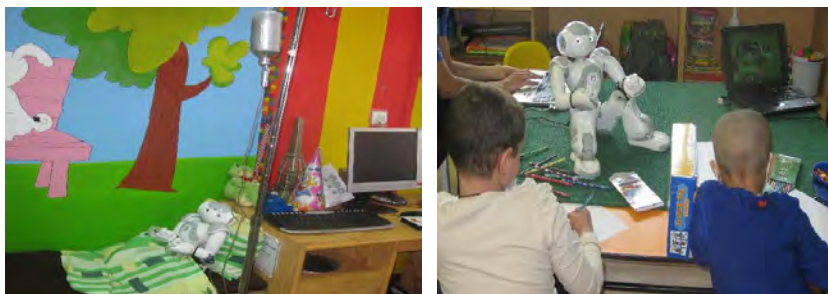
شکل ۶: مداخلات بالینی کودکان سرطانی به کمک ربات انسان‌نما (نیما) در حضور روانشناس بالینی، ۱۳۹۳

فن پرت کردن حواس بیمار: در این روش ذهن بیمار به وسیله عاملی جذاب، مثلاً گفتن داستان، بازی کردن با وسایل گوناگون یا بازیهای رایانه‌ای از عامل استرس‌زا دور می‌شود. در این صورت، فکر به جای تمرکز بر روی عمل درمانی اضطراب‌آور، مثلاً تزریق یا معاینه، متوجه عامل جذاب می‌شود و میزان اضطراب شخص کاهش می‌یابد.