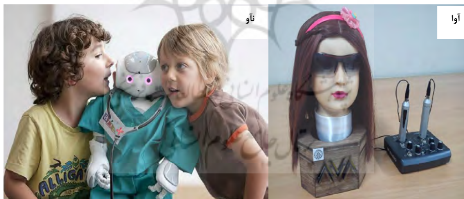
شکل ۱۲: تعامل گفتاری - زبانی کودکان با ربات اجتماعی تاو و آوا (ساخت قطب علمی طراحی و رباتیک)