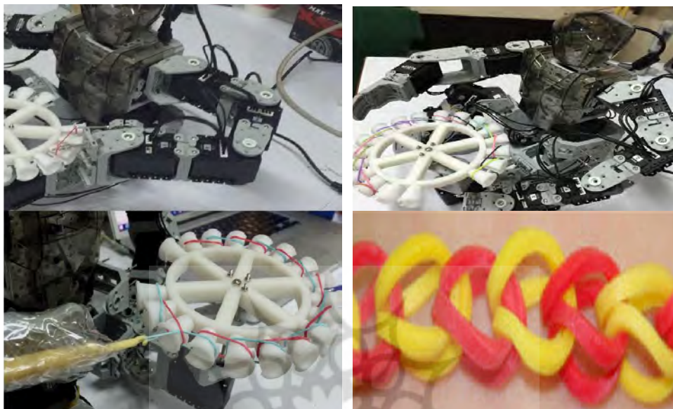
شکل ۴: ربات بایولوید در حال بافت دستبند، آزمایشگاه رباتهای اجتماعی، ۱۳۹۴

۲.۲. رباتهای اجتماعی یاری‌رسان (توانبخشی) غیرتماسی حوزه در رباتیک در حال رشد است، اما هنوز به درستی معرفی و شناسانده نشده است. هدف در این بحث برقراری تعامل نزدیک و مؤثر ربات با یک کاربر انسانی برای کمک‌رسانی، توانبخشی در دوره نقاهت، آموزش و یادگیری و عملیات مشابه است. در ادامه به نمونه‌ای از کاربرد اینگونه رباتها در روند درمانی کودکان سرطانی و اوتیستیک اشاره خواهیم کرد.