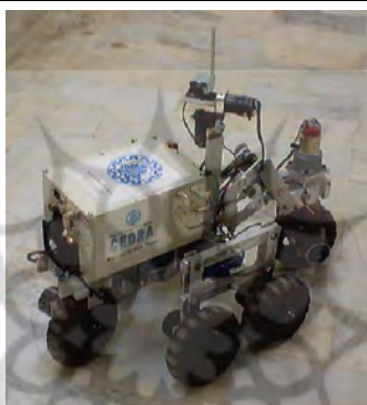
شکل ۱۰: آزمایش ربات «امداگر سدرا» در محیطی شبیه‌سازی شده تخریبی ناشی از وقوع زلزله، ۱۳۸۳