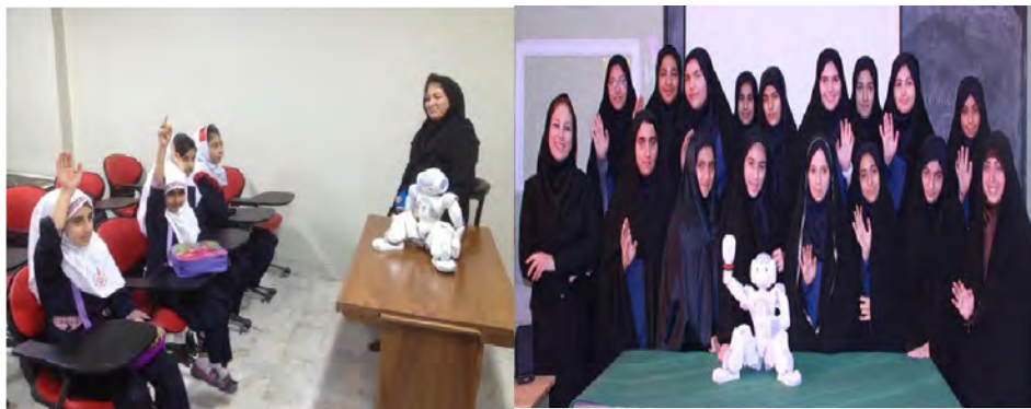
رباتهای اجتماعی (پروژه رال)، ۱۳۹۲

همچنین، تغییرات احتمالی در میزان اضطراب، میل به برقراری ارتباط، نگرش، انگیزه و مهارتهای اجتماعی شرکت‌کنندگان در طول برنامه با سه پرسش‌نامه متفاوت، فیلمهای ضبط‌شده از جلسات و مصاحبه‌ای جامع با والدین شرکت‌کنندگان مورد بررسی قرار گرفتند. نتایج نشان‌دهنده یادگیری خوب شرکت‌کنندگان بودند و بنا بر عملکرد شرکت‌کنندگان در پس‌آزمون با تأخیر، آموخته‌های شرکت‌کنندگان پایداری قابل‌قبولی داشت. اما گروه اول در آزمونهای طراحی‌شده بهتر از گروه دوم عمل کردند. به‌علاوه، در طول برنامه شرکت‌کنندگان هر دو گروه اضطراب کمتر، تمایل بیشتر به برقراری ارتباط، انگیزه بالاتر، نگرش مثبت‌تر و مهارتهای اجتماعی بیشتری از خود نشان دادند. (Taheri, Alemi, Meghdari, Pouretamad, Holderread, 2014)