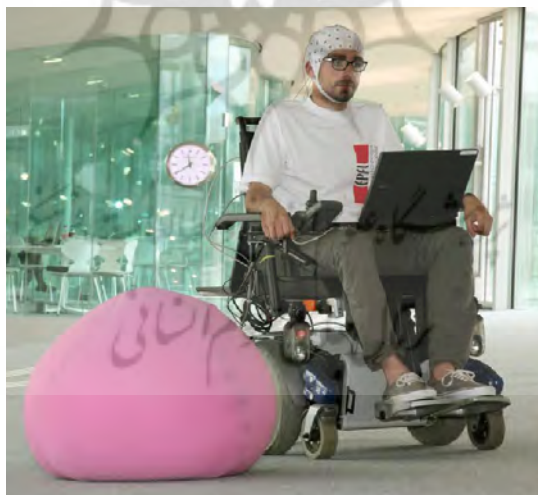
شکل ۹: صندلی چرخدار هوشمند با قابلیت کنترل توسط مغز انسان ( www.cogneurosociety.org , 2015)