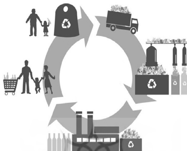
شکل ۳: قابلیت بازیافت مثل بازیافت بطریهای پلاستیکی

پ) مونتاژ: اطمینان از قابلیت تعویض قطعات یک مجموعه با هم در طراحی برای تولید مجدد؛ قابلیت تعمیر یا تعویض ساده قطعات؛ امکان تعویض متعلقات فناوری بدون تأثیر بر پیکره کلی محصول؛ امکان به روز کردن یک طرح از طریق جابه‌جایی یک یا چند قطعه کلیدی.