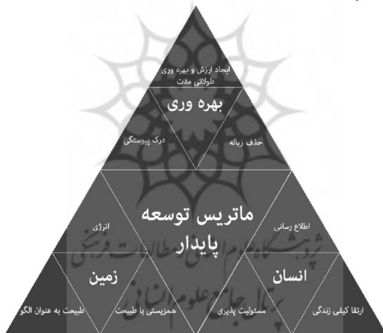
شکل ۲: ماتریس توسعه پایدار برگرفته از نظریه و بلیام مک دونو

به دنبال دارد. از جمله این منافع می توان به کاهش هزینه ها، افزایش کیفیت محصول، ایجاد فرصت های جدید کاری و افزایش قدرت رقابتی در بازار اشاره کرد. لازم به ذکر است که شناسایی جنبه های زیست محیطی یک محصول در طی چرخه عمر خود ساده نیست و پیچیدگی های خاص خود را دارد. آنچه اهمیت ویژه دارد، توجه به عملکرد زیست محیطی محصول در طی دوره استفاده از آن است و بدیهی است که این ملاحظات باید متوازن با سایر عوامل مرتبط با محصول از قبیل عملکرد و کارکرد مورد انتظار از آن، ملاحظات ایمنی در محصول، هزینه، بازار، کیفیت و سایر نیازمندیها و الزامات در طراحی محصول مورد توجه قرار گیرند. برای اعمال ملاحظات زیست محیطی در طراحی محصولات یک سازمان، موضوعات کلان زیست محیطی لازم است در راهبردها و سیاست های کاری سازمانها جای بگیرد و نهادینه شود.