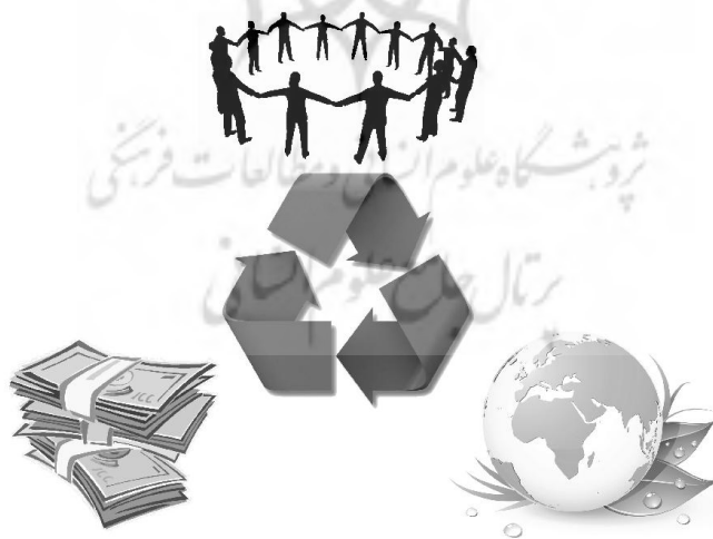
شکل ۱: اصول هانوفر با توجه به سه اصل مردم، محیط‌زیست، سود و بهره‌وری پایدار

در سال ۱۹۹۶ ویلیام مک دونو و همکارانش به منظور ارائه معیارهای اخلاقی برای طراحی پایدار، اصولی را تحت عنوان «اصول هانوفر» ارائه دادند (۲۰۰۰) راه‌حلهای ارائه‌شده زمانی مؤثر خواهد بود که نوع بشر کوشش خود را برای تسلط بر طبیعت متوقف کند و به جای آن به طبیعت به‌عنوان یک الگو نگاه کند. «اصول هانوفر» با توجه به سه اصل مردم، محیط‌زیست، سود و بهره‌وری پایدار شکل می‌گیرد (شکل ۱).