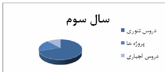
نمودار ۳: تقسیم‌بندی زمان دانشجویان در سال سوم در دانشگاه Imperial