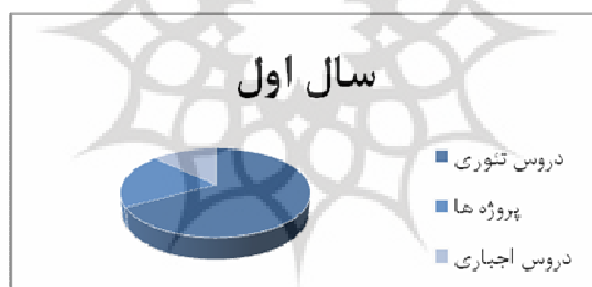
نمودار ۱: تقسیم‌بندی زمان دانشجویان در سال اول در دانشگاه Imperial

نمودارهای ۱ تا ۴ نشان می‌دهد که دانشجویان چه درصدی از وقت خود را در هر سال به هر یک از مباحث درسی اختصاص می‌دهند.