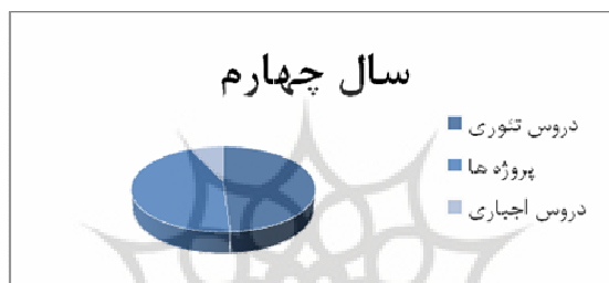
نمودار ۴: تقسیم‌بندی زمان دانشجویان در سال چهارم در دانشگاه Imperial

با یک نگاه اجمالی به برنامه درسی این دانشگاه ملاحظه می‌شود که در دو سال اول مفاهیم اولیه دروس محاسبات فرایند (محاسبات مواد، موازنه انرژی و ...)، مکانیک سیالات، انتقال جرم و انرژی و فناوری جداسازی مواد ارائه و در سالهای بعد مباحث تکمیلی این دروس تدریس می‌شود، مثلاً در سال سوم در درس فرایند جداسازی فناوریهای جدید مانند غشاء و در بسیاری از دروس، ایمنی نیز مورد توجه قرار می‌گیرد. در سال اول درس آشنایی با نرم‌افزارهای کامپیوتری ارائه می‌شود که طی آن دانشجویان باید با نرم‌افزارهای شبیه‌سازی و برنامه‌نویسی آشنا شوند تا بتوانند از آنها برای انجام دادن پروژه‌ها و تکالیف درسی استفاده کنند، ضمن اینکه پروژه‌ها شامل طراحی، تئوری، مطالعات کامپیوتری و فعالیتهای آزمایشگاهی است [۱۱].