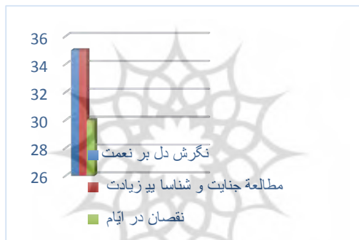
نمودار ۲. جایگاه عزلت و خلوت در سیر و سلوک عرفانی با تأکید بر منازل السائرین خواجه عبدالله انصاری