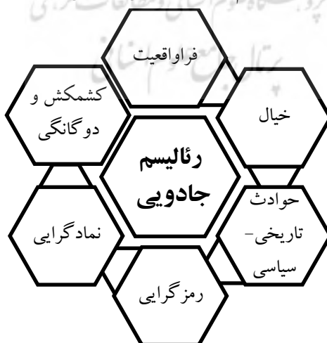
شکل ۳. نمودار عناصر در رمان المرحوم و عزاداران نیل (یافته پژوهشی)

همه این عناصر زیر در دو رمان المرحوم و عزاداران نیل به شکل زیر بیان شده است: