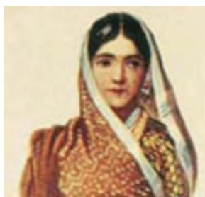
تصویر ۱۵- پوشش سر زن راجستانی

پوشش سر زنان گیلان در مقایسه با زنان راجستان، شامل کلاه کوچکی است که در زیر روسری بلند و سفید بر سر گذاشته می‌شود. این کلاه با انواع پولک و دوخت‌ها تزئین می‌شود (تصویر ۱۴). در صورتی که زنان راجستان در زیر روسری بلند خود کلاه‌های برسر نمی‌گذارند (تصویر ۱۵). به احتمال زیاد یکی از عوامل برسرنگذاشتن کلاه در این منطقه، شرایط آب‌وهوایی گرم و شرجی‌تر نسبت به گیلان است؛ البته در مناطقی مانند تالش، زنان کلاه برسر نمی‌گذارند.