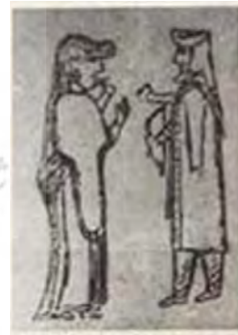
تصویر ۷- زن ماد نقش روی جعبه