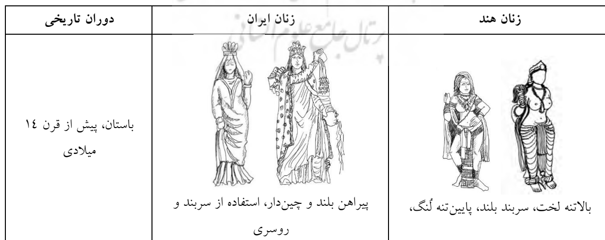
جدول ۱- مقایسه پوشاک زنان هند و ایران

با مقایسه بخش‌های مهم پوشاک زنان راجستانی و گیلانی در قرون ذکر شده، این پوشاک که شامل سربند، پیراهن و دامن بوده است، نشانگر آن است که نوع پوشاک، حتی تزئینات لباس و دامن بسیار شبیه به هم هستند، به طوری که نواردوزی‌های پایین دامن زنان گیلانی که از ویژگی‌های دامن زنان در این منطقه است، در دامن زنان راجستانی نیز یافت می‌شود. آنچه وجه تمایز این البسه به حساب می‌آید، یکی کلاه زنان گیلانی در مناطقی مانند قاسم‌آباد، رودسر، املش و چند شهر و روستای دیگر گیلان است که در بین زنان راجستانی یافت نمی‌شود، البته زنان گیلانی در منطقه تالش کلاه بر سر نمی‌گذارند و از این جهت شباهت بیشتری با زنان راجستانی دارند. دیگر تمایز در پیراهن زنان گیلانی است که دارای آستین‌های بلندتر تا مچ دست و یقه پوشیده‌تر نسبت به پیراهن زنان راجستانی است. در خصوص بخش‌های دیگر لباس مانند کفش و شلوار که مورد بررسی قرار نگرفتند، می‌توان به این نکته اشاره کرد که زنان راجستانی عمدتاً کفش به پا نمی‌کرده‌اند و شلوار نیز در مستندات تاریخی قابل مشاهده نبوده است؛ بنابراین در این تحقیق به آن‌ها پرداخته نشده است. امید است در پژوهش‌های آتی، بخش‌های دیگر پوشاک زنان و همچنین پوشاک مردان در قرون مختلف مورد مطالعه و بررسی قرار گیرند.