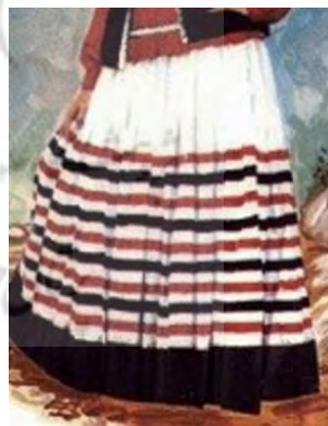
تصویر ۱۸- دامن زن قاسم‌آبادی