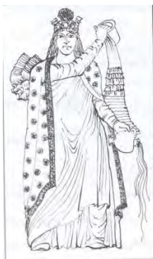
تصویر ۹- آناهیتا،

با توجه به تاریخ ایران باستان، مادها اولین قوم ایرانی بوده‌اند که می‌توان نوع و نحوه پوشش آن‌ها را از طریق کاوش‌های باستانی به دست آورد. «پیراهن مادی یک پوشش بلند است که تا زانو می‌رسد. پوشاک زنان آن دوره، از لحاظ شکل (با کمی تفاوت) با پوشاک مردان یکسان است و در زمانی دراز، پوشاک زنان با کندی به تدریج تنوع گرفته است (تصویر ۷). یکی از نقوش بانوان منتسب به پارسی‌ها، زنی را نشان می‌دهد که پیراهنی بلند با آستین کوتاه پوشیده است و پایین دامنش ریشه دارد.» (ضیاءپور، ۱۳۴۷: ۵۱). در دوره هخامنشی، نوع پوشاک زنان شباهت زیادی با دوره مادها دارد، اما در دوره اشکانی این نوع پوشش متفاوت می‌شود (تصویر ۸). «پوشاک بانوان در آن دوره، پیراهن بلند است که تا روی زمین می‌رسیده و نیز فراخ و آستین‌دار و یقه‌راست بوده است، پیراهنی دیگر داشته‌اند که روی اولی می‌پوشیدند. قد این یک، نسبت به اولی کوتاه و ضمناً یقه‌باز بوده است و روی این دو پیراهن، چادری بر سر می‌کردند.» (ضیاءپور، ۱۳۴۷: ۸۴-۸۱). «لباس زنان در دوره ساسانیان را عموماً پیراهن یک‌دست و بلند و پرچین تشکیل می‌داده که گاهی آن را با نواری در زیر سینه یا کمی پایین‌تر جمع می‌کردند و می‌بستند، گاهی نیز قسمت انتهای دامن را به وسیله پارچه‌ای اضافی و پرچین‌تر می‌دوختند. هر دوی این پیراهن‌ها، آستین‌هایی بلند تا مچ دست‌ها و یقه‌ای گرد و ساده و نسبتاً بسته داشته‌اند.» (تصویر ۹) (چیت‌ساز، ۱۳۷۹: ۱۴).