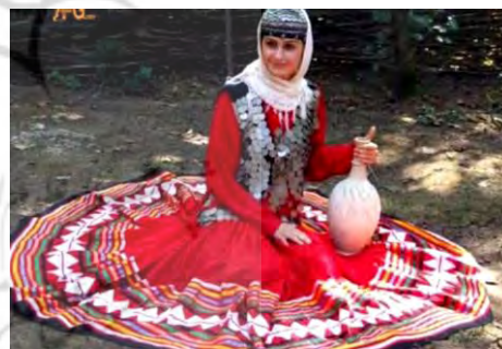
تصویر ۱۰- لباس محلی زنان قاسم‌آباد (رهنمایی، ۱۳۹۳)