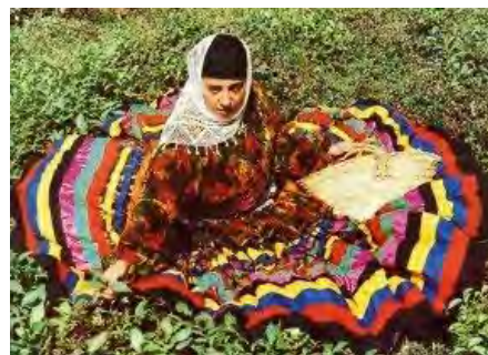
تصویر ۱۲- لباس محلی زنان رودسر (رهنمایی، ۱۳۹۳)