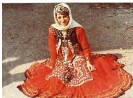
تصویر ۱۳- لباس محلی زنان املش (رهنمایی، ۱۳۹۳)