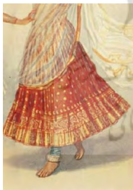
تصویر ۱۹- دامن زن راجستانی

همانطور که در تصاویر به‌دست‌آمده از لباس در گیلان مشهود است، زنان دامنی بلند و پرچین به تن می‌کرده‌اند که همچنان به همان شکل مورد استفاده قرار می‌گیرد. در پایین دامن به‌طور منظم و زیبایی نوارها و روبان‌های رنگی دوخته می‌شود (تصویر ۱۸). زنان راجستان نیز دامنی همانند زنان گیلانی به تن می‌کنند. قد دامن تا قوزک پا بلندی دارد. تزئینات روی دامن نیز مانند دامنی است که زنان گیلانی در مناطق قاسم‌آباد، املش و رودسر استفاده می‌کنند (تصویر ۱۹).