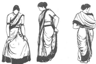
(تصویر ۴- 4 Biswas, 2017)