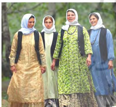
تصویر ۱۱- لباس محلی زنان تالش (رهنمایی، ۱۳۹۳)

لباس‌های محلی زنان گیلان را می‌توان به سه بخش شرق، غرب و مرکز تقسیم‌بندی کرد. لباس‌های زنان شرق گیلان به لباس «قاسم‌آبادی» (تصویر ۱۰)، لباس زنان غرب گیلان «تالشی» (تصویر ۱۱) و لباس مرکز گیلان با عنوان «رسوخی» معروف است. لباس رسوخی بیشتر در شهر ماسوله دیده می‌شود که یادگار زمان قاجار است و از شهرهایی مانند زنجان به گیلان رسوخ کرده است. پارچه‌هایی که در لباس زنان شرق و غرب گیلان به کار می‌رود، متفاوت است. در لباس زنان غرب گیلان متن پارچه‌های لباس دارای گل‌های رنگارنگ و درشت است، درحالی‌که در لباس زنان شرق گیلان زمینه پارچه ساده و یک‌رنگ است و تزیینات آن از نواردوزی‌هایی با رنگ‌های مختلف تشکیل شده است (همان: ۸). از شهرهای دیگر گیلان می‌توان به رودسر (تصویر ۱۲)، املش (تصویر ۱۳) و همچنین رودبار، رشت، بندر انزلی و صومع‌سرا اشاره کرد. هرچه به کوهپایه‌های گیلان نزدیک‌تر شویم، نوع پارچه برای دوخت لباس زنان ضخیم‌تر می‌شود، مثلاً آن‌هایی که در دیلمان زندگی می‌کنند، بیشتر از پارچه مخمل استفاده می‌کنند و آن‌هایی که در جلگه زندگی می‌کنند، لباس‌هایشان ابریشمی است؛ اما به‌طور کلی روسری و سربند (لچک)، پیراهن یا جمه، جلیقه، الجاقبا، کت، دامن، شلیته، شلوار و چادر کمر از بخش‌های اصلی لباس محلی زنان گیلان است (/گیلان/ www.hamshahrionline.ir ).