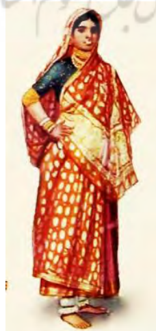
تصویر ۶- Indian clothes

راجستان- راجستان بزرگ‌ترین ایالت هندوستان است که به‌عنوان سرزمین پادشاهان شناخته شده و در گذشته راجپوتانا خوانده می‌شد. ایالت راجستان در شمال غربی هند واقع شده و در غرب آن پاکستان، در جنوب غربی آن گجرات، در جنوب شرقی آن مادیا پرادش، در شمال شرقی آن اوتار پرادش و هاریانا و در شمال آن پنجاب قرار دارد. مساحت راجستان ۳۴۲ ۲۳۹ کیلومتر مربع و مرکز آن شهر جاییور است. راجستان از ۲۵۰۰ سال پیش از میلاد و پیش از آن مسکونی بوده‌است. قبایل بهیل و مینا را نخستین ساکنان این منطقه می‌دانند. آریائیان در حدود ۱۴۰۰ سال پیش از میلاد به راجستان آمدند و با پس‌راندن بومیان پیشین به سوی جنوب، برای همیشه در راجستان نشیمن گزیدند (indiavid.org/Rajasthan-clothing-styles). - پوشاک زنان راجستان از سه بخش عمده تشکیل می‌شود: چولی (choli) بلوز یا پیراهنی معمولاً آستین کوتاه و بدون یقه و پشت آن گاهی تا کمر باز است. گاگرا (Ghaghara) که دامن بلندی است و تزئینات و نواردوزی‌های رنگی و برودری دوزی در پایین آن دوخته می‌شود. اودانی (Odhani) روسری یا شال بلندی است که روی سر قرار می‌گیرد (تصویر ۶).