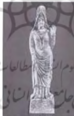
تصویر ۸- مجسمه زن پارت