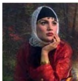
تصویر ۱۴- پوشش سر زن گیلانی