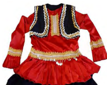
تصویر ۱۶- پیراهن زن قاسم‌آبادی