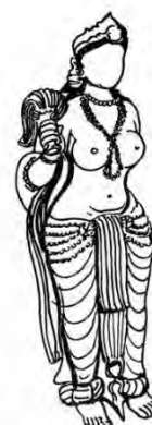
(تصویر ۱- 1 Biswas, 2017)