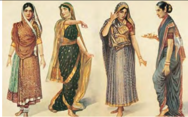
تصویر ۵-  Indian clothes

«مردمان پنجاب نیز ترکیبی از لهینگا و چولی می‌پوشند. لهینگا که دامن بلندی است، معمولاً با تزئینات و نواردوزی در پایین آن دوخته می‌شود.» (Alkazi, 1983: 109). جنس لهینگا برای استفاده روزانه از پارچه‌های پنبه‌ای است و در مراسم و جشن‌ها و عروسی‌ها به تزئینات آن با آینه‌کاری و دوخت‌های تزئینی افزوده می‌شود (Biswas, 2017: 135). شلوار نیز از پوشش‌های دیگری است که در بین دختران مرسوم است و به نام‌های سیندی سوتان (sindhi suthan)، دوگری پیجاما (dogri pajama) و کشمیری سوتان (Kashmiri suthan) در مناطق مختلف کاربرد دارد (Tarlo, 1996: 95).