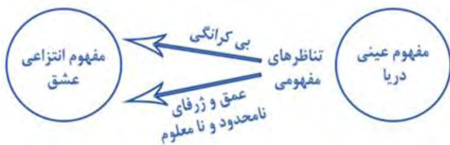
شکل ۱. نمودار استعاره مفهومی