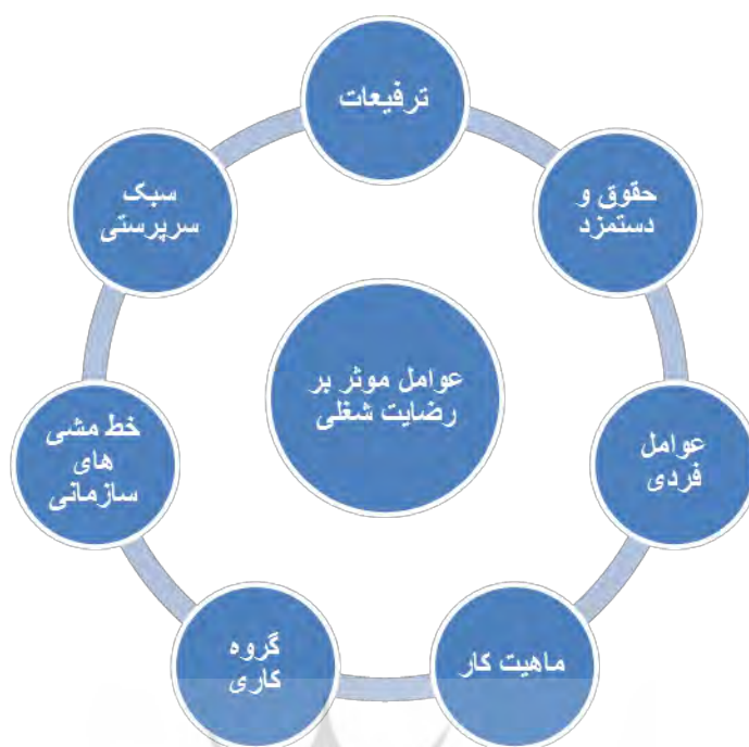
شکل ۱ عوامل موثر بر رضایت شغلی