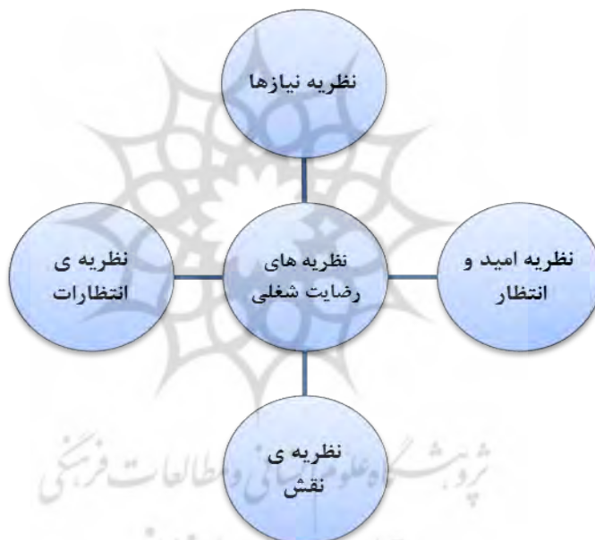
شکل ۲ نظریه های رضایت شغلی

این نظریه با نام‌های نظریه «انتظارات» و نظریه «احتمال» نیز مطرح می‌باشد. انتظارات فرد در تعیین نوع و میزان رضایت شغلی مؤثر است. اگر انتظارات فرد از شغلش بسیار باشد، رضایت شغلی دیرتر و مشکل‌تر حاصل می‌شود. مثلاً، ممکن است فردی در صورتی از شغل راضی شود که بتواند به تمام انتظارات تعیین شده خود از طریق اشتغال جامعه عمل ببوشاند. مسلماً چنین شخصی به مراتب، دیرتر از کسی که کم‌ترین انتظارات را از شغلش دارد به احراز رضایت شغلی نایل می‌آید. از این‌رو، رضایت شغلی مفهومی کاملاً یکتا و انفرادی است و باید در مورد هر فرد به طور جداگانه عوامل و میزان و نوع آن مورد بررسی قرار گیرد. این نظریه معتقد است که رضامندی شغلی به وسیله انطباق کامل امیدها و انتظارات با پیشرفت‌های فرد تعیین می‌شود، درحالی‌که نارضایتی معلول ناکامی در رسیدن به انتظارات است (رستم آبادی، ۱۳۹۴).