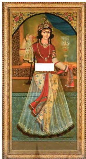
تصویر ۱۸. دوشیزه رقصنده، رقم حسین، سده بیستم، رنگ روغن، منبع: http://www.sothebys.com/en/auctions/ecatalogue/html/۱۳۱lot/۱۷۲۲۳۱-world-islamic-the-of-arts/۲۰۱۷

در بسیاری از آثار لاکه مانند کتاب، جلد آینه، جعبه ابزار... تصاویری از مجالس با حضور زنان خنیاگر دیده می‌شود. از آثار به‌جای‌مانده زیر لاکه که نشان‌دهنده صحنه‌ای از حرم‌سرا است، می‌توان به تصویر (۱۹) اشاره کرد. این نگاره جلد لاکه کتاب می‌باشد، در این تصویر دو دل‌داده در بالای تصویر قرار دارند که توسط نوازندگان سرگرم می‌شوند. در پایین کادر تصویر دو زن نوازنده در حال نواختن دو ساز تنبک و ستور هستند. در میان آنان و وسط کادر بانوی رقصنده در حال هنرنمایی است. از آثار نفیس لاکه می‌توان به تصویر (۲۰) اشاره کرد. این اثر لاکه که روایت‌گر عروسی ناصرالدین شاه است، توسط میرزا محمد تقی مذهب‌اصفهانی ترسیم شده است. میرزا محمد تقی بر هنر تذهیب و چهره‌نگاری مهارت داشت و بر اجسامی چون قلمدان، جلد کتاب و انواع قاب‌آینه کار می‌کرد. نگاره که از ۴ تصویر تشکیل شده مراسم‌هایی را نشان می‌دهد که قبل از جاری شدن خطبه‌ی عقد اجرا می‌شده، در واقع این تصاویر روایتی از آماده‌شدن عروس است.