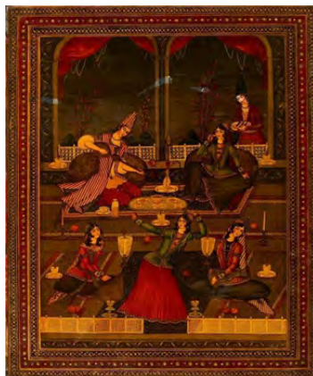
تصویر ۱۹. حرم سرا، جلد لاک‌ی کتاب، قاجار، قرن ۱۹، مجموع موزه‌ی بریتانیا،