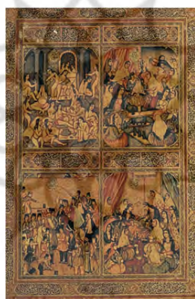
تصویر ۲۰. عروسی ناصرالدین شاه، جلد لاک‌ی کتاب، رقم میرزا محمد تقی مذهب اصفهانی، مورخ ۱۲۶۳ هـ ق، منبع:

https://www.flickr.com/photos/persianpainting/in/photostream/۲۹۷۶۰۱۰۲۰۳۳