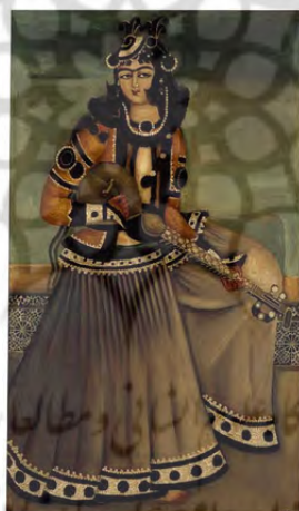
تصویر ۵. پرتره زن تار نواز حرمسرا، ۱۲۱۴-۱۲۴۵ هـ ق، ۱۸۳۰-۱۸۰۰ میلادی، رنگ روغن روی بوم، موزه ویکتوریا و آلبرت انگلستان، منبع:

http://collections.vam.ac.uk/item/O-unknown-painting-oil-tar-a-playing-unknown/woman-painting-oil-guitar-a-playing-woman/۱۳۳۵۸۶