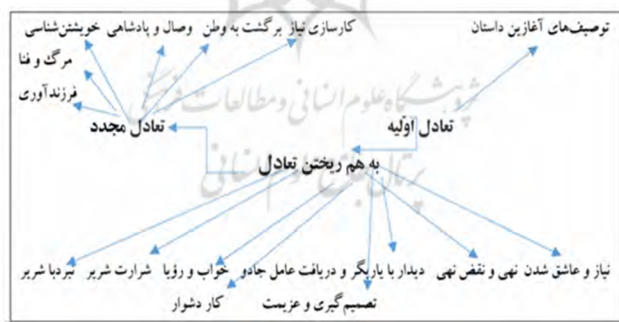
نمودار طرح کلی روایت در منظومه‌های عاشقانهٔ رمزی و تمثیلی

بر اساس دیدگاه‌های ارسطو و پراب، طرح کلی منظومه‌ها، در سه بخش تعادل اولیه، به هم ریختن تعادل و تعادل مجدد تقسیم می‌شود.