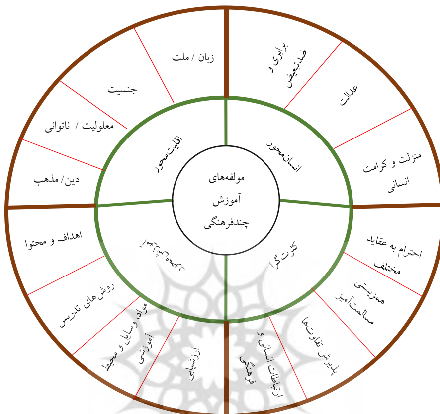
شکل ۲. مضامین اصلی و فرعی شناسایی شده آموزش چندفرهنگی