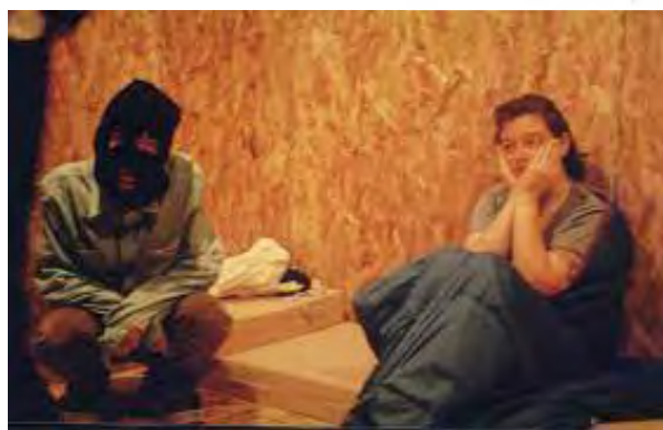
تصویر ۱. آدم‌ربایی.

در سطح ظاهر و بر مبنای تعاریف سنتی زنده بودن، تنها بخش‌های زنده این اثر، بخش‌های تعقیب و گریز و کنفرانس‌های مطبوعاتی به شمار می‌روند و بخش اصلی اثر از پیش برنامه‌ریزی شده و از پیش ضبط شده به نظر می‌رسد و اثر در مجموع یک اجرای رسانش شده با عناصری از زنده بودن به نظر می‌رسد و نه اجرایی زنده با بخش‌هایی رسانش شده. در مورد کل اثر نیز پرسش‌هایی از این قبیل مطرح می‌شوند که آیا این