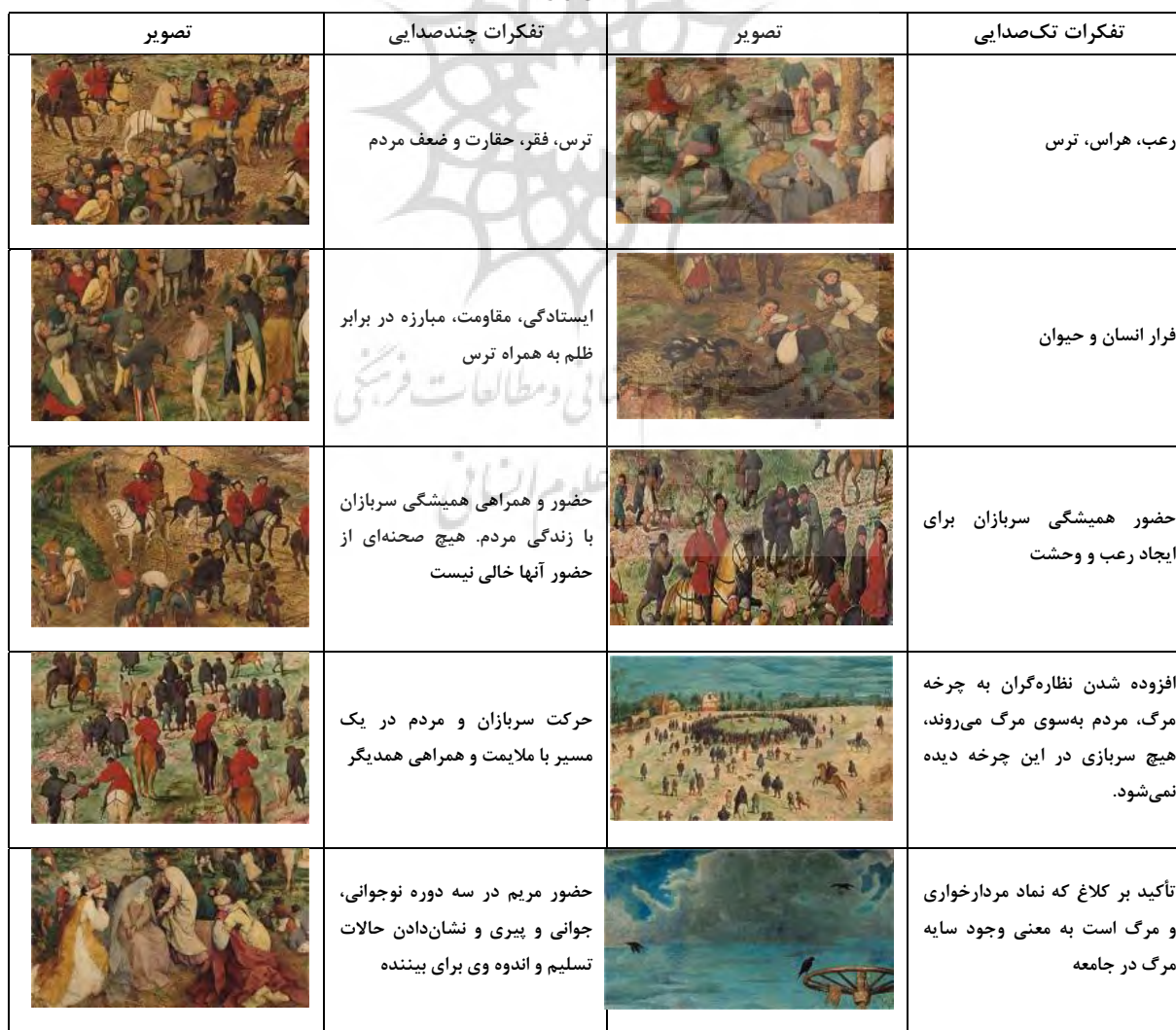
جدول ۵- صدهای برگرفته از افکار.

سربازان سرخ‌پوش به‌عنوان قدرت برتر در حال ظلم به مردم هستند و دین و دنیای مردم را در اختیار دارند. عده‌ای از مردم معترض به این ظلم هستند و عده‌ای دیگر آن را پذیرفته و با آن کنار آمده‌اند. دسته‌ای نسبت به همه‌چیز (ظلم، کشتار، غارت و یا مرگ مسیح) بی‌خیال‌اند و سرخوش به تماشای اعدام هم‌وطنان خود می‌روند و در این میان نقاش را مشاهده می‌کنیم که بدون توجه به مخاطب به ثبت واقعیت می‌پردازد. تفکرات منجر به ایجاد