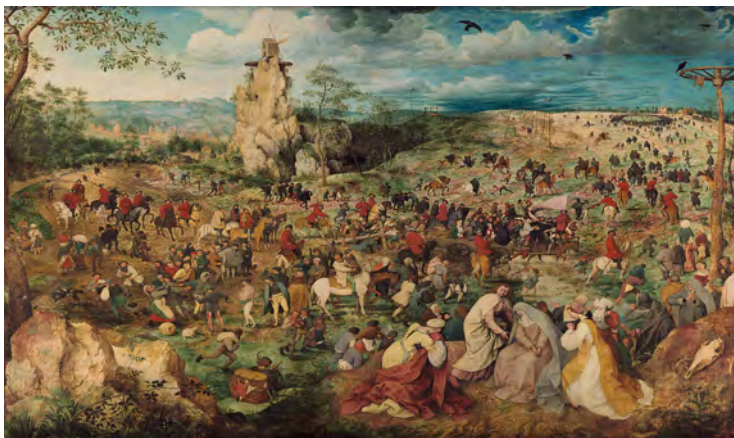
تصویر ۱- نقاشی راهی به جُلجتا اثر پیتر بروگل، ۱۵۶۴ م. مأخذ: ( https://shop.3feed.ir/book-series/ )

قسمت‌های مهمی که در نقاشی به تصویر کشیده شده عبارت‌اند از: ۱. صحنه به تصویر کشیده شده از مریم در سه مقطع سنی (سمت راست جلوی تابلو)، ۲. تصویری از نقاشی که تقریباً در مرکز متمایل به چپ می‌باشد، ۳. تصویر عده‌ای از مردم که در حال مقاومت در برابر حمله سربازان متجاوز هستند (سمت راست تابلو)، ۴. تصویر گاری حامل اعدامی‌ها که مردم در حال تماشا می‌کنند، در حالی که مسیح مصلوب شده به دنبال گاری اعدامی‌ها کشیده می‌شود (در مرکز تصویر)، ۵. تصویر یک صخره بلند و یک آسیاب که بر فراز آن قرار گرفته است (در سمت چپ، عقب تصویر) و ۶.