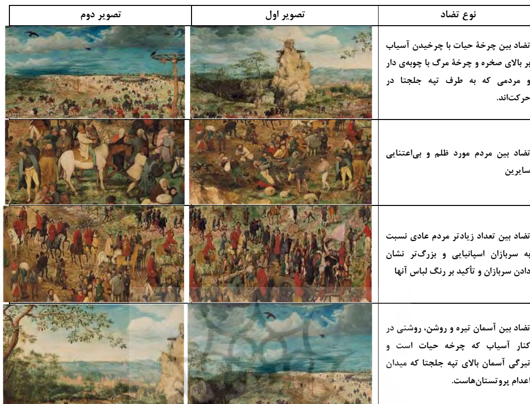
جدول ۴- حالات روحی و حرکات.