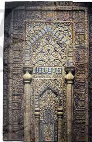
تصویر ۲۴. کتیبه‌های محراب قدیمی مسجد که اکنون در موزه برلین قرار دارد، منبع: www.pinterest.com .

۲. کتیبه ۳۰. کتیبه‌ای در سردر ورودی مسجد میرعماد قرار دارد که نشان می‌دهد سازمان میراث فرهنگی کاشان این مسجد را مرمت