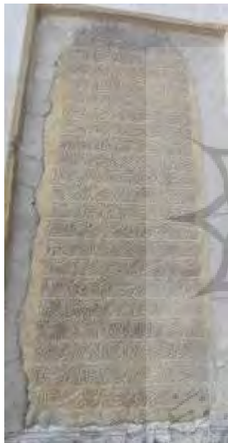
تصویر ۱۲. کتیبه فرمان نادری به تاریخ ۱۱۴۳ هـ.ق، نگارندگان.

۱۲. کتیبهٔ ۱۴. این کتیبه به فرمان نادری مشهور است زیرا این کتیبه متعلق به زمان شاه طهماسب دوم صفوی و مقارن با فتوحات نادر و ورود او به کاشان است. این فرمان به خط نستعلیق بر روی سنگ سفید نقر شده و مورخ به سال ۱۱۴۳ هـ.ق است (تصویر ۱۲). این فرمان در بالای فرمان شماره ۱۰ نصب شده است» (نراقی، ۱۳۸۲: ۱۶۱). این فرمان در باب امحاء آثار بدعت است. (جدول ۱۴)