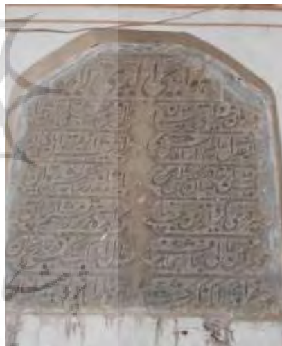
تصویر ۲۶. کتیبه مرمتی دوره فتحعلیشاه قاجار که زیر کتیبه فرمان شاه طهماسب به تاریخ ۱۲۴۳ نصب شده است (نگارندگان).

جدول ۳۰. ویژگی‌های تاریخی، ساختاری و نوشتاری کتیبه ۳۰.