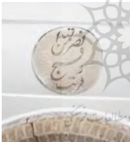
تصویر ۲۳. کتیبه بالای فرمان شاه عباس اول (نگارندگان).

۲۵۰ سال بعد به عصر خواجه عمادالدین شیروانی بانی مسجد رسیده باشد. «این محراب از جهت ظرافت و زیبایی و دقایق فنی منحصر به فرد است چنانکه بیشتر سیاحان و ایران شناسانی که به کاشان سفر کرده و محراب عظیم این مسجد را از نزدیک دیده‌اند از آن به زیبایی و شگفتی یاد کردند» (رجبی، ۱۳۹۰: ۱۴۸). البته نظرات مختلفی برای این محراب وجود دارد. واتسون در کتاب سفال زرین‌فام اشاره می‌کند که: «این محراب نمی‌بایستی برای چنین بنایی ساخته شده باشد. از این رو که اسکلت بندی کنونی این بنا نمی‌تواند به قبل از قرن نهم تعلق داشته باشد. بی‌شک این محراب را از ساختمان دیگری به آنجا آورده و در قرن نهم هجری یا بعدتر نصب شده است» (واتسون، ۱۳۸۲: ۲۷۲). این محراب با آیاتی از قرآن مجید از جزء سی به خط کوفی، رقا و ثلث تزئین شده است. (جدول ۲۶) (تصویر ۲۴).