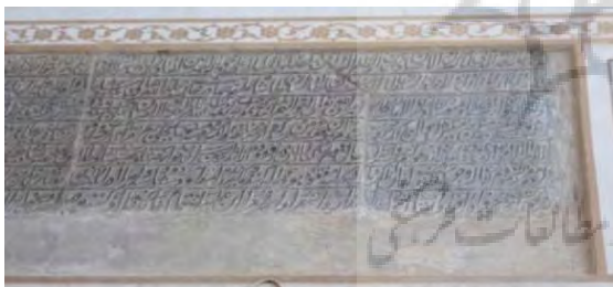
تصویر ۴. کتیبه فرمان شاه طهماسب اول.

۳. کتیبهٔ ۵. این کتیبه فرمان دیگری از شاه طهماسب اول صفوی است. این فرمان مورخ به سال ۹۴۱ هـ.ق است و با خط نستعلیق بر روی سنگ حجاری شده است. (تصویر ۵). در این فرمان ضمن اینکه به امر به معروف و نهی از منکر اشاره شده، دستور ویران سازی تمامی مکان‌های غیرشرعی مانند قمارخانه‌ها که با شریعت منافات دارد را نیز صادر کرده تا مردم کاشان و اطراف آن به این مناهات و سایر نامشروعات روی نیاورند. «شاه طهماسب سال ۹۳۹ هـ.ق از شرابخواری توبه می‌کند» ۴ (اشراقی، ۱۳۵۳: ۲۹). برخی منابع تاریخ توبه شاه طهماسب را تا سال ۹۴۱ هـ.ق نیز می‌دانند. در این کتیبه نیز به صراحت در مورد توبه او اشاره شده که همزمانی تاریخی با کتیبه را دارد. ۵ به هرحال این کتیبه در راستای منع شرابخواری بعد از توبه شاه طهماسب روی سنگ نقر شده است. در تذکره شاه طهماسب ۶ به ممنوعیت فعالیت بیت اللطف‌ها، شراب‌خانه‌ها، بوزه‌خانه‌ها ۷ و سایر نامشروعات اشاره شده است (شاه طهماسب صفوی، ۱۳۴۳: ۳۰). (جدول ۵) «شاردن معتقد است فساد و امردبازی ۸ و نیز فواحش رسمی و غیررسمی در عهد صفوی بسیار بوده و حتی زمانی که شاه طهماسب، به قصد عوام فریبی، در سراسر ممالک