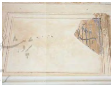
تصویر ۱۸. کتیبه‌های باقی مانده سردر ورودی زنانه.

۷. کتیبه ۲۲. کتیبه‌ای در دهلیز سمت راست مسجد داخل صحنفدر روی بدنه جرز دیوار قرار دارد که شامل یک قطعه کاشی معرق است. این کتیبه در زیر چراغدان گچبری شده قرار