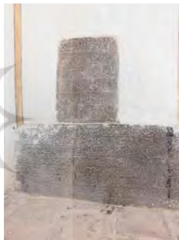
تصویر ۹. فرمان منظوم شاه عباس کبیر به تاریخ ۱۰۰۲ هـ.ق و متن فرمان شاهانه (نگارندگان).

۹. کتیبه ۱۱. این کتیبه به «فرمان شاهانه» معروف است. متن فرمان شاهانه به خط نستعلیق در زیر اشعار بالا حجاری شده است. فرمانی که در جز سمت چپ مدخل مسجد است و تاریخ آن قابل خواندن نیست، لیکن به استناد مفاد آن باید تاریخ آن هم زمان با سال فرمان شماره ۸ باشد. «این دو کتیبه بر روی هم قرار گرفته‌اند (کتیبه پایینی «تصویر ۹»). خط آن نستعلیق ریز، در هشت سطر و در یک قطعه سنگ سیاه به عرض ۹۰ و ارتفاع ۴۵ سانتی متر نقر شده است. مفاد آن مربوط به خریداران، فروشندگان و تجار است. درباره دفن رایگان اموات نیز دستوراتی آمده است» (مشکوتی، ۱۳۴۲: ۱۱). (جدول ۱۱)