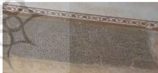
تصویر ۵. کتیبه شاه طهماسب اول، به تاریخ ۹۴۱ هـ.ق.

۵. کتیبه ۷. این کتیبه فرمان دیگری از شاه طهماسب اول است که تاریخ ۹۸۱ هـ.ق بر روی آن نقر شده است. (تصویر ۷) این فرمان بر روی سنگ سیاه و با خط نستعلیق و مربوط به رفع ظلم و ستم و رفع بدعت در دین است (مشکوتی، ۱۳۴۵: ۱۱). (جدول ۷)