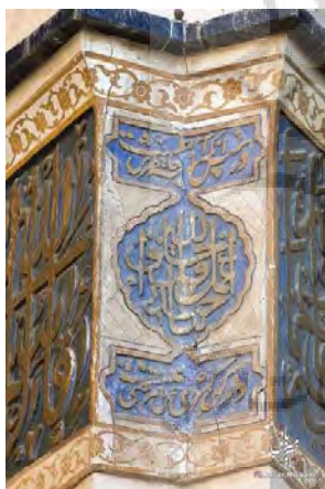
تصویر ۲. کتیبه گچی فوقانی دو طاق‌نما.

حذف‌فصل مصرع اول و دوم عبارتی عربی نوشته شده که تاکنون خوانده نشده است. این عبارت برای اولین بار توسط استاد ناصر میزبانی ۱ خوانش شده و در این مقاله ذکر شده است. در این کتیبه آمده: «اعمل اقل خلق الله حیدر بنا» (تصویر ۲) (جدول ۲).