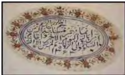
تصویر ۱۶. کتیبه زیر ایوان.

جدول ۱۸. ویژگی‌های تاریخی، ساختاری و نوشتاری کتیبه ۱۸.