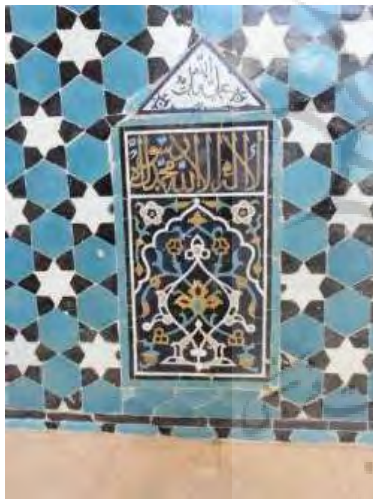
تصویر ۲۱. کتیبه دیواره شبستان زیرگنبد (نگارندگان).

داخل شبستان و زیر گنبد و در طرف راست محراب نصب شده است. این منبری با گچ و آجر بنا شده و دارای چهار متر ارتفاع و شش پله است. دو طرف آن با نهایت استادی از کاشی‌های معرق زینت شده و سالم و دست نخورده بر جای مانده است. در کتیبه سمت راست ۲۳ آن نوشته شده است: فی الایام دولته السلطان الاعظم الخاقان الافخم والاکرم ابوسعید ملکه و خلداه و سلطانه» (مشکوتی، ۱۳۴۵: ۱۳). (تصویر ۲۲) «درست در بالای این کتیبه عبارت «الحمد لله در وسط و سبحان الله و الله» بصورت خط کوفی بنایی در اطراف آن نگاشته شده است و در سمت راست آمده: «عمل حیدر کاشی تراش» و بالای همین نوشته، عبارت «یا غیاث المستغیثین اغثنی» آمده است. نوع خطوط بکار رفته ثلث است» (نراقی، ۱۳۸۲: ۱۴۹). چنانچه در تاریخ آمده ابوسعید ۲۴ در سالهای بین ۷۱۷ تا ۷۳۶ هـ. ق در