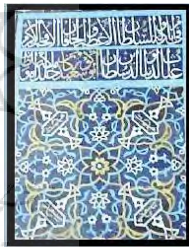
تصویر ۲۲. کتیبه منبر.

جدول ۲۵. ویژگی‌های تاریخی، ساختاری و نوشتاری کتیبهٔ ۲۵.