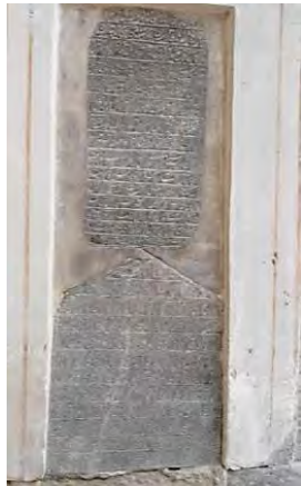
تصویر ۸. کتیبه‌های مربوط به فرمان شاه عباس اول صفوی، کتیبه‌های ۶ و ۷ که روی هم قرار گرفته‌اند، به تاریخ ۹۹۹ و ۱۰۲۲ هـ.ق.

جدول ۹. ویژگی‌های تاریخی، ساختاری و نوشتاری کتیبه ۹.