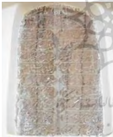
جدول ۱۱. ویژگی‌های تاریخی، ساختاری و نوشتاری کتیبه ۱۱.

۱۱. کتیبه ۱۳. این کتیبه فرمانی متعلق به شاه سلطان حسین صفوی به خط نستعلیق و مورخ به سال ۱۱۰۶ هـ.ق است. «این فرمان در داخل صحن مسجد بر روی یک قطعه سنگ مرمر بطول حدوداً ۳ متر در ۰/۵ متر نقر شده است که در باب منع اعمال شنیع و اعمال مجازات سنگین برای آن است» (نراقی، ۱۳۸۲، ۱۶۷). این فرمان همزمان با سال اول جلوس شاه سلطان حسین داخل مسجد نصب