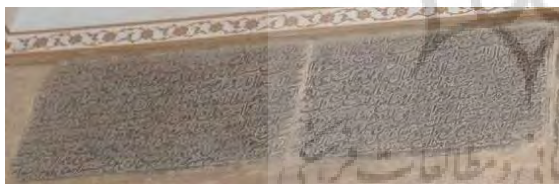
تصویر ۷. فرمان شاه طهماسب اول، مورخ ۹۸۱ هـ.ق (نگارندگان).

جدول ۷. ویژگی‌های تاریخی، ساختاری و نوشتاری کتیبه ۷.