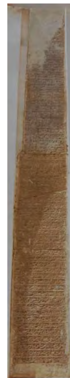
تصویر ۱۱. فرمان شاه سلطان حسین به تاریخ ۱۱۰۶ هـ.ق.