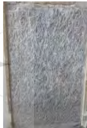
تصویر ۱۳. کتیبه فرمان شاه صفی ابن صفی میرزا به تاریخ ۱۰۴۸ هـ.ق (نگارندگان).

گروه سوم: کتیبه‌های حاوی پیام‌های دینی مذهبی و تزئینی تکرار فراوان کتیبه‌های برگرفته از قرآن کریم بر روی دیوارهای مساجد و سایر ابنیه، به انسان یادآوری می‌کند که تار و پود حیات اسلامی از آیات قرآن تنیده شده و از لحاظ معنوی متکی بر قرآنت قرآن و نماز است. «اگر بتوان فیضی را که از قرآن کریم سرچشمه می‌گیرد یک ارتعاش معنوی خواند، باید گفت که تمامی هنر