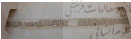
تصویر ۱۹. کتیبه‌های ایوان.

جدول ۲۰. ویژگی‌های تاریخی، ساختاری و نوشتاری کتیبه ۲۰.