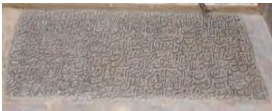
تصویر ۶. کتیبه فرمان شاه طهماسب اول، به تاریخ ۹۷۹ هـ.ق (نگارندگان).

جدول ۶. ویژگی‌های تاریخی، ساختاری و نوشتاری کتیبه ۶.