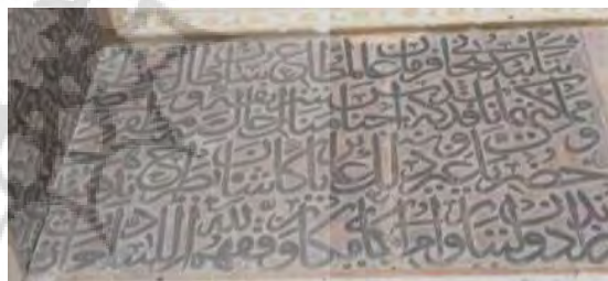
تصویر ۳. فرمان‌شاه جهان‌شاه و همسرش، به تاریخ ۸۶۹ هـ.ق (نگارندگان).

۲. کتیبهٔ ۴. این کتیبه فرمانی از شاه طهماسب اول است. «کتیبه‌ای در بالای صفا راست جلوخان مسجد به نام شاه طهماسب اول صفوی، مورخ به سال ۹۳۲ هـ.ق است که با خط نستعلیق بر روی سنگ نقر شده است» (مشکوتی، ۱۳۴۶: ۸). (تصویر ۴) در این فرمان موارد رفع ظلم، برقراری عدالت، برانداختن بدعت در دین اسلام و منع پرداخت مالیات ذکر شده است. (جدول ۴)