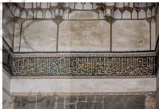
تصویر ۱. کتیبه ۱، سردر ورودی مسجد میرعماد کاشان (نگارندگان).

جدول ۱. ویژگی‌های تاریخی، ساختاری و نوشتاری کتیبه ۱.