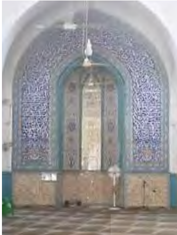
تصویر ۲۵. کتیبه‌های محراب جدید (نگارندگان).