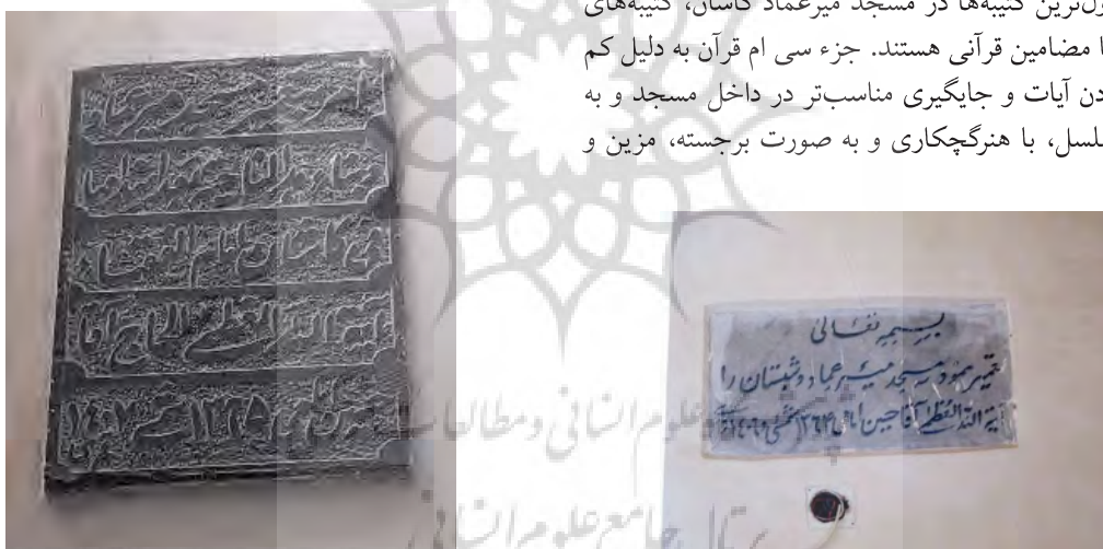
تصویر ۲۹. کتیبه مرمتی داخل مسجد با سنگ مرمر سیاه.

متداول‌ترین کتیبه‌ها در مسجد میرعماد کاشان، کتیبه‌های مذهبی با مضامین قرآنی هستند. جزء سی ام قرآن به دلیل کم حجم بودن آیات و جایگیری مناسب‌تر در داخل مسجد و به طور متسلسل، با هنرگچکاری و به صورت برجسته، مزین و