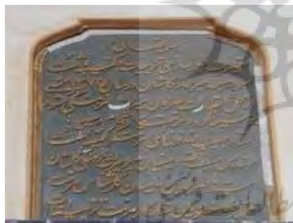
تصویر ۲۷. کتیبه مرمتی سردر ورودی مسجد (نگارندگان).

کرده است. این کتیبه در روی گچ و با خط نستعلیق نگاشته شده است. این متن حاوی تاریخ مرمت به سال ۱۳۷۵ هـ. ش نام مرمتگر، مدیر میراث فرهنگی وقت، نام کارشناس مرمت و استاد کار را در خود جای دارد. (جدول ۳۰) (تصویر ۲۷) ۳. کتیبه ۳۱: کتیبه مرمتی دیگری داخل مسجد میرعماد داخل شبستان وجود دارد. این کتیبه در ارتفاع حدود دو نیم متری نصب شده است. کتیبه مرمتی مذکور روی یک تکه سنگ مرمر سفید و با خط نستعلیق چنین نقر کرده‌اند: «بسمه تعالی تعمیر نمود مسجد میرعماد و شبستان را آیه الله العظمی آقا حسین امامی ۱۳۶۴ شمسی و ۱۴۰۶ قمری». (جدول ۳۱) (تصویر ۲۸) ۴. کتیبه ۳۲: این کتیبه مانند کتیبه مرمتی شماره ۳۱ است. در متن کتیبه پنج سطری این طور ذکر شده است: «امر به تعمیر مسجد میرعماد و بناء هدالناحیه بعد انهدام‌ها