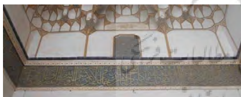
تصویر ۱۴. کتیبه سردر ورودی مسجد میرعماد.

جدول ۱۶. ویژگی‌های تاریخی، ساختاری و نوشتاری کتیبه ۱۶.