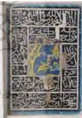
تصویر ۲۰. کتیبه زیر چراغدان که آینه اش برداشته شده و یک کاشی دیگر جایگزین آن شده است (نگارندگان).