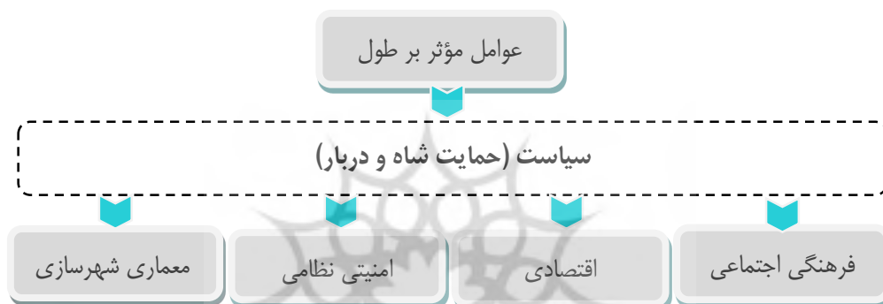
تصویر ۱: عوامل مؤثر بر ماندگاری معماری و شهرسازی در عصر صفوی

بررسی شواهد و قراین موجود در منابع نشان می‌دهد افزایش عمر مفید ابنیه در هر دوره و به شکل ویژه در دوره صفوی به‌عنوان دوره تاریخی لحاظ شده در این مقاله، تابع عوامل زیر است. عوامل به‌دست‌آمده حاصل دسته‌بندی مقررات و قوانین هرچند محدود در دوران صفوی است. این عوامل پس از دسته‌بندی شواهد در چهار دسته کلی (تصویر ۱) قابل‌بازیابی هستند: ۱. عوامل فرهنگی و اجتماعی، ۲. عوامل اقتصادی، ۳. عوامل امنیتی و نظامی و ۴. عوامل معماری و شهرسازی. (در همین قسمت قابل‌تذکر است که به علت نقش بی‌همتای شاه، نظرات، سلاقی و آرای وی به‌خصوص در نیمه دوم دوره صفوی در کلیه امور کشور و نبود نهاد منسجم و جداگانه برای بررسی امور ساخت‌وساز و همچنین پرهیز از تکرار، عامل سیاست که بخش مشترکی از تمام عوامل چهارگانه فوق است، حذف می‌شود.)