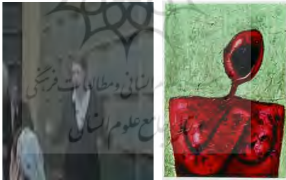
تصویر ۱۰. «فی فی از خوشحالی زوزه می‌کشد» از بهمن محمص (URL9) و ساعت ۱، دقیقه ۸، ثانیه ۵۸ فیلم آوازهایی از طبقه‌ی دوم .

«فی فی از خوشحالی زوزه می‌کشد» نام یکی از معروف‌ترین آثار محمص است (تصویر ۱۰، سمت راست). این تابلو که در عنوانش نیز تم‌های دوگانه‌ی گروتسکی به‌خوبی قابل مشاهده است، تا لحظه‌ی مرگ، در کنار محمص بود. او در این تابلو، مطابق با مولفه‌ی اندام‌های گروتسکی باختین، بدنی را ترسیم کرده است که صورتی با دهان گشاده دارد. این گشادگی تا اندازه‌ای اغراق‌آمیز است که بیشتر صورت را دربرگرفته و سایر اعضای صورت به تصویر درنیامده‌اند. این بدن، دارای سینه‌هایی بزرگ و تغییرشکل‌داده است که تقریباً هم‌اندازه یا حتی بزرگ‌تر از سر او هستند. هنگامی که مخاطب به این تابلو می‌نگرد، احساس طنز را توأم با ترس تجربه می‌کند؛ آن چیزی که در نظریه‌ی باختین تحت عنوان تم‌های دوگانه بررسی شد. در پلان ساعت ۱، دقیقه ۸، ثانیه ۵۸ فیلم آوازهایی از طبقه‌ی دوم ، افراد حاضر در یک جلسه، همگی با دیدن صحنه‌ای، شروع به فرار می‌کنند. وجود زنی که در اثر ترس، فریادکشان در حال دویدن است و زنی که در کمال آرامش در جای خود نشسته است، احساس خنده و ترس را در کنار هم به مخاطب القا می‌کند. در برشی از این پلان، زنی که از ترس در حال فریاد کشیدن است، دهانی کاملاً گشاده دارد. وجود دهان‌های گشاده و تم‌های دوگانه‌ی خنده‌دار و ترسناک در یک قاب، از ویژگی‌های مهم گروتسکی این تصاویر است که به‌خوبی مشاهده می‌شوند (تصویر ۱۰، سمت چپ).