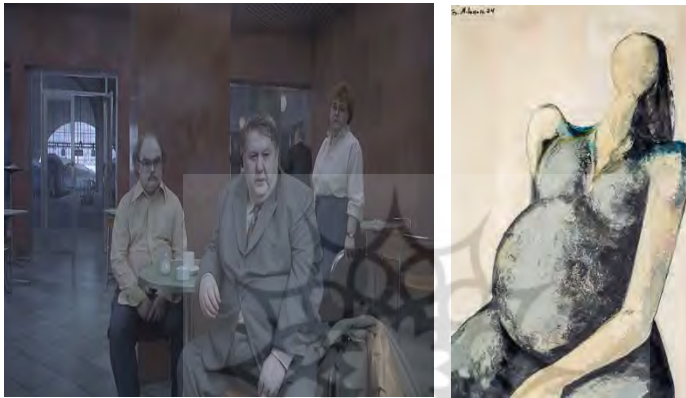
تصویر ۹. تابلویی از بهمن محمصص (URL8) و ساعت ۱، ثانیه ۳۵ از فیلم اندرسون.

در یکی دیگر از آثار محمصص، زنی با شکم برآمده و سینه‌های از فرم خارج‌شده به تصویر درآمده است که با پلان ساعت ۱، ثانیه ۳۵ از فیلم اندرسون قابل تطبیق است (تصویر ۹).