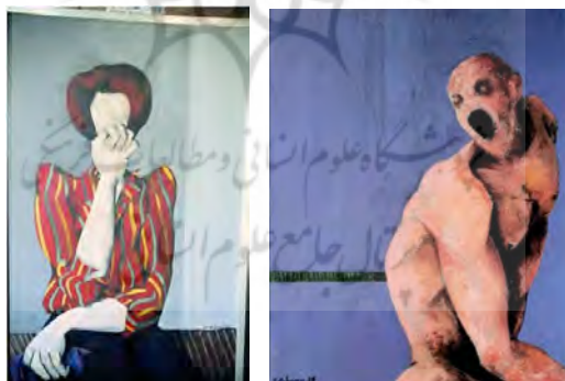
تصویر ۴. نحوه برخورد محمصص با چشم در آثار مختلف (URL4)

صورت‌های آثار بهمن محمصص، حالت گویا ندارند. به‌غیر از تعداد اندکی از آثار که در آنها مثلاً به چهره حالتی خوشحال داده شده است، چهره‌ها بی‌حالت هستند. چنین مسئله‌ای به این دلیل است که محمصص از اعضای چهره، آن‌هایی را که در ایجاد حالت و گویایی به چهره دخالت دارند مخصوصاً چشم، زیاد به تصویر نمی‌کشد؛ به‌بیانی دقیق‌تر چشم‌ها یا نیستند و یا به دو صورت حضور دارند: به‌صورت یک نقطه که در مقایسه با ابعاد چهره و عناصر تعیین‌کننده اثر به چشم نمی‌آیند یا به‌صورت برآمده تصویر می‌شوند (تصویر ۴) (طاهری ۱۳۸۹: ۱۳۵).