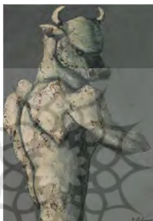
تصویر ۷. مینوتور ایستاده اثر بهمن محخص (URL6)