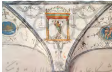
تصویر ۱. بخشی از تزئین دیوار کاخ پالاتینو با گروتسک (URL1)

گروتسک به‌عنوان صفتی کلی در زبان انگلیسی، برای هر چیز عجیب، فانتزی، زشت، نامتجانس، ناجور یا مشمئزکننده و بیشتر برای توصیف اشکال و فرم‌های غیرعادی استفاده می‌شود (طاهری ۱۳۸۹: ۳۵). واژه گروتسک و رویکرد بصری آن با کشف برخی تصاویر غیرعادی در راهروهای زیرزمینی استخر تیتوس ۱ ، کاخ‌های پادشاهی پالاتینو ۲ و خرابه‌های کاخ طلایی نرون ۳ وارد زبان شد. از آنجاکه این تصاویر در دالان‌های دفن‌شده تالارهای قصر و بعدها در دیگر محل‌های باقی‌مانده از رومیان، مانند شهر پمپئی کشف شدند، آن را به‌عنوان دیوارنگاره‌های غارها یا گروتو ۴ می‌شناختند؛ زیرا در تاریکی و در این دنیای زیرزمینی و محیطی مانند غار ایجاد شده بودند (آدامز و یتس ۱۳۹۵: ۲۵). در سال ۱۴۸۰ میلادی و به دنبال افزایش اکتشافات باستانی در محوطه کاخ نرون، استفاده از گروتسک بین هنرمندان محبوبیت زیادی پیدا کرد و تحقیقات پیرامون آن آغاز شد (Acidiani Lu- 1999: 58). گروتسک در هنرهای بصری نوعی تزئین بود که در آن هنرمندان از تصاویر انسانی، گیاهی و حیوانی تغییرشکل‌یافته و غیرمعمول استفاده می‌کردند (تصویر ۱).