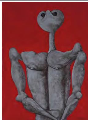
تصویر ۳. تابلوی بدون عنوان اثر بهمن محمصص (URL3)

صورت‌های آثار بهمن محمصص، حالت گویا ندارند. به‌غیر از تعداد اندکی از آثار که در آنها مثلاً به چهره حالتی خوشحال داده شده است، چهره‌ها بی‌حالت هستند. چنین مسئله‌ای به این دلیل است که محمصص از اعضای چهره، آن‌هایی را که در ایجاد حالت و گویایی به چهره دخالت دارند مخصوصاً چشم، زیاد به تصویر نمی‌کشد؛ به‌بیانی دقیق‌تر چشم‌ها یا نیستند و یا به دو صورت حضور دارند: به‌صورت یک نقطه که در مقایسه با ابعاد چهره و عناصر تعیین‌کننده اثر به چشم نمی‌آیند یا به‌صورت برآمده تصویر می‌شوند (تصویر ۴) (طاهری ۱۳۸۹: ۱۳۵).