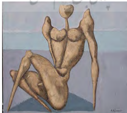
تصویر ۲. تابلوی «مرد در ساحل» اثر بهمن محمص (URL)

در اکثر آثار محمص ویژگی‌های گروتسکی معرفی شده توسط باختین- خصوصاً اندام‌های گروتسکی- به‌خوبی قابل درک و بررسی است (تصاویر ۲ و ۳). در اندام گروتسکی باختین، دهان مهم‌ترین عضو چهره است و معمولاً به صورت دهان گشاده نمایش داده می‌شود که نمادی از مرگ است؛ از سوی دیگر، چشم‌ها یا سهمی در تصویر گروتسکی ندارند و یا به‌صورت برآمده نشان داده می‌شوند (طاهری ۱۳۸۹: ۱۵۷). همچنین شکم‌های برآمده و اندام جنسی مردانه نقش مهمی را در گروتسک ایفا می‌کنند. بدن‌های نقاشی شده توسط محمص اکثراً تغییر شکل داده‌اند. در آثار او تغییر شکل فیگورها به‌صورت‌های مختلفی مشهود است؛ نشانه‌هایی نظیر سر کوچک، بدون اعضای اصلی یا اعضای اغراق‌شده، گردن بیش‌ازحد دراز، شانه‌های بسیار برآمده که اتصالی به شدت باریک با بالاتنه دارند، کمرهای بیش‌از حد باریک، باسن و ران‌هایی بزرگ که به زانوهای بیش‌ازحد کوچک و ساق‌های بسیار باریک و شکم‌های برآمده و اندام‌های جنسی مردانه ختم می‌شوند (طاهری ۱۳۸۹: ۱۳۹). می‌توان دید که محمص در نمایش اندام، منطبق با نظریه باختین عمل کرده است.