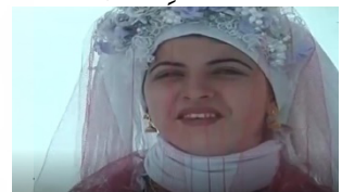
تصویر ۲. نماهایی از لحظه حیرت (مرثیه برف)

کارکرد عناصر سینمایی؛ رابطه‌ای طولی با نمادها و عناصر نظم آیینی ایجاد نمی‌کند؛ بلکه برعکس عملکرد عناصر سینمایی در ساختن جهان تصویری به‌گونه‌ای است که بیش از هر چیز، گسستی را میان این دو نظم ایجاد می‌کند که از شکاف آن، نظم ثانویه‌ای پدید می‌آید که نه کاملاً در پیوند با جهان تصاویر سینمایی است و نه در پیوند با جهان آیین؛ به‌گونه‌ای که دیگر جهان تصاویر سینمایی؛ یعنی آنچه بر پرده به نمایش می‌آید، بازنمای یک جهان خودآیین و مستقل نیست. درک بازنمایی سینما در این معنا درک «فرایندی شهودی و بی‌واسطه است که تأکید آن بر نیروی خیال، واکنش حسی، و بازنمایی ذهنی حضور [هم‌زمان بدن و عواطف] در جهان [و پرده] است.» (زین‌العابدینی ۱۴۰۱: ۱۸۵)؛ به این شکل که نظامی تازه از این شکاف پدیدار می‌شود که اساس آن در عین متضادبودن، هم‌سو با ارزش‌های اخلاقی-دینی فردفرد تماشاگران و نیز تجارب مشترک و جمعی آنان است. در واقع