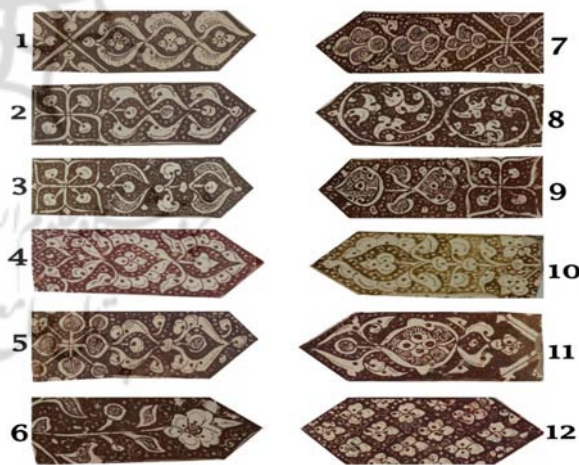
تصویر ۷: انواع نقوش گیاهی به‌کار رفته در کاشی‌های چلیپایی شکل بنای امامزاده یحیی

کاشی‌ها تکرار شده‌اند. در این میان تکرار یک نقش خاص گیاهی یا اسلیمی روی کاشی‌های چلیپایی شکل بیشتر از نمونه‌های هشت‌گوشه است. بر همین اساس باید به این نکته اشاره شود که در بررسی صورت گرفته روی کاشی‌های چلیپایی شکل این بنا، حداقل ۱۲ نقش مختلف گیاهی و اسلیمی مورد شناسایی قرار گرفت که در تصویر ۴ مشخص شده‌اند. در میان این نقوش حداقل شش نقش از فراوانی بیشتری نسبت به باقی نمونه‌ها برخوردار هستند (سه ردیف اول تصویر ۵). در پیرامون این نقوش نیز از طرح‌های بسیار کوچک نقطه‌ای، هلالی یا ویرگولی شکل به‌عنوان عناصر پرکننده طرح استفاده شده است. این شیوه پرکننده نقش، یکی از نشانه‌های شاخص سبک کاشی‌کاری کاشان در تولید سفال و کاشی زرین‌فام طی قرون ۶ تا ۸ ه.ق است (Pope, 1939: 1594 و Ettinghausen, 1936: 45). معمولاً در وسط این کاشی‌ها نیز برای اینکه برخی نقوش تکرار شوند به یک مرکز منتهی شده و از یک‌دیگر به نحوی تفکیک شوند، از نقوشی هم‌چون گل چهار برگ یا نقش ضربدری شکل استفاده کرده‌اند؛ موضوعی که تقریباً در بیشتر کاشی‌های چلیپایی مطالعه شده این بنا ملاحظه گردید.