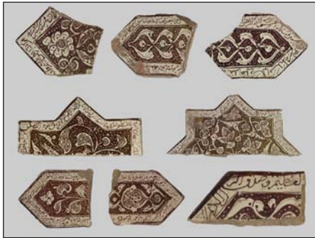
تصویر ۴: نمونه‌هایی از قطعات کاشی زرین‌فام موزة ارمیتاژ که احتمالاً متعلق به بنای امامزاده یحیی ورامین باشند

کاشی‌های ستاره‌ای شکل بنای امامزاده یحیی ورامین از یک جنبه کاملاً شاخص بوده و با نمونه‌های مشابه در سایر ابنیه متفاوت هستند و آن ابعاد آنها است. ابعاد کلی این کاشی‌ها 31 \times 31 سانتی‌متر است (Masuya, 2000: 44)؛ در حالی که معمولاً کاشی‌های ستاره‌ای شکل زرین‌فام در ایران ابعاد 21 \times 21 سانتی‌متر یا بعضاً کوچک‌تر دارند (قوچانی، ۱۳۹۷: ۱۰). بدین سبب از لحاظ اندازه این کاشی‌ها کاملاً شاخص و متفاوت با نمونه‌های مشابه دیگر هستند. نکته دیگری که در ارتباط با این کاشی‌ها باید بیان شود آن است که تمامی نقوش به کار رفته در آنها به صورت تک‌رنگ زرین یا طلایی بوده و هیچ رنگ دیگری هم‌چون فیروزه‌ای یا لاجوردی، در آنها استفاده نشده است؛ موضوعی که عملاً در بسیاری از کاشی‌های مشابه دیگر کمتر به چشم می‌خورد.