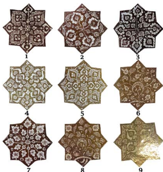
تصویر ۶: شاخص‌ترین نقوش به‌کار رفته در کاشی‌های هشت‌گوشه بنای امامزاده یحیی

کاشی‌های هشت‌گوشه به نسبت نمونه‌های چلیپایی شکل از تنوع نقش‌پردازی بیشتری برخوردار هستند. اما عملاً برخی از نقوش به‌کار رفته در این کاشی‌ها را می‌توان در نمونه‌های چلیپایی نیز ملاحظه کرد. به‌عنوان نمونه نقوش به‌کار رفته در کاشی‌های چلیپایی شماره ۵، ۱۰ و ۱۱ از شکل ۳ عملاً در تعدادی از نمونه‌های هشت‌گوشه تکرار شده است. علاوه بر این، با وجود تنوع فراوان نقوش به‌کار رفته در این کاشی‌ها، تعداد ۹ نقش مختلف مورد شناسایی قرار گرفت که در بسیاری از این کاشی‌ها به‌کار رفته است (تصویر ۶). در این میان، تمامی این نقوش از ترکیب تزئینات گیاهی، اسلیمی یا هندسی شکل گرفته‌اند، اما بعضاً و به‌ندرت نقش دو یا سه ماهی بسیار کوچک نیز در گوشه برخی کاشی‌ها دیده می‌شود (نقش ۶ از تصویر ۶). تقریباً مشابه این کاشی‌ها اما با ابعاد کوچک‌تر در موزه متروپولیتن وجود دارند که تاریخ ساخت آنها ۶۶۳ ه.ق است (URL.6)؛ (تصویر ۷). نظر به اینکه نقوش این کاشی‌ها تشابه زیادی با نمونه امامزاده یحیی دارند و نیز این قطعات نیز به شیوه تک‌رنگ زرین ساخته شده‌اند، احتمال دارد که توسط یک سازنده ساخته شده باشند؛ هر چند که اندازه کوچک‌تری نسبت به نمونه‌های امامزاده یحیی دارند. بنایی که این کاشی‌ها در آن به‌کار رفته بودند نیز مشخص نیست (Grube, 1962: fig3؛ Carboni و Watson, 1985: 191)