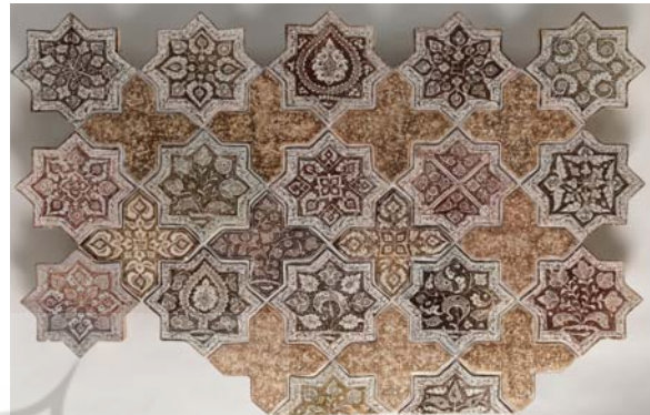
تصویر ۷: کاشی‌های زرین فام موزه متروپولیتن با تاریخ ساخت رمضان ۶۶۳ ه.ق، احتمالاً تولید کاشان (URL. 2)

(Masuya, 1993: 16 &) بدین سبب نمی‌توان بیان کرد که این کاشی‌ها در گذشته و در چه بنایی مورد استفاده قرار گرفته‌اند. بجز این مورد، کاشی‌های ستاره‌ای شکل شناخته شده در سایر ابنیه، تشابه چندانی از لحاظ نقوش تزئینی با نمونه‌های امامزاده یحیی ندارند؛ از این روی در پژوهش حاضر مطالعه مقایسه‌ای با آنها صورت نگرفته است.