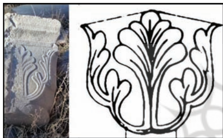
تصویر ۱۲: سرستون با نقش آکانتوس؛ قلعه شلمزار (نگارندگان، ۱۳۹۳)