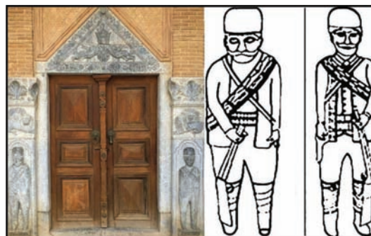
تصویر ۲۳: سربازان نگهبان ورودی قلعه چالستر