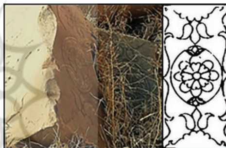
تصویر ۱۰: تصویر و طرح لوتوس (نیلوفر هشت‌پر)؛ پایه ستون‌های تالار تخریب‌شده طبقه دوم (نگارندگان، ۱۳۹۳)

از دیگر نقوش مورد کاربرد در تزئینات این بنا که پیشتر به‌شکلی انتزاعی‌تر در طرح و نقش فرش‌های بختیاری حضوری پررنگ داشت و پس از استحاله‌یافتن طبق الگوی قجری در بناها و ورود مجددش به طرح و نقش قالی‌های پسین‌تر بختیاری به تغییر طبیعت‌گرایانه‌تر رسید، آکانتوس است که در جزئیات تصویر ۱۴ که یک قالی قدیمی بختیاری است، به‌وضوح دیده می‌شود. اما در قالی‌های پسین‌تر، طرح و نقش (که نمونه‌های بی‌شماری برای آن می‌توان مثال آورد، خصوصاً در دست‌بافته‌های روستایی و شهری بختیاری) به فرم طبیعت‌گرایانه‌ای که در تزئینات بناهای قجری در ملک بختیاری به وضوح می‌توان آنرا ملاحظه کرد؛ بیشتر متمایل شده‌است. «آکانتوس» برگی است شبیه کنگر یا تاک و فرمی نزدیک به پالمت دارد؛ اما با برگ‌های پهن‌تر (تصویر ۱۱). «گچ‌بری تزئینی در کاخ تیسفون با نقش برگ و شاخه، در