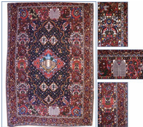
تصویر ۱۵: قالی خشتی بی‌بی‌باف چالستر