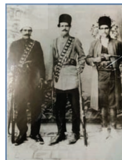
تصویر ۲۷: سربازان بختیاری دوره مشروطه