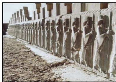
تصویر ۱۹: سربازان نگهبان تخت‌جمشید