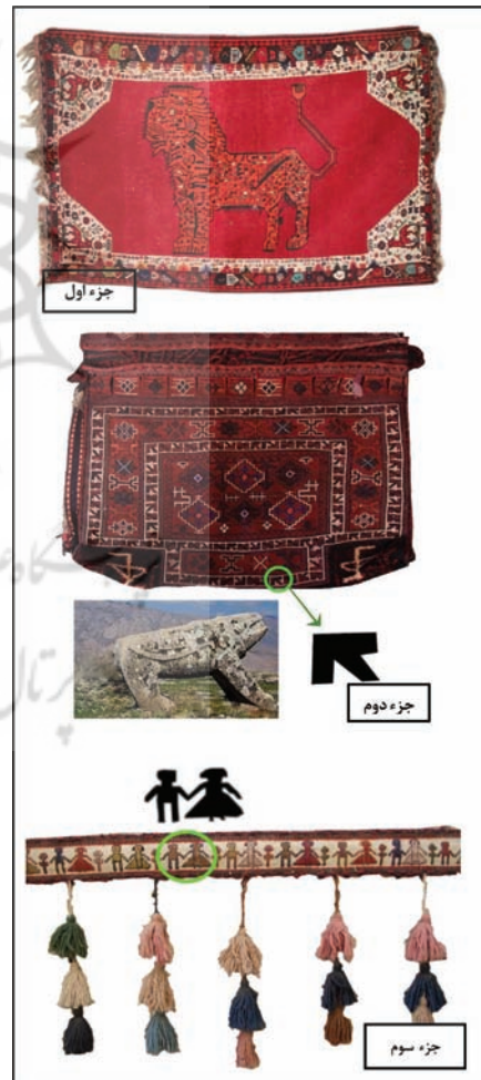
تصویر ۱۸: جزء اول: قالی- گبه بختیاری، روستای مازه‌سوخته، بخش بازفت بالا؛ جزء دوم: خورجین گلیم‌باف اصیل بختیاری (اولاد حاجعلی)، روستای سرمازه، بخش میانکوه؛ جزء سوم: شیردنگ (نوار تزئینی دست‌باف برای تزئین سیاه‌چادر) بختیاری، منطقه کوه‌رنگ (نگارندگان، ۱۳۸۵)

کور شده است و از آنجا که خود را حامی می‌داند، تبدیل به یک جبار مستبد می‌شود» (هال، ۱۳۸۰: ۴۳۰). همچنین در فرهنگ نمادها آمده که «شیر اگر به صورت کابوس نمایان شود، دفع شیاطین و اجنه می‌کند، آن‌گاه صورت مرگ را برمی‌گرداند و به‌عنوان نشانه بازگشت فصل نیک و فرارسیدن بهار است. در این حالت نشانه زندگی خواهد بود» (شوالیه و گربران: ۱۳۸۵، ۱۱۶). می‌توان گفت نقش شیر در هنر قاجار، یک نقش محوری است. حضور این نقش در مرکز پرچم ایران در دوره قاجار گواه اهمیت آن است. سیر تحول این نقش و ساخت آن در هنرهای صناعی تا تزئینات وابسته به بنا، تاریخی همسان با تاریخ هنر ایران دارد؛ از زمان قبل از هخامنشیان تا اکنون بوده است. می‌توان گفت از این دست، یک نقش باریشه است.