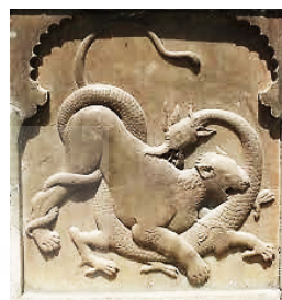
تصویر ۱۷: گرفت‌وگیر شیر و اژدها؛ ازاره کاخ گلستان. (نگارندگان، ۱۳۹۳)

از این منظر، اژدها همچون نگاهبانی سخت‌گیر، نماد شر و گرایش‌های شیطانی است. درواقع اژدها نگهبان گنج‌های پنهان است و برای دست‌یافتن به این گنج‌ها، اژدها دشمنی است که می‌باید بر او پیروز شد. «اژدها به‌عنوان نمادی شیطانی با مار همسان می‌شود (شوالیه و گربران، ۱۳۸۵: ۱۲۳)». این نقش از همین باب در تزئینات بناهایی از جمله کاخ‌قلعه‌های قجری به‌وفور استفاده شده؛ اما پس از آن کمتر در طرح و نقش و تزئینات سایر هنرهای قومی- محلی بختیاری راه باز کرده است. از عمده‌ترین دلایل، این است که این‌گونه حیوانات نمادین می‌توانستند پیام‌آور عوارض مربوط به حیات و مرگ‌ومیر در متن زندگی باشند و ترس از اثرات متافیزیکی آن که از دوران اسطوره در فرهنگ‌های قومی رخنه کرده بود، هنوز می‌توانست موجب خسارت باشد؛ بنابراین در هنرهای مسلط قومی- محلی بختیاری که همان دست‌بافته‌هاست، کمتر استفاده شده است.