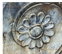
تصویر ۸: گل نیلوفر آبی؛ تخت جمشید

می‌توان گفت این نقش با شکل انتزاعی شده خاصش، جزء نگاره‌های وارداتی فرنگی در دوره قاجار است که بعد از نقش گل هشت‌پر (نیلوفر) بیشترین سهم از تزئینات گل و طبیعت را دارد و سرستون‌های این بنا عمدتاً با این نقش مزین شده‌اند. نکته قابل ذکر در پی بررسی نقوش این بنا، حضور پررنگ نقوش گیاهی در آن است که اتصال آن‌ها به فضای حیاط و باغ، به تقلید از مصورسازی باغ‌های بهشتی است که علاوه بر کمک به باصفا شدن باغ و زیبایی، جلوه‌ای از طراوت، تداوم زندگی و جاودانگی را به‌شکلی رؤیایی نمایش داده و فضای کالبدی ساختمان و مأمّن را با طبیعت پیرامون پیوند زده و