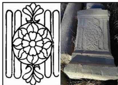
تصویر ۹: تصویر و طرح لوتوس (نیلوفر هشت‌پر)؛ پایه ستون‌های تالار تخریب‌شده طبقه دوم (نگارندگان، ۱۳۹۳)