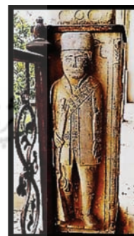
تصویر ۲۲: سرباز نگهبان ایوان قلعه شمس‌آباد