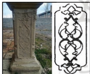
تصویر ۱۳: پایه ستون با نقش آکانتوس؛ قلعه شلمزار (نگارندگان، ۱۳۹۳)

می‌توان گفت این نقش با شکل انتزاعی شده خاصش، جزء نگاره‌های وارداتی فرنگی در دوره قاجار است که بعد از نقش گل هشت‌پر (نیلوفر) بیشترین سهم از تزئینات گل و طبیعت را دارد و سرستون‌های این بنا عمدتاً با این نقش مزین شده‌اند. نکته قابل ذکر در پی بررسی نقوش این بنا، حضور پررنگ نقوش گیاهی در آن است که اتصال آن‌ها به فضای حیاط و باغ، به تقلید از مصورسازی باغ‌های بهشتی است که علاوه بر کمک به باصفا شدن باغ و زیبایی، جلوه‌ای از طراوت، تداوم زندگی و جاودانگی را به‌شکلی رؤیایی نمایش داده و فضای کالبدی ساختمان و مأمّن را با طبیعت پیرامون پیوند زده و