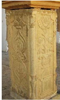
تصویر ۷: تصویر گلدان گل‌های متنوع از راه قلعه چالشتر (نگارندگان، ۱۳۹۳)

نکته قابل توجه در خصوص گل‌های زنبق و رز حجاری شده در این قلعه این است که گل‌ها درون گلدان و به صورت تک‌شاخه و مجزا حجاری شده‌اند؛ برخلاف دسته‌گل با گل‌های متنوع که در قلعه چالشتر یا بناهای دیگر این عصر خصوصاً در استان چهارمحال و بختیاری خلق شده‌اند (مقایسه تصاویر ۴ و ۵ با ۷). همچنین این دو مدل گل بر متن پایه ستون که در ضلع روبه‌روی بیننده از سمت ورودی و در جهت تابش آفتاب (ضلع جنوبی) است، قرار گرفته‌اند. در مجموع می‌توان گفت این نقش از دوره ورود نقش‌های فرنگی به ایران ثبت شده است و ماهیتی فرنگی دارد.