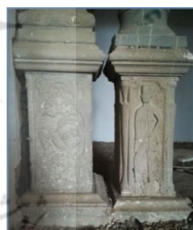
تصویر ۲۶: همجواری سرباز نگهبان و نبرد شیر و اژدها در پایه ستون‌های داخل قلعه شلمزار