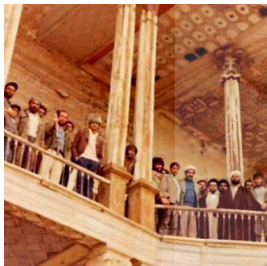
تصویر ۱: عکس به جامانده از قلعه شلمزار

صمصام ۶ ، مشهور به صمصام‌السلطنه ساخته شد و تا اوایل انقلاب به شکل اولیه خود به جا مانده بود. در اولین سال‌های انقلاب اسلامی احتمالاً توسط کسانی که به مظاهر طاغوت و استبداد خوانین نگاه منفی همراه با نفرت داشتند، تخریب شد و طبقه دوم آن به‌طور کامل از بین رفت (آخوندی، ۱۳۷۲: ۳۱۶). طبقه اول این بنا چندین اتاق به‌صورت طاق و چشمه دارد و با خشت خام ساخته شده که استحکام اولیه بنا باعث سلامت این بخش از ساختمان شده است. جلوی این اتاق‌ها را ایوانی با ستون‌های سنگی دربرگرفته که به‌زیبایی هرچه‌تمام‌تر با حجاری تزیین شده است (تصاویر ۱-۳). طبق گفته بومیان منطقه این قلعه به اشیای زینتی نظیر آیینه و قاب‌های منبت‌کاری‌شده مزین بوده است که همه ربوده شده‌اند.