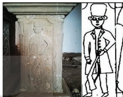
تصویر ۲۵: سرباز مسلح؛ پایه ستون داخل قلعه شلمزار (نگارندگان، ۱۳۹۳)