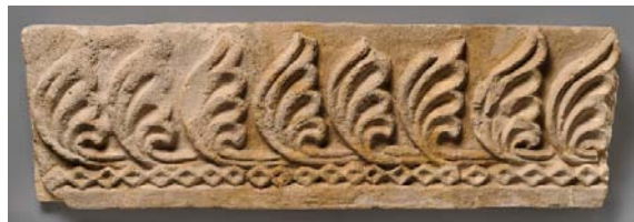
تصویر ۱۱: نقش برگ‌های کنگر (آکانتوس) در تزئین حاشیه؛ کاخ تیسفون ( https://www.metmuseum.org/art/collection/search/322636 )

برخی متون به نام برگ کنگر یا پیچک یا آکانتوس معرفی شده است. این نماد همان آکانتوس گیاه ملی یونان است ۱۲ (کیانی، ۱۳۷۴: ۱۰۲). در تصاویر ۱۲ و ۱۳، این گل با نقش برگ‌ها و ساقه بلند (به صورت خوابیده) نشان داده شده است.