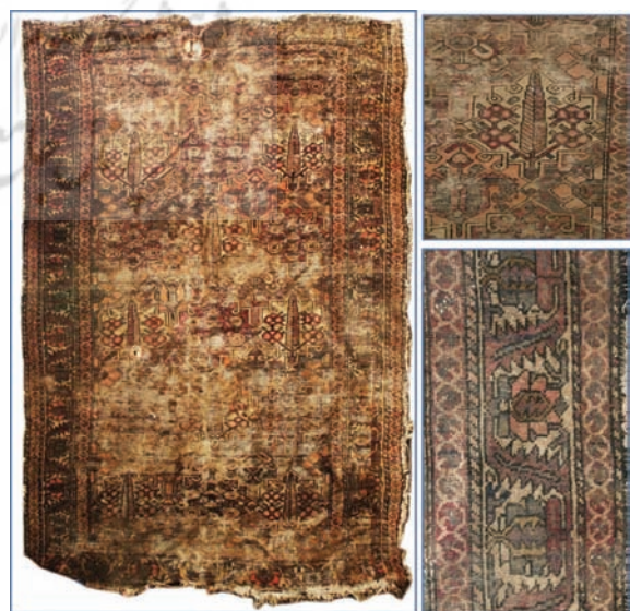
تصویر ۱۴: قالی بختیاری، منطقه بافت، روستای مازه‌سوخته (نگارندگان، ۱۳۸۵)

در تصویر ۱۴ که مربوط به قالی بختیاری است، می‌توان رد پای بسیاری از طرح و نقش‌های کاخ‌قلعه شلمزار و دیگر نمونه‌های دوره قاجار در این مناطق را دید. نگارنده نخستین‌بار در سال ۱۳۸۵ این قالی بسیار کهنسال بختیاری را در روستای مازه‌سوخته در پای کوه هفت‌تان زردکوه بختیاری دید و عکاسی کرد و تصویر آن اینک در آرشیو شخصی نگهداری می‌شود. از این نمونه‌ها در آرشیو نگارندگان بسیار هست که به‌علت پرهیز از اطناب و رعایت استاندارد صفحات و... صرفاً جهت یادآوری یک نمونه آورده شد. پیش از دوران قاجار، بیشتر نقوش فرش‌های بختیاری، حالتی انتزاعی‌تر داشتند و پس از التقاط با الگوهای قجری که در بناها و تزئینات وابسته به آن رسوخ کردند، کمی با همان شکل فرنگی، طبیعت‌گرایانه‌تر شدند و سپس مجدداً نقش‌ها با همان عنوان، به حالتی واقع‌گرایانه‌تر در قالی‌های این عصر و پس از آن خصوصاً نمونه درخشان «خشتی بی‌بی‌باف» استحاله یافتند (تصویر ۱۵).