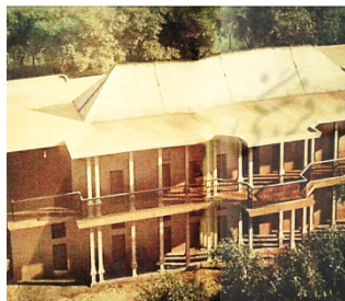
تصویر ۲: تصویر بازسازی‌شده قلعه شلمزار (URI ۷ )