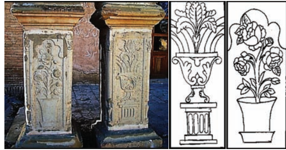
تصویر ۵: تصویر و طرح بوته گل‌های زنبق و رز پایه ستون‌های مستقر در ایوان قلعه شلمزار (نگارندگان، ۱۳۹۳)

تلفیقی ملحوظ در بنای مشابه در استان چهارمحال بختیاری؛ یعنی قلعه چالشتر، به‌شکل تک‌شاخه و در برخی موارد بدون غنچه‌های بوته، حجاری شده است (تصاویر ۴ و ۵).