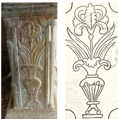
تصویر ۴: تصویر و طرح گل زنبق بر پایه ستون قلعه شلمزار (نگارندگان، ۱۳۹۳)

از دیگر گل‌های مورد توجه در این بنا که بعدها به جمع نمونه‌های گل در فرهنگ تصویری بختیاری اضافه شد، گل زنبق است که در این بنا با استادی خاصی حجاری شده است. در اینجا گل زنبق به‌صورت قرینه حجاری شده که این قاعده از دیدگاه جهانگیر شهدادی در کتاب دریچه‌ای بر زیبایی‌شناسی ایرانی گل‌ومرغ، به‌واسطه یکسانی این گل با درخت زندگی، گل زندگی نام گرفته است (شهدادی، ۱۳۸۴: ۱۷۸). درواقع همان‌طور که درخت زندگی در خط قرینه کادر تصویر می‌شود، گل زنبق نیز همین ویژگی را یافته و علاوه بر قرارگیری در مرکز ترکیب‌بندی، در بالاترین حد استفاده از انواع گل قرار گرفته است. گل‌های زنبق در حجاری‌های این بنا، به‌صورت گل کامل مصور شده‌اند که به‌شیوه میراث نمادین ایرانیان، ویژگی‌هایی نظیر جاودانگی، بی‌مرگی و زندگی را منعکس می‌کند (تصویر ۴).