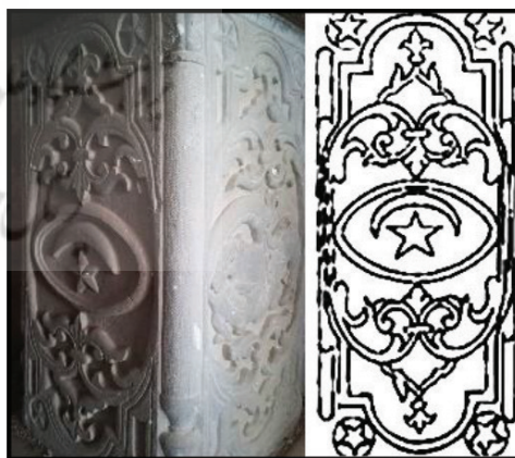
تصویر ۲۸: نقش ماه و ستاره؛ پایه ستون داخل قلعه شلمزار (نگارندگان، ۱۳۹۳)

برای اولین بار نقش ماه و ستاره به تقسیم‌بندی تزیینات اضافه شده است. می‌توان گفت این نگاه و درج این نقوش در مجموعه‌های تصویری دوره قاجار در استان چهارمحال و بختیاری، برآمده از ذائقه قومی بختیاری‌هاست. این امر گواه اهمیت اجرام آسمانی در میان ایشان است. توجه به آسمان چه به‌لحاظ ماهوی و چه به‌لحاظ نشانه‌های راهنما که برای موقعیت‌یابی همیشه با عشایر بوده، باعث شده است نقوش‌های سماوی در اینجا موضوعیت پیدا کند. در تصویر ۲۸ می‌بینیم که نقوش ماه و ستاره در قاب وسط پایه ستون‌ها قرار گرفته‌اند. همین‌طور در لچک دو قاب مربوط به گرفت و گیر و ماه و ستاره، نقش ستاره پنج‌پر حجاری شده است. همان‌طور که ذکر شد این نقوش ریشه در اعتقادات مردمان بختیاری دارند و آن‌ها در قدیم بدون اطلاع از وضع ستاره، دست به کاری نمی‌زدند. آسمان تفرجگاه بختیاری‌هاست. آن‌ها ستارگان را راهنمای خود می‌دانند و فرخندگی، نحوست، و بداختری کارها در ایام هفته و ماه را با آن می‌سنجند. عقیده دارند که چند روز در ماه وجود دارد که ستاره نحسی در آسمان است و انسان باید آن را از خود دور کند و در آن روزها اموری نظیر ازدواج، کوچ، اسباب‌کشی، کشاورزی، مسافرت و... را به تعویق می‌اندازند که با این روزهای ستاره‌دار برخورد نکند. آن‌ها چنین مثلی دارند: «هر روز، روز خداست / ببین ستاره کجاست» ۱۴ .