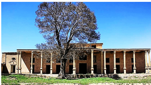
تصویر ۳: نمایی از قسمت‌های به‌جامانده از قلعه شلمزار

ذائقه‌های زیبایی‌شناختی محلی و گرایش‌های مربوط به آن در انتخاب و به‌کارگیری متولیان این بناها، هنوز یک الگوی مسلط قجری است. در پژوهش اخیر سعی داریم ضمن معرفی هنر و تزئینات کاخ‌قلعه شلمزار، پیوندهای فرهنگ تصویری قاجار و فرهنگ محلی (بختیاری) را نشان دهیم. کلیت معماری قاجار در جای‌جای ایران، موجب اختلاط و انتقال فرهنگ تصویری بومی در اثنای تزئینات معماری شد. این امر باعث حفظ و نگهداری بیشتر فرهنگ تصویری محلی عمدتاً عشایری ایران شد و خود بعداً منبع الهام برای هنرمندان محلی که جوای هیئت محلی نیز بودند، شد؛ چراکه بیشتر در اثنای هنرهای عرضه می‌شد که عمر کوتاه‌تری داشتند؛ مثل دست‌بافته‌ها. این اختلاط و امتزاج هم باعث غنای هنر قاجار و هم باعث فراهم کردن زمینه‌ای متفاوت برای جلوه‌گری و حفظ هنرهای بومی- محلی و قومی- عشایری شد.