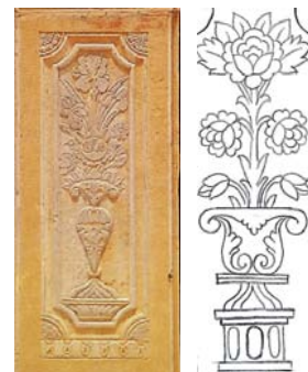
تصویر ۶: تصویر و طرح درختچه گل‌رز؛ پایه ستون ایوان قلعه شلمزار (نگارندگان، ۱۳۹۳)

در کتاب دریچه‌ای بر زیبایی‌شناسی ایرانی گل‌ومرغ آمده است که در طراحی نقش گل‌ومرغ، گل‌های کامل در مرکز قاب قرار می‌گیرند و غنچه‌ها و برگ‌ها برای پرکردن فضاهای خالی اطراف آن نقش می‌شوند (شهادی، ۱۳۸۴: ۸۷). گل رز حجاری شده در قلعه شلمزار نیز از این قاعده مستثنی نیست و ترتیب قرارگیری از پایین به بالا شامل غنچه تا گل کامل است (تصاویر ۵ و ۶).