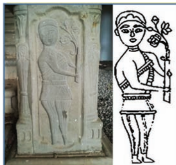
تصویر ۲۴: سرباز گل‌به‌دست؛ پایه ستون داخل قلعه شلمزار