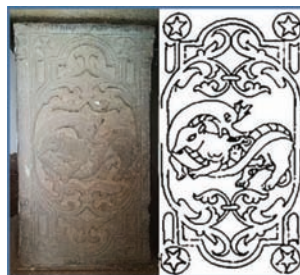
تصویر ۱۶: گرفت‌وگیر شیر و اژدها و نقش ستاره؛ پایه ستون قلعه شلمزار

مأنوس‌بودن با شاهنامه و داستان‌های آن است که حیواناتی از این دست با خصلتی نمادین حضوری پررنگ دارند (تصویر ۱۷).