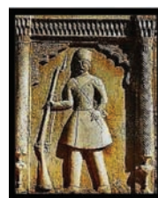
تصویر ۲۰: سرباز مسلح در ورودی باغ نارنجستان قوام شیراز