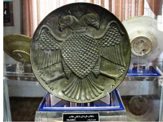
تصویر ۴: بشقاب نقره‌ای با نقش عقاب دوسر متعلق به صدر اسلام، محفوظ در موزه آذربایجان تبریز (URL 2)

در وهله اول، انتقال نقش عقاب دوسر از روی ظرف که کاربردی مشخص در زندگی روزمره دارد، به روی پارچه‌ای که به عنوان پوشش قبر حاکمان و بزرگان استفاده می‌شده است، نوعی تغییر بینارسانه‌ای در تکثیر متن را ایجاد می‌کند. افزون بر این، استفاده از نشانه‌های نوشتاری، به طور مشخص دو کتیبه