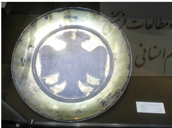
تصویر ۳: بشقاب نقره‌ای زراندود با نقش عقاب دوسر متعلق به عصر ساسانی، محفوظ در موزه رضا عباسی تهران (URL 1)

بازتاب می‌دهند. نقوش روی اکثر بشقاب‌های ساسانی، ترسیم صحنه‌های شکار شاهانه است. سایر نقوش تزئینی، شامل پرندگان آراسته، نقوش جانوران و گیاهان است. این نقش‌مایه‌ها به همراه بن‌مایه‌های تمثیلی، همچون صحنه‌های شکار شاه را می‌توان به استعاره‌های بصری تفسیر کرد که دیدگاه‌های اجتماعی و مذهبی ایرانیان و زرتشتیان را در دوران باستان در بر دارد (همان: ۴۵). یکی از بشقاب‌های فلزی مربوط به عصر ساسانی یک بشقاب سیمین زراندود است که به شیوه چکش کاری و پوسته دوگانه ساخته شده است و روی آن نقش یک عقاب دوسر به چشم می‌خورد. این اثر مربوط به سده‌های پنجم و ششم میلادی است و هم‌اکنون در موزه رضا عباسی در تهران نگهداری می‌شود (تصویر ۳). این بشقاب برخلاف رویه معمول در ظروف مشابه، از نقش‌مایه‌های تزئینی گیاهی پیرامون بشقاب یا نقش‌های جانوری یا انسانی دیگر به همراه نقش اصلی برخوردار نیست و تنها به تصویر خود نقش در مرکز کار اکتفا شده است. در یک نمونه بسیار مشابه دیگر که متعلق به دوران صدر اسلام در ایران برآورد شده است و اکنون در موزه آذربایجان در تبریز نگهداری می‌شود، همین نقش را در یک بشقاب تمام نقره می‌بینیم. در این مورد نیز از نقش‌مایه‌های تزئینی خبری نیست و موتیف دیگری جز نقش اصلی دیده نمی‌شود (تصویر ۴).