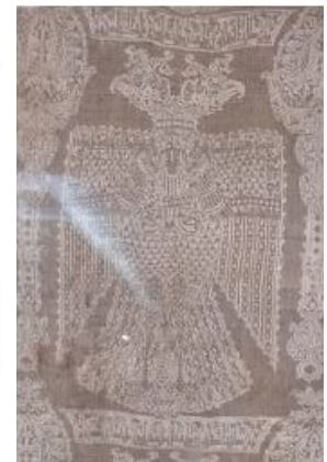
تصویر ۲: پارچه با نقش عقاب دوسر، محفوظ در موزه ملی ایران (همان)