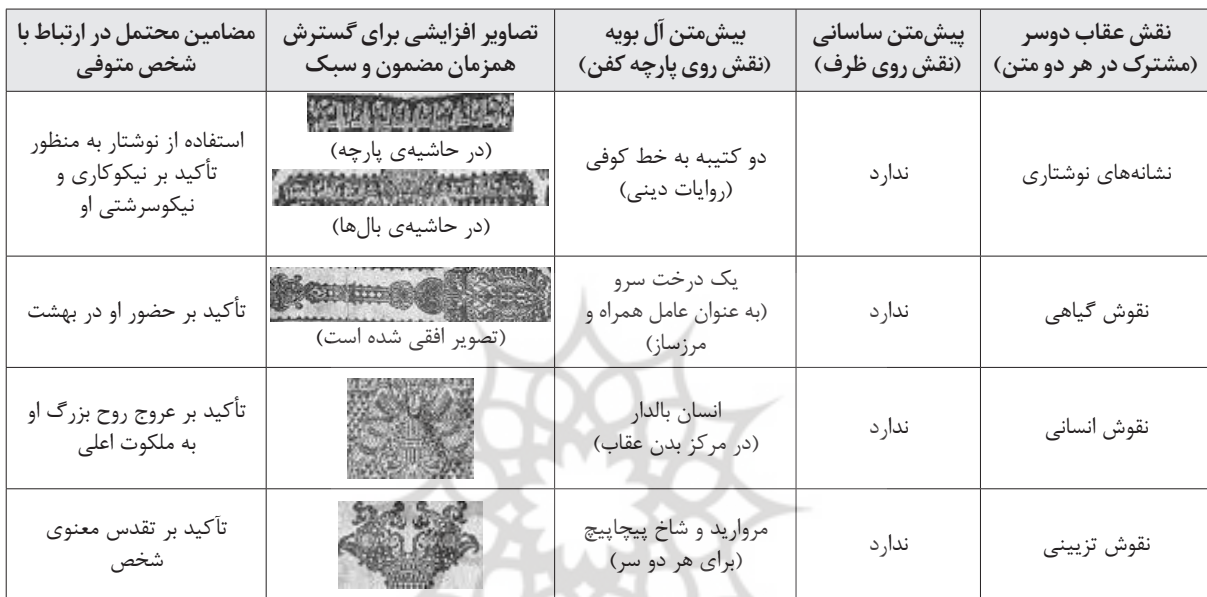
جدول ۲: چگونگی گسترش مضمون و سبک از پیش‌متن ساسانی به بیش‌متن آل بویه (نگارندگان، ۱۴۰۱)

یک‌دست، هماهنگ و هم‌گرا به شمار می‌آیند و از بینامتنیت (کلاژ) پیوندی بهره می‌برند که در آن به دلیل تأکید بر روابط میان عناصر متکثر، ثبات و هماهنگی دیده می‌شود (نامورمطلق، ۱۳۹۹: ۳۰). آمیختگی که معادل هابیرید در نظر گرفته شده، بیانگر صورتی خاص از ترکیب و هم‌زیستی میان متن‌ها یا پاره‌متن‌ها برای شکل‌دهی به یک متن متکثر است. موضوع مهم این است که این هم‌نشینی نه با انکار همدیگر بلکه بیشتر با همکاری عناصر گردآمده در کنار هم شکل می‌گیرد. عناصر پیوندی می‌توانند با هم مصالحه کنند و یک فضای متنی با روابط هم‌زیستانه داشته باشند. در فضای هم‌زیستی، عناصر یک پدیده یا یک متن به تکمیل یکدیگر می‌پردازند و می‌توانند با هم نمایانگر وحدت باشند (همان: ۳۱). به بیان دیگر، بیش‌متن آل بویه بدون انکار پیش‌متن خود و با هدف حفظ و دوام آن، در فضایی مسالمت‌آمیز، ناشی از تعامل درون‌متنی عناصر تشکیل‌دهنده، صورت و معنایی تازه را به نمایش می‌گذارد. از آنجا که همه قسمت‌های بیش‌متن در انتقال معنایی کم‌وبیش مشترک با هم همکاری دارند، عناصری که از