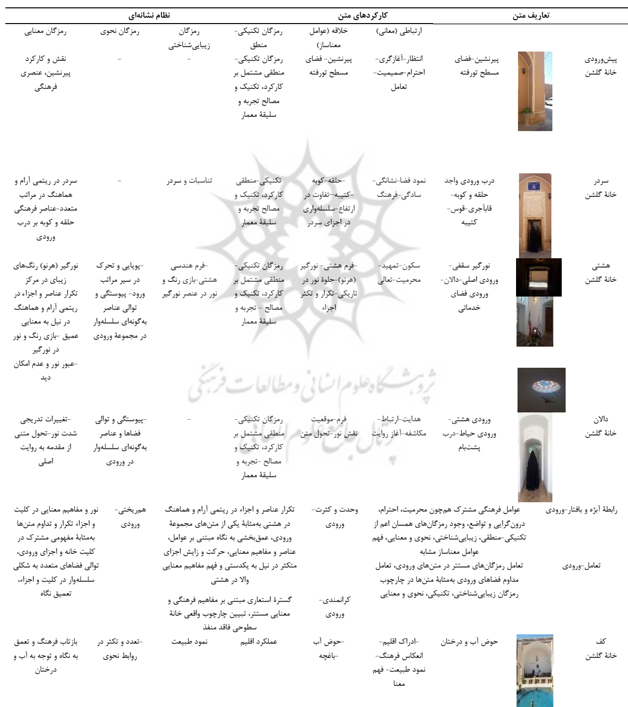
جدول ۴. نشانه‌شناسی فرهنگی خانه‌های سنتی یزد (خانه گلشن).

آن‌ها در قالب متن‌ها براساس عوامل معنا ساز متشکل از عناصر و مفاهیم متعدد بر معانی صریح و ضمنی دلالت می‌کنند. تبیین معانی و مفاهیم ضمنی متن‌های خانه در جداول ۴ و ۵ مبین نقش و کارکرد جمله‌گی شاخصه‌های نشانه‌شناسی فرهنگی اعم از نظام‌های نشانه‌ای مبتنی بر رمزگان تکنیکی-منطقی، زیبایی‌شناسی، معنایی، تعامل،