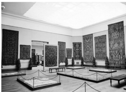
تصویر ۱۴: گالری E-1، ۷ نوامبر ۱۹۱۰، نمایشگاه امانی فرش‌های آغازین شرقی (URL6)

مردم ایالات متحده آمریکا پیش از برگزاری نمایشگاه نیویورک ۱۹۱۰ نیز با فرش‌های شرقی آشنا بودند. در ۱۸۷۹، کنسول بریتانیا در تبریز گزارش می‌دهد: «سالانه نماینده‌ای از لوور برای خرید فرش اعزام می‌شود. علاوه بر تقاضای خوبی که برای فرش‌ها در بازارهای اروپا وجود دارد، به آمریکا هم صادر می‌شوند» (سیف، ۱۳۹۲: ۶۸). همچنین ادگار آلن پو ۷۷ در «فلسفه مبلمان» ۷۸ جایگاه فرش‌های شرقی را در خانه‌های آمریکایی میانه سده نوزدهم آشکار می‌سازد: «فرش‌های شرقی به‌تازگی بهتر از روزگار گذشته فهمیده می‌شوند؛ اما هنوز در فهم نقش و رنگشان گمراه هستیم. فرش، روح خانه است. شاید آدمی معمولی بتواند قاضی احکام حقوقی شود، اما کسی که درباره فرش قضاوت می‌کند باید نابغه باشد» (Allan Poe, 1840: 243). والتینر بر این باور بود که دانش مردم آمریکا از فرش‌های عتیقه کم است: