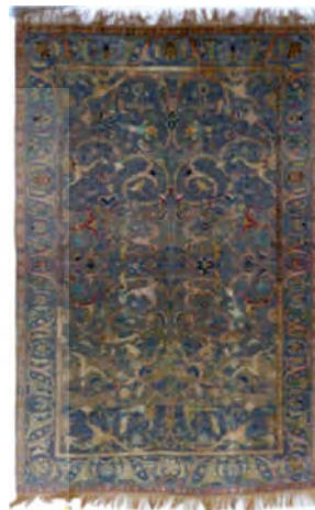
تصویر ۷: فرش پلونیزی، مجموعه لیختن اشتاین، اواخر سده دهم ه.ق (URL3)