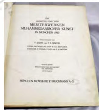
تصویر ۶: صفحه نخست کاتالوگ نمایشگاه شاهکارهای هنر محمدی (URL2)

هم‌چنین برخی پژوهشگران مانند لسینگ، هنرهای کاربردی و فرش را دارای ارزش‌های زیباشناختی مستقل نمی‌دیدند؛ بلکه به‌مثابه ابزاری برای ارتقای طراحی صنعتی و معماری داخلی می‌دانستند. نمایشگاه مونیخ این دیدگاه‌ها را تغییر داد و گستره تأثیرش به شناخت