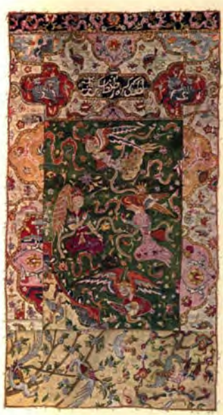
تصویر ۲۰: فرش پاره صفوی، مجموعه پرات، محفوظ در موزه بروکلین (URL9)