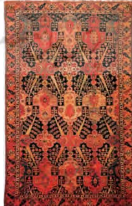
تصویر ۱۷: فرش قاب‌قایی، شمال غرب ایران، اوایل سده یازدهم ه.ق (پوپ و آکرمن، ۱۳۸۷: ۱۱۰۸)