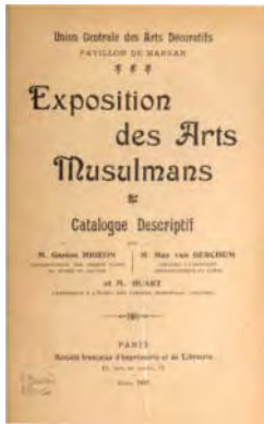
تصویر ۱: جلد کاتالوگ نمایشگاه هنر مسلمانان، پاریس ۱۹۰۳ (Migeon, 1903)

این نمایشگاه به کوشش گاستون میژون ۲۰ از آوریل تا ژوئن ۱۹۰۳ در پاپیون دمارسان ۲۱ ویژه هنر و صنایع کشورهای مسلمان با نمایش هزار اثر و رویکردی علمی به آن‌ها - و نه نگاه خاورشناسی بازاری رایج - برگزار شد (تصویر ۱). این دوره مقارن اوج جنبش آرت نوو ۲۲ در اروپا بود و هنر اسلامی جذابیت بسیاری برای اروپاییان یافته و هنرمندان می‌کوشیدند شناخت بیش‌تری از آثار مسلمانان به‌دست آورده و الگو بردارند. آثار از صدوشانزده مجموعه عموماً واقع در فرانسه گردآوری شده‌بودند. میژون در کاتالوگ نمایشگاه، هر اثر را براساس نام، تاریخ، مواد ساخته‌شده و نام مجموعه‌دار دسته‌بندی کرده و در تاریخ‌گذاری نیز شیوه و رویکردی تازه به‌کار گرفته و کوشیده بود با استفاده از روش تطبیقی و خواندن کتیبه‌ها و تاریخ احتمالی ثبت‌شده بر اشیاء، آثار را با هم مرتبط یا از هم تفکیک کند و مجموعه‌هایی منسجم تشکیل دهد. نخستین بار بود که برای آثار هنری کشورهای مسلمان چنین روشی به‌کار گرفته