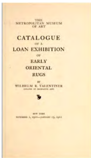
تصویر ۱۵: صفحه نخست کاتالوگ نمایشگاه نیویورک ۱۹۱۰ (Valentiner, 1910)

در هیچ‌جا به اندازه نیویورک بازار فرش‌های نوبافت شرقی گسترده نیست؛ فقط قسطنطنیه و پاریس قابل مقایسه با آن هستند. با این‌همه، دانش عمومی از بافته‌های عتیقه - که برتر از نو است - نسبتی با این تجارت عظیم ندارد [...] گرچه مجموعه‌های خصوصی آمریکایی گنجینه بزرگی از فرش‌های شرقی در اختیار دارند، اما از آن‌جا که آثارشان در دید عموم نیست در بالابردن دانش همگانی کمکی نمی‌کنند. (Valentiner, 1910: 9)