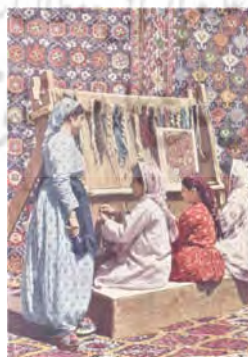
تصویر ۵: کارت‌پستالی به مناسبت نمایشگاه مونیخ ۱۹۱۰ (Troelenberg, 2012: 4)