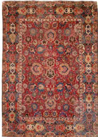
تصویر ۲۱: فرش هراتی، اواخر سده دهم ه.ق، مجموعه کلارک (Valentiner, 1910: 51)

با جامعه آماری گسترده. اکنون بر پایه داده‌های پایگاه اینترنتی موزه بروکلین (URL8) هم‌چنین استناد به نظرات اردمان ( Erdmann, ) (1970: Fig 220) و الیس ( Ellis, 1965: 49) می‌توان گفت احتمالاً بخش میانی این پارفرش شاید تکه گمشده فرش‌پاره مجموعه هاتوانی ۹۲ باشد. درباره تکه‌های بالا و چپ و راست نیز هنوز اتفاق نظری وجود ندارد. والتینر با تردید محل بافت را تبریز ذکر کرده که پوپ و آکرمن (۱۳۸۷: ۱۱۴۱) آن را تأیید می‌کنند؛ اما بنت، ۹۳ کاشان یا اصفهان (Bennett, 1987: 40) و الیس، هرات (Ellis, 1965: 49) را پیشنهاد داده‌اند.