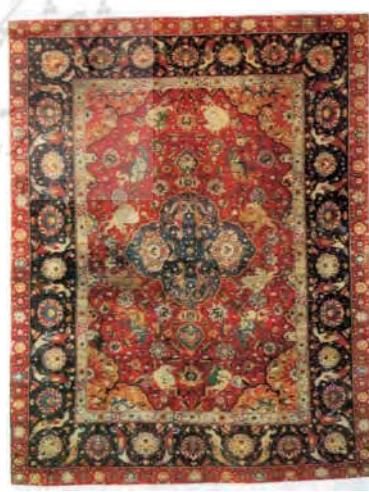
تصویر ۱۰: فرش سانگوژکو، کاشان، نیمه دوم سده دهم ه.ق، محفوظ در موزه گلبنکیان (پوپ و آکرمن، ۱۳۸۷: ۱۲۰۰)