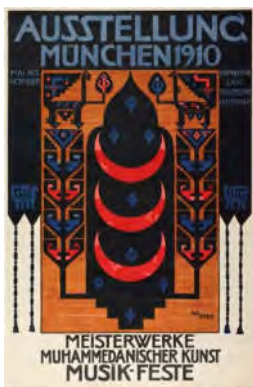
تصویر ۳: پوستر نمایشگاه شاهکارهای هنر محمدی، مونیخ (URL2) ۱۹۱۰

اول تا چهاردهم می ۱۹۱۰، «نمایشگاه شاهکارهای هنر محمدی» ۵۰ در مونیخ برگزار شد که بزرگ‌ترین نمایشگاه هنر اسلامی تا آن زمان بود. ۳۵۷۲ اثر از دو بیست و پنجاه مجموعه جهانی گردآوری و در هشتاد تالار نصب شدند (تصاویر ۳ و ۴). «این نمایشگاه برجسته‌ترین حالت ممکن را برای جایگاه هنر اسلامی در سنت‌های هنری جهان ایجاد کرد [...] چیدمانش نزدیک‌ترین شباهت را به نمایشگاه‌های امروزی داشت [...] برگزارکنندگان صراحتاً به دنبال فاصله گرفتن از فضای هزارویک‌شبی نمایشگاه‌های پیشین [رویکرد خاورشناسان بازاری] بودند» (Roxburgh, 2010: 362). شیوه تحلیل هنر اسلامی در جوامع علمی غرب نیز دگرگون شد.