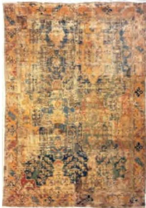
تصویر ۱۶: فرش قاب‌قایی، سده یازدهم ه.ق (Valtiner, 1910: 26)

دیگر فرش نمایش داده شده، مربوط به اوایل سده ۱۰ ه.ق، از مجموعه ویلیامز است (تصویر ۱۸). والتینر با استناد به مارتین (ibid: 28) تاریخ بافت آن را حدود ۱۴۰۰ م. (۸۰۲ ه.ق) تخمین زده است که با توجه به داده‌های کنونی درباره فرش‌های دوره تیموری درست به نظر نمی‌رسد.