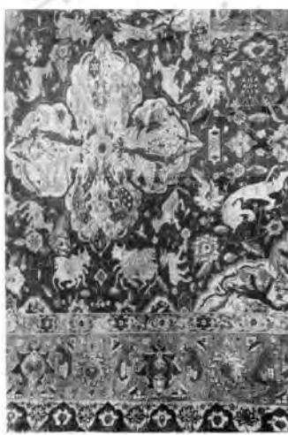
تصویر ۱۱: پاره‌فرش سانگوژکو، کاشان، اواخر سده دهم ه.ق، محفوظ در موزه هنرهای تزئینی پاریس (پوپ و آکرمن، ۱۳۸۷: ۱۱۹۸)