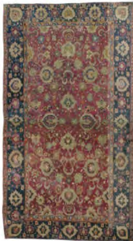
تصویر ۲۲: فرش هراتی، اواخر سده دهم ه.ق، مجموعه کلارک (Valentiner, 1910: 52)

سرسلسله فرش‌های هراتی، جفتی شناخته‌شده با نام امپراتور ۹۴ ، هدیه تزار روسیه به امپراتور هابسبورگ در ۱۶۹۸ بوده‌است. یکی از این فرش‌ها اکنون در متروپلیتن و دیگری در وین نگهداری می‌شود؛ اما به دلایلی در نمایشگاه‌های اواخر سده نوزدهم، امکان نمایش نیافته و ناشناخته مانده‌اند. جالب توجه این‌که فرش‌های امپراتور، نخستین بار در سال ۱۹۲۶ و «نمایشگاه ویژه ایران» ۹۵ برگزارشده در موزه باستان‌شناسی و مردم‌شناسی دانشگاه پنسیلوانیا نمایش داده شده‌اند؛ بنابراین دسته‌بندی و شناخت این گروه، نخستین بار در نیویورک ۱۹۱۰ و با همان پنج نمونه ارائه‌شده از مجموعه‌های نام‌برده صورت گرفته‌است که بر اهمیت کار والتینر می‌افزاید.