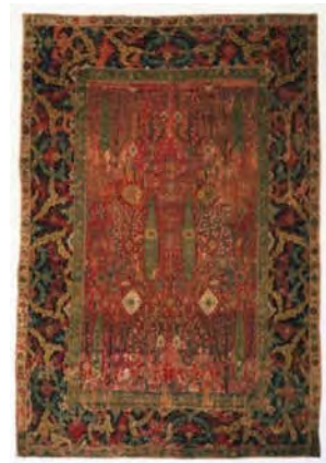
تصویر ۱۸: فرش باغی، اوایل سده دهم ه.ق. محفوظ در موزه فیلادلفیا (URL7)