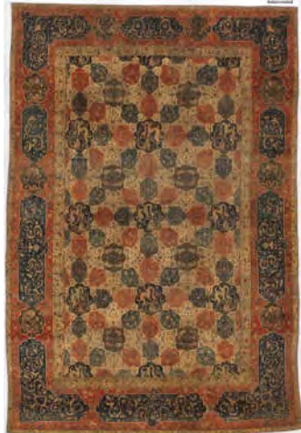
تصویر ۱۹: فرش قاب‌قایی، تبریز، اوایل سده دهم ه.ق، محفوظ در موزه متروپلیتن (URL8)

آنچه آشکار است و تا سال ۱۹۱۰ بارها مبنای تخمین‌های تاریخی نادرست بوده، فقدان شناخت کافی فرش‌پژوهان از دگرگونی‌های طراحی فرش، از برافتادن ایلخانیان تا برآمدن صفویان (۷۳۵-۹۱۴ ه.ق) است. تنوع فرش‌های به‌جامانده از دوره صفوی، در مقایسه با دوران تیموری و ایلخانی که نمونه‌ای قطعی از آن‌ها تاکنون به‌دست نیامده، بر ابهامات افزوده‌است و گاه فرضیاتی سست قوت گرفته‌اند؛ از این‌رو برخی فرش‌های صفوی به دوران پیش از آن نسبت داده شده‌اند.