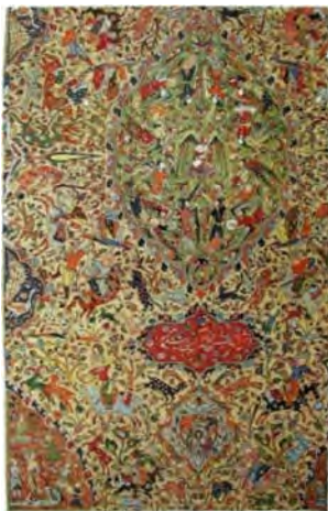
تصویر ۹: گلیم ابریشمی، کاشان، حدود ۱۰۰۰ ه.ق، محفوظ در موزه ری‌دانس (پوپ، ۱۳۷۸: ۱۲۶۴)

فرشی لچکترنج با نقوش گرفت‌وگیر در متن و قرقاول در حاشیه، نمونه دیگری در نمایشگاه بود که اکنون در مجموعه گلبنکیان ۶۴ نگهداری می‌شود (تصویر ۱۰). به سبب نقش تکرارشونده قرقاول، زاره در کاتالوگ نمایشگاه بر آن نام «فرش قرقاول» ۶۵ نهاده بود. این فرش اکنون زیر مجموعه گروهی کوچک به نام سانگوژکو دسته‌بندی شده است. «گروهی از فرش‌های سده‌های پانزدهم تا هفدهم که نام خود را از مالک یکی از آن‌ها، شاهزاده لهستانی رومن سانگوژکو گرفته‌اند» (Stone, 2013: 247). در ۱۹۱۰ هنوز نام سانگوژکو برای این گروه تعیین نشده بود؛ زیرا نمونه‌ها پراکنده بودند و امکان مطالعه تطبیقی و دسته‌بندی وجود نداشت. نخستین فرش این گروه، مطابق اسناد موزه میهو، نخستین بار در سال ۱۹۰۴ در سن پترزبورگ نمایش داده شده است (URL5). بعدها آرتور آپم پوپ ۶۶ در نمایشگاه لندن ۱۹۳۱ و کنگره هنر ایرانی که در حاشیه آن برگزار شد، فرش قرقاول را با پاره‌فرش موزه هنرهای تزئینی پاریس (تصویر ۱۱) و فرش موزه میهو (تصویر ۱۲)، هم‌چنین فرش موزه گوبلن / موبیلیه ناسیونال ۶۷ تطبیق داد و آن‌ها را از نظر طرح، نقوش، ساختار بافت، نوع الیاف و جغرافیای بافت (کاشان یا کرمان) در پیوند با هم دانست (Pope, Tattersall & Gray, 1931: 88). این داده‌ها به دسته‌بندی گروه سانگوژکو در لندن ۱۹۳۱ انجامید. گفتنی است فرش شوارتزبرگ نیز که پیش‌تر در وین ۱۸۹۱ به نمایش درآمده بود، در مونیخ ۱۹۱۰ نیز عرضه شده بود. برخی پژوهشگران چون فرانسیس، این فرش را دارای الگوی مشابهی با فرش‌های سانگوژکو می‌دانند ۶۸ (Franses, 2008: 11)؛ بنابراین دو فرش سانگوژکو در مونیخ ۱۹۱۰ حضور داشته‌اند.