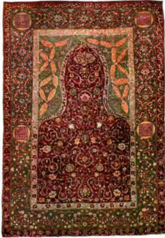
تصویر ۱۳: فرش سالتینگ، کاشان، اواخر سده دهم ه.ق، مجموعه کلکیان، اکنون در مجموعه‌ای خصوصی در تورین (Franses, 1999: 83)

فرشی صفوی از مجموعه کلکیان که امروزه آن را زیرگروه سالتینگ‌ها دسته‌بندی می‌کنند، با نقشه‌ی محرایی نیز ارائه شده بود (تصویر ۱۳). در کاتالوگ آمده که فرش را با شرایطی نامناسب در استانبول یافته بودند. در سال ۱۹۱۰، هنوز اصطلاح سالتینگ رایج نبود و نمونه‌ها ناشناخته بودند. جورج سالتینگ ۶۹ ، یک سال پیش از نمایشگاه مونیخ درگذشته و بنابر وصیتش برخی از آثار مجموعه‌اش، به موزه ویکتوریا و آلبرت سپرده شده بود؛ از جمله فرشی از سده شانزدهم با محل بافت نامشخص. برگزارکنندگان نمایشگاه مونیخ، احتمالاً از فرش هدایی سالتینگ اطلاعی نداشتند؛ بنابراین نمونه کلکیان را بدون دسته‌بندی و با توجه به محل کشف آن، با احتمال منشأ ترکی عرضه کردند. تا میانه سده بیستم، فرش‌های سالتینگ بیش‌تری یافته شد و از آن‌جا که سی‌وهفت نمونه از کاخ توپقاپی به دست آمده بود، اردمان و چارلز ایلس ۷۰ در انتساب آن‌ها به ایران صفوی تردید داشتند و احتمال عثمانی را برجسته‌تر دانستند. اردمان به سبب رنگ‌بندی روشن و شاد، کتیبه‌های متعدد و فضاسازی‌هایی که به تزیینات عثمانی می‌مانست، هم‌چنین ساختار و کاربرد رشته‌های فلزی، آن‌ها را بافت سده نوزدهم در هرکه ۷۱ می‌دانست و نخستین بار در ۱۹۳۷، اصطلاح سالتینگ را برای این گروه به کار برد (Erdmann, 1970: 76-80). تا اواخر سده بیستم نیز اختلاف‌نظرهایی درباره این دسته وجود داشت و تاریخ‌های دوگانه‌ای را به آن‌ها نسبت می‌دادند: «تاریخ اول، قرن ده