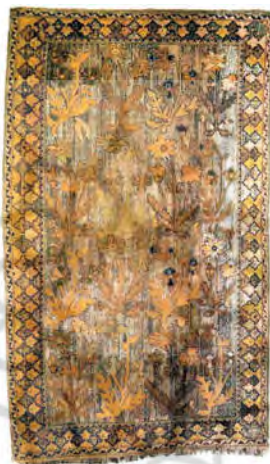
تصویر ۸: فرش پلونیزی، کاشان، اواخر سده دهم ه.ق، مجموعه پوتوکی، اکنون محفوظ در مؤسسه هنر دیترویت (URL4)