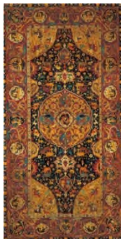
تصویر ۱۲: فرش سانگوژکو، کاشان یا کرمان، اواخر سده دهم ه.ق، محفوظ در موزه میهو (URL5)