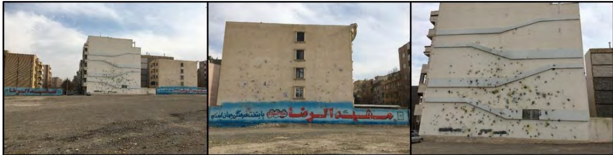
تصویر ۴: تناقض بین حقیقت و شعار و آثار آن بر کالبد منازل شهروندان

همان‌طور که در تصویر ۴ ملاحظه می‌گردد بر روی برخی از دیوارهای منازل خیابان‌ها، مدیریت شهری شهر مشهد را به عنوان پایتخت فرهنگی جهان اسلام مطرح نموده است. اما در مقابل شهروندان شاهد تنزل سطح اعتقادات و فرهنگ شهروندان در رعایت حقوق ساکنان این منازل هستند.