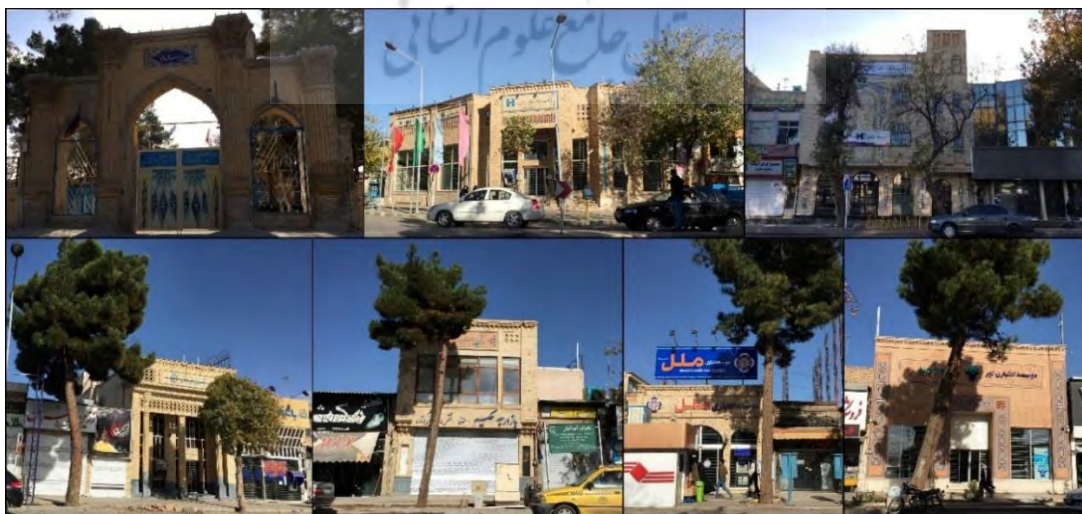
تصویر ۳: تدبیر مدیریت شهری در مورد خیابان امام خمینی شهر نیشابور

از سوی دیگر تصویر ۳ نشان‌دهنده برخورد مناسب مدیریت شهری در مقابل خیابان امام خمینی شهر نیشابور است. تنها دبیرستان خیام که عکس بالا سمت چپ است، قدیمی بوده و بقیه آثار در چند سال اخیر ساخته شده‌اند.