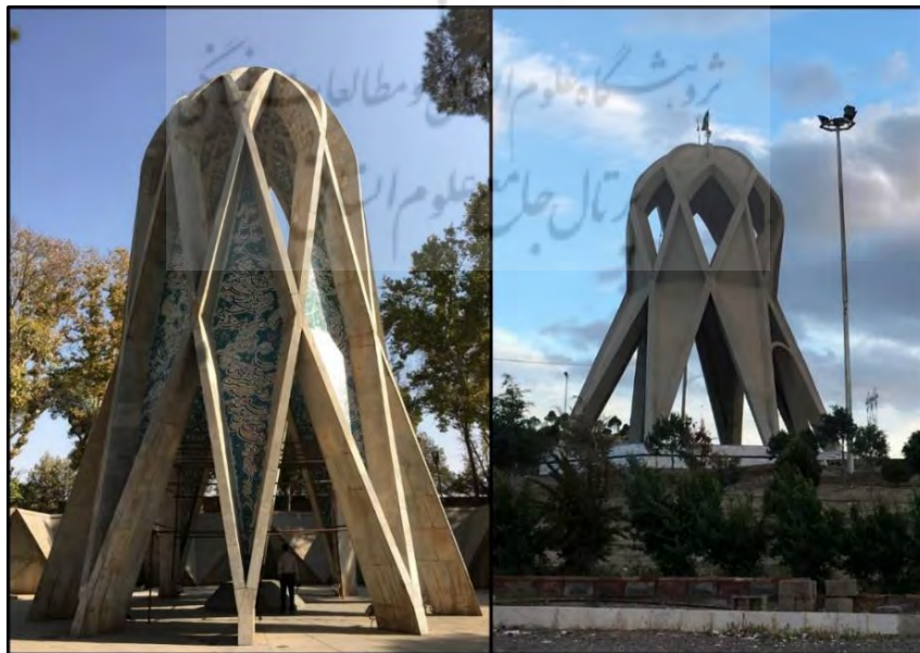
تصویر ۵: سمت راست مزار شهدای گمنام در سه راهی بیارجمند (جاده تهران-مشهد)، سمت چپ آرامگاه خیام نیشابوری در نیشابور

امروزه تقلید در امور هنری به امری شایع تبدیل شده است. این تقلیدها بعضاً از کارهای فاخر ایرانی و بیشتر از کارهای غربی است. «برای طراحی و ایجاد فضای شهری متناسب با تمدن ایرانی، به طراحی نو (و نه تقلید از بیگانگان) و به عبارتی، به روز آمد کردن تجارب و الگوهای تاریخی نیاز است» (نقی‌زاده، ۱۳۸۹: ۲۵). همان‌طور که تقلید از بیگانگان امری نامطلوب است، تقلید از آثار ایرانی نیز امری نامطلوب و بی‌ارزش است. همان‌گونه که در تصویر ۵ ملاحظه می‌شود، در جاده مشهد-تهران (سه راهی بیارجمند مابین شهرهای سبزوار و میامی) سازه‌ای دقیقاً کپی شده از آرامگاه خیام نیشابوری (واقع در شهر نیشابور)، ساخته شده است. این سازه‌ی تقلید شده برای کسانی که آرامگاه خیام نیشابوری را دیده‌اند، نه تنها جذابیتی ندارد بلکه دافعه هم دارد.