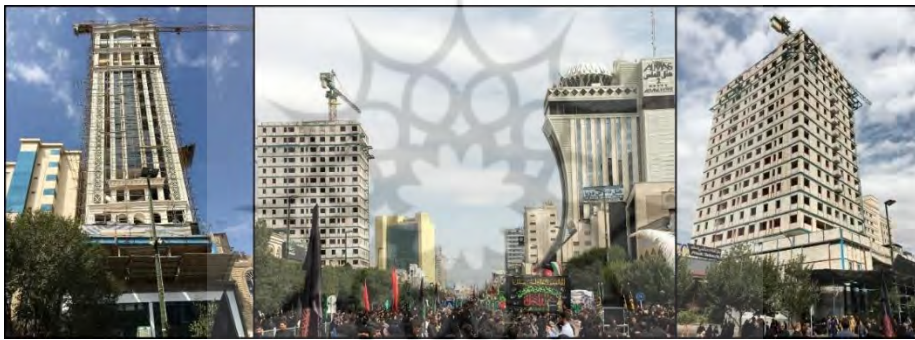
تصویر ۲: تدبیر مدیریت شهری در مورد خیابان امام رضا (ع) شهر مشهد

موضوع این است تقلیدهایی که از غرب صورت می‌گیرد، به صورت ناقص و منطبق بر فرهنگ مردم آنجا بوده است. این تقلیدها جوابگوی نیاز و فرهنگ شهروندان ایرانی نبوده و هر روزه مشکلات بیشتری را به مدیریت شهری تحمیل می‌کند. البته نباید فراموش کرد که همه نهادها و دستگاه‌ها در این کپی‌برداری‌ها سهیم هستند. «ما از تاریخ و فرهنگ خود بریدیم تا به فرهنگ غرب پیوند بخوریم ولی بی‌آنکه به این برسیم، از آنچه بودیم و داشتیم هم رانده شدیم. پیشرفت نمی‌تواند بریدگی و بی‌پیوندی باشد بلکه تداوم و تکراری است در سطحی بالاتر» (آشوری ۱۳۵۱: ۱۴۰ به نقل از پاکزاد، ۱۳۸۹: ۷۲). همان‌گونه که در تصاویر ۲ و ۳ مشاهده می‌شود مقایسه‌ای بین نحوه برخورد مدیریت شهری با خیابان هویت‌مند و اصلی شهر بین دو شهر مشهد و نیشابور صورت گرفته است. تصویر ۲، نحوه نگرش و سیاست مدیریت شهری در مورد خیابان امام رضا (ع) شهر مشهد را نشان می‌دهد که تنها با دید ارزش افزوده و موضوعات اقتصادی، هویت و شخصیت این خیابان که در سال ۱۳۵۵ به نحوه مطلوب و ایرانی-اسلامی طراحی و اجرا شده بود از بین رفته است.