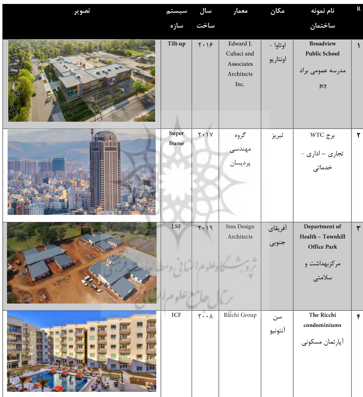
جدول ۳. مشخصات نمونه‌های موردی ساختمان‌ها با روش‌های نوین ساخت

در جدول زیر نمونه ساختمان‌های ساخته شده با ۶ مورد فناوری نوین ساخت در این پژوهش مشخص شده است: