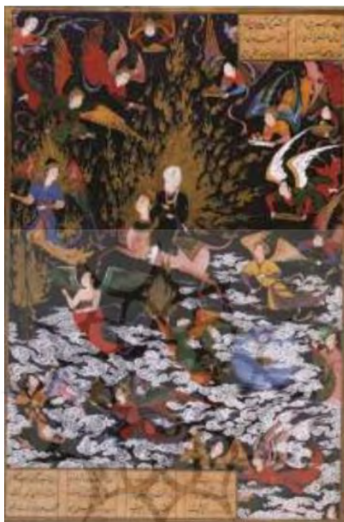
تصویر ۱. نگاره معراج پیامبر. خمسه نظامی. سده ۱۶. دوره صفوی. مکتب تبریز دوم. محفوظ در موزه بریتانیا

می‌داند. البته افرادی که سخنانشان مطابق پیام‌های الهی و شریعت است را نیز می‌توان به‌عنوان حاملان پیام الهی و راهنمای انسان به‌سوی کمال دانست؛ چراکه غزالی شخصاً شاگردان بسیاری داشته و در حیات خود بسیار کوشیده تا با بهره‌گیری از تعالیم اسلامی یکی از راهنمایان انسان به‌سوی کمال باشد. در تصویر شماره ۱ که از نگاره‌های دوره صفوی است نیز پیامبر به‌عنوان هادی انسان به‌سوی کمال ترسیم شده است.