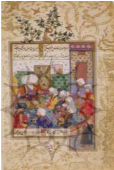
تصویر ۲. شیخ الاسلام و متکلمان. دیوان محمد عبدالله باکی. دوره عثمانی. مکتب عثمانی. محل نگهداری: موزه متروپولین

است و عقل، شرع درونی و آن دو پشتیبان یکدیگر، و بلکه متحد با یکدیگرند؛ اگر شرع نباشد عقل از دریافت بیشتر امور ناتوان می‌شود همچنان که چشم در هنگام نبود نور ناتوان می‌شود (غزالی، ۱۹۷۵م: ۱/۵۷). در واقع تبعیت از شرع و انجام عبادات از اساسی‌ترین امور برای رسیدن به کمال است و برای آن که کمال در انسان حاصل شود باید عنان خویش را به دست شرع دهد و بدون داشتن منازعتی با آن فرمانبرداری را بر خود میسر سازد. او در برخی از آثار خود عبادات و انجام آن را به تفصیل شرح داده که همین امر نشان‌دهنده توجه خاص او به شریعت است. تصویر شماره ۲ نمونه‌ای از ترسیم نمایندگان شرع اسلامی در نگارگری اسلامی است.