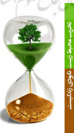
تصویر ۲. دوستی با محیط زیست.

پوستره‌هایی که پیام‌های نوشتاری و تصویری آن در یک راستا همدیگر را تکمیل می‌کنند بر روی مخاطب اثرگذاری بیشتری داشته و منظور اثر را بهتر و واضح‌تر به مخاطب می‌رساند. نشانه‌های تصویری به‌کار رفته در این پوسترها برگرفته از طبیعت‌اند که معنای متضاد حفاظت و تخریب را از طریق ترکیب تصاویر، به مخاطب انتقال می‌دهند (نواسطی و عابد دوست، ۱۳۹۷: ۱).