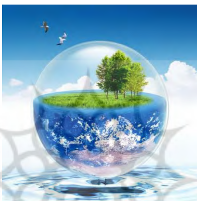
تصویر ۱. دوستی با محیط زیست.

امروزه محیط‌زیست مسئله‌ای بس حیاتی در زندگی بشر است و توجه به حفظ و نگهداری آن مسئولیتی بسیار سنگین و مهم، برگردن یکایک افراد جامعه می‌نهد. امروزه هنر گرافیک تنها یک هنر نیست بلکه نقش رسانه‌ای به خود گرفته و به‌عنوان عامل رسانه‌ای عمل می‌کند. حال پوستره به‌عنوان یکی از سریع‌ترین عامل‌ها برای اطلاع‌رسانی و فرهنگ‌سازی می‌تواند مسئله محیط‌زیست را به‌خوبی به افراد جامعه معرفی نماید.