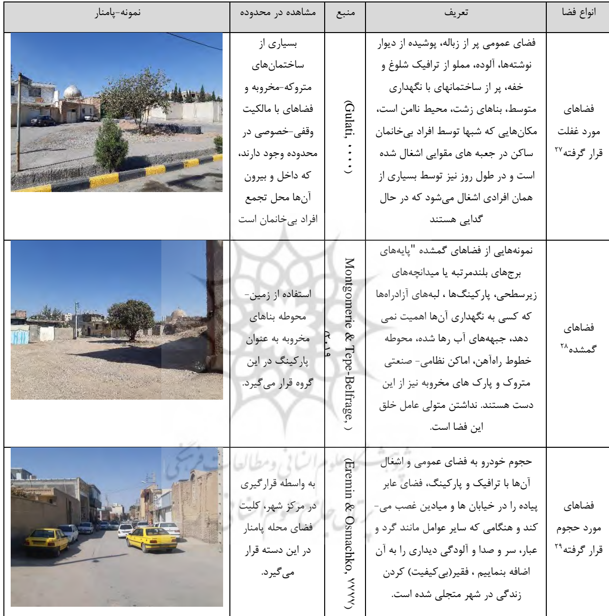
جدول ۲: انواع فضاهای شهری مسئله دار