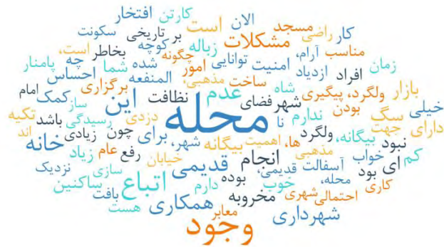
شکل ۲: ابر واژگان، مربوط به نظرات شهروندان مورد مصاحبه قرار گرفته (منبع: نگارندگان)

در ادامه، سطح دوم تحلیل بر مبنای حوزه‌ها، مقوله‌ها (اصلی و فرعی) و زیرمقوله‌ها (اصلی و فرعی) ارائه شده است. این تقسیم‌بندی توسط پژوهشگر و براساس شباهت مضامین ذکر شده توسط شهروندان به انجام رسیده است. همانگونه که ملاحظه می‌شود، پنج حوزه مضمونی اصلی توسط شهروندان ارائه شده است. این حوزه‌ها شامل ادراک از نام محله، ویژگی محله، مشکلات محله، راهکارهای حل مشکل و در نهایت نوع مشارکت قابل انتظار از شهروندان به انجام رسیده است. در ادامه تحلیل‌های مبتنی بر هر مقوله ارائه شده است.