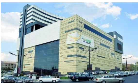
Fig. 2. Atlas commercial complex