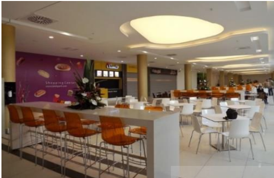
Fig. 6. Lalehparc complex food court

و ... در کنار تلفیق مناسب فضاهای استراحت با فضاهای فروش و استفاده از فضاهای نیمه‌باز با عملکردهایی چون رستوران و کافی‌شاپ، علاوه بر افزایش رضایتمندی، باعث ارتقاء نوآوری این بنا در پاسخ به نیازهای اجتماعی بوده است. حوزه نیازهای معنایی کمترین امتیاز نوآوری و فایده را در این مجتمع کسب کرده‌اند. بیشترین رضایت و نوآوری در این بخش مربوط به زیرنیاز تامین حس زیبایی‌شناسی می‌شود که به مدد استفاده از تناسبات، مصالح و رنگ و بافت مناسب حاصل شده است.