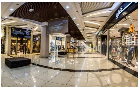
Fig. 10. The interior of Setarehbaran complex

اختیار کاربران قرار می‌دهد. این عامل در کنار فاصله داشتن فضاهای خرید و فضاهای استراحت که قابلیت بالایی در شکل‌گیری تعاملات اجتماعی دارند، باعث شده این بنا در پاسخ به نیازهای اجتماعی میزان فایده و نوآوری کمتری نسبت به دو بنای دیگر ثبت نماید. در حوزه نیازهای معنایی مجتمع اطلس نیز کمترین امتیاز فایده و نوآوری را کسب نموده است اما رضایت و نوآوری در پاسخ به حس زیبایی‌شناسی در این بنا، بیشتر از دیگر مجتمع‌های تجاری بوده است که حاصل هماهنگی و تناسب مناسب این بنا در فرم بیرونی و فضاهای داخلی می‌باشد.