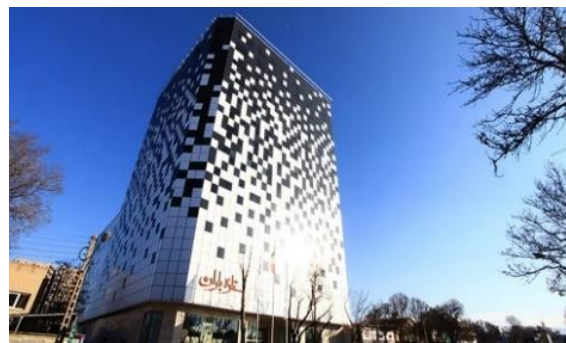
Fig. 3. Setarehbaran commercial complex

پس از برداشت کمی از پرسشنامه‌های تکمیل شده، تحلیل آماری آن‌ها انجام گردید. بدین ترتیب پس از وارد کردن اطلاعات پرسشنامه‌ها به نرم افزار Excel، با استفاده از نرم‌افزار SPSS 18، به تحلیل و محاسبه نتایج آن‌ها پرداخته شد. برای پرسشنامه رضایت‌مندی از پاسخ به نیازها میانگین پاسخ‌ها به هر سوال و انحراف معیار محاسبه گردید. ولی با توجه به نرمال نبودن نتایج و استفاده از طیف لیکرت