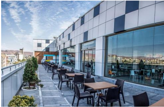
Fig. 9. The semi-open space of Setarehbaran complex

است. نوآوری پاسخ‌های این بنا در زیرنیازهای حس زیبایی‌شناسی و همسویی با ارزش‌ها محدود به اعضا و اندام‌های جدید می‌شود.