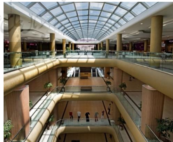
Fig. 5. The interior of Lalehparc complex

مجتمع لاله‌پارک در بین بناهای مورد بررسی بیشترین میزان فایده و نوآوری را به خود اختصاص داده است. در این بنا استفاده از نورگیرهای سقفی جهت تامین نور طبیعی، ایجاد ارتباط بصری بین طبقات با استفاده از ویدیوهای مرکزی و قرار دادن ارتباط‌های عمودی قابل دید از همه طبقات در این فضاها، سازماندهی فضاهای اصلی در پیرامون ویدیو مرکزی و داشتن تشخیص رنگی متناسب، از عوامل بالا رفتن نوآوری و رضایتمندی از پاسخ به نیازهای مادی در این مجتمع بوده است. در زمینه پاسخ به نیازهای روانی، حذف جرزهای سنگین و شفافتر کردن فضاها در کنار یکپارچگی و پرهیز از ایجاد کنج‌های خلوت در ارتقاء رضایت از امنیت فضاها موثر بوده است. ایجاد حوزه‌های آرام برای استراحت و توانمندتر کردن مخاطبین در خرید با استفاده از فروشگاه‌های با سیستم فروش باز، از دیگر تمهیدات این بنا در ارتقاء نوآوری و فایده بوده است.