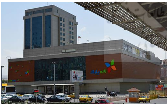
Fig. 1. Laleh Park commercial complex

پس از ارائه مدل سنجش خلاقیت اثر معماری، کاربرد این مدل را با سنجش خلاقیت ۳ مجتمع تجاری لاله‌پارک، اطلس و ستاره‌باران در شهر تبریز بررسی می‌کنیم. این مجتمع‌های تجاری در دهه اخیر و بعد از بوجود آمدن نهضت ساخت مال‌ها در تبریز طراحی و ساخته شده‌اند و از نظر وسعت، تنوع فضایی، کیفیت اجرا و عمومیت و شناخته‌شده بودن بین مردم، از دیگر بناهای تجاری تبریز متمایز هستند.