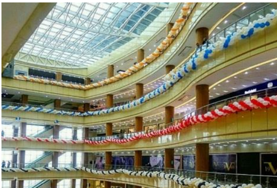
Fig. 7. Interior of Atlas complex

مجتمع اطلس پس از لاله‌پارک بیشترین میزان فایده و نوآوری را در بین بناهای مورد بررسی از آن خود کرده است. در این بنا نیز استفاده از نورگیر سقفی، ارتباط بصری بین طبقات و دقت در ارتفاع و مساحت مناسب فضاها باعث افزایش فایده و نوآوری شده است. اما بر خلاف لاله‌پارک به علت بی‌ارتباط بودن بخشی از فضاها با فضای بزرگ مرکزی، خوانایی و دسترسی بنا بطور قابل ملاحظه‌ای کاهش یافته است. در زمینه نیازهای روانی نیز این مجتمع با استفاده بیشتر از فضاهای باز، دارا بودن تشخیص رنگی و توانمندتر کردن مخاطبین عملکرد موفق‌تری داشته است. ترکیب فضاهای شلوغ و آرام در این بنا به خوبی لاله‌پارک صورت نگرفته و در پاسخ به این زیرنیاز نوآوری مجتمع اطلس محدود به استفاده از مصالح و جدید می‌شود.