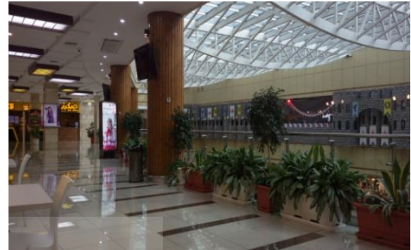
Fig. 8. Interior of Atlas complex

اختیار کاربران قرار می‌دهد. این عامل در کنار فاصله داشتن فضاهای خرید و فضاهای استراحت که قابلیت بالایی در شکل‌گیری تعاملات اجتماعی دارند، باعث شده این بنا در پاسخ به نیازهای اجتماعی میزان فایده و نوآوری کمتری نسبت به دو بنای دیگر ثبت نماید. در حوزه نیازهای معنایی مجتمع اطلس نیز کمترین امتیاز فایده و نوآوری را کسب نموده است اما رضایت و نوآوری در پاسخ به حس زیبایی‌شناسی در این بنا، بیشتر از دیگر مجتمع‌های تجاری بوده است که حاصل هماهنگی و تناسب مناسب این بنا در فرم بیرونی و فضاهای داخلی می‌باشد.