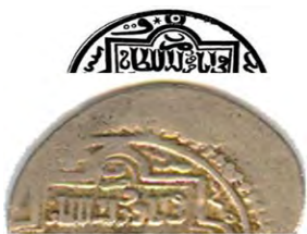
تصویر ۱۴. عبارت نوشتاری «ضرب فی الدوله» پشت سکه‌های ابوسعید، موزه ملی باغ فین.

در میان سکه‌های این ایلخان، سکه‌هایی نیز مشاهده می‌شود که نام ابوسعید در پشت سکه به صورت ایغوری نقر شده است. بر روی سکه عبارت «لا اله الا الله محمد رسول الله صلى الله عليه» به خط کوفی هندسی و در حاشیه سکه نیز اسامی «ابوبکر، عمر، عثمان و علی» نقر شده است (تصویر ۱۱). در پشت سکه القاب سلطان تحت عنوان «السلطان العالم ضرب بوسعیدا سلطان بهادرخان خلد ملکه» به چشم می‌خورد. در مجموع، شعائر مذهبی این ایلخان به صورت ساده در مرکز آمده و نام خلفای راشدین در پایین سکه نوشته شده است. به نظر با توجه به درجه اهمیتی که اسامی برای طراح داشته است، این اسامی قرار گرفته‌اند. در پشت سکه‌ها نیز طراح از ترکیب یک گل چهارپر و یک مربع کادری به وجود آورده است که درون آن القاب پادشاه در مرکز دیده می‌شود (تصویر ۱۲). ابوسعید این نقشمایه را در پشت سکه‌های خود در طی سال‌های بعد از ۷۱۷ ق و به خصوص در سال‌های ۷۱۹ و ۷۲۰ ق مورد استفاده قرار داد و براساس کتاب عمر دیلر نزدیک به ۹۰ ضرب‌خانه در این دو سال اقدام به ضرب سکه با این طرح کرده‌اند (Salehi and et al., 2015, 5). نمونه این کتیبه محراب‌گون به شکل نقاشی روی گچ در سکنج‌های انتقالی گنبد بقعه سید رکن‌الدین یزد نیز مشاهده می‌شود (Salehi and et al., 2015, 5). (تصویر ۱۳).