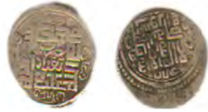
تصویر ۵. کاربرد خط کوفی

۱-۴. طرح تمغای سکه‌های ایلخانی موزه ملی باغ فین: به‌لحاظ معناشناسی، تمغا داغ و نشانی را گویند که بر سرین ستوران سواری و باری چون اسب و الاغ و دیگر چهارپایان زند. در دوره ایلخانان مغول تا قبل از غازان‌خان، تمغا شکل مربعی داشت که سر چهار نفر قراول همراه با کلمات مغولی بر روی آن حک شده بود (محمودی و مهدوی، ۱۳۹۹). این نشان برگرفته از ساخت قبیله‌ای جوامع مغولی بود که از طرف خان مغول به‌عنوان نشانی بر تعلق به خاندان شاهی، از تمغای عمومی قبیله مشتق شده و به خان‌های استقلال‌یافته اهدا می‌شد (شمسی، شاطری و احمدی، ۱۳۹۷) به‌طور کلی، تمغاها استفاده‌های زیادی در جامعه مغولستان دربر داشته است. به‌لحاظ اداری، عملکرد دوگانه داشتند: اول اینکه برای مهر و موم یا مهر دفتر و دوم اینکه برای مالیات تجاری بود؛ سپس نماد مالکیت اشرافیت شده، به‌همین ترتیب، توسط پسران آنان به ارث می‌رسید. کم‌کم تبدیل به‌نام تجاری دام و مهر و موم دولتی شدند و پس از آن در سکه‌ها نیز ظاهر شدند (محمودی و مهدوی، ۱۳۹۹). در میان سکه‌های موجود در موزه باغ فین دو نوع نقش تمغا (طرح سواستیکا) قابل‌شناسایی است که در جدول زیر نمونه‌ای از آن بر روی سکه‌های دو حاکم ایلخانی موجود در موزه ارائه شده است (جدول ۱).