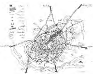
تصویر ۱. توسعه شهرکاشان از

در مخزن موزه ملی کاشان بیش از یکصد قطعه سکه از دوره ایلخانی وجود دارد (تصویر ۲). با توجه به اینکه اکثر سکه‌های ایلخانی موزه باغ فین به یک حاکم (ابوسعید) تعلق دارند. در پژوهش حاضر، تعدادی از سکه‌های متعلق به حاکمان دیگر ایلخانی موجود در موزه معرفی و خوانش آن‌ها انجام شده است. به لحاظ دوره پادشاهی حاکمان ایلخانی، سکه‌های موزه کاشان به نظر متعلق به سه حاکم دوره ایلخانی (غازان محمود (۱ عدد)، اولجایتو (۸ عدد)، ابوسعید (۱۳۱ عدد)) و دو نفر از ایلخانان رقیب (محمدخان (۲ عدد) و انوشیروان (۱ عدد)) هستند که