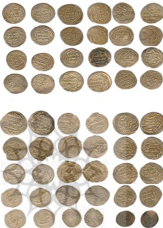
تصویر ۲. نمونه‌هایی از سکه‌های ایلخانی (غازان، اولجایتو، ابوسعید، محمد و انوشیروان) موزه ملی باغ فین.