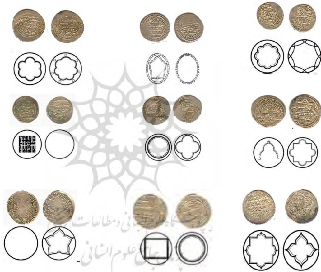
تصویر ۳. نمونه نقوش به کار رفته در قاب سکه‌های ایلخانی موزه ملی باغ فین.

شده است. در سکه‌های اولیه اسلامی، از نقوش هندسی محدود به دایره و دایره‌های متحدالمرکز استفاده می‌کردند. این نقوش اندک اندک به صورت محدود افزایش یافت و اشکالی متناسب با فضای دایره‌ای و کوچک سکه‌ها پدید آوردند. در دوره ایلخانی، با سرنگونی خلیفه، اصلاحات بنیادی متعددی در سکه‌های مناطق تحت حکومت آنان رخ می‌دهد که مواردی چون خط، زبان و تصاویر مورد استفاده در سکه‌ها را دربر می‌گیرد (صالحی، ۱۳۹۳). با توجه به بررسی کمیت قاب‌ها در سکه‌های ایلخانی موزه کاشان، از قاب دایره، زنجیره‌های مدور با نقاط توپر و گل‌های چندپر استفاده شده است (تصویر ۳).