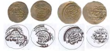
تصویر ۸. رو و پشت نمونه سکه‌های اولجایتو همراه با طرح خطی آن در موزه ملی باغ فین.

شایسته است اشاره شود که برای اولین بار شعائر مذهبی «علی ولی الله» نیز بر روی سکه‌های آباقخان (حک: ۶۸۱ - ۶۸۳ ق) ظاهر می‌شود و در نهایت، آخرین ایلخانی که از این عبارت استفاده کرده، اولجایتو (حک: ۷۰۳ - ۷۱۶ ق) است. وی در تمامی سکه‌هایی که بعد از تشریفش به مذهب شیعه در سال ۷۰۹ ق ضرب شده، از این پیام شیعی استفاده کرده است (صالحی، ۱۳۹۳) (تصویر ۸). در زمان اولجایتو برای نخستین بار، وی القاب متداول و طولانی شرقی را به کار برد که روی سکه‌ها به صورت مختلف دیده می‌شود (اشپولر، ۱۳۶۸، ۲۷۳). به‌طور کلی روی سکه‌های اولجایتو شامل یک دایره مرکزی است که در آن شعائر اصلی قرار گرفته است و در حاشیه بیرونی هم صلوات ۱۲ امام دیده می‌شود و در پشت سکه نیز یک گل چهارپر قرار دارد که القاب پادشاه و سایر ادعیه بر روی آن مشاهده می‌شود (تصویر ۹).