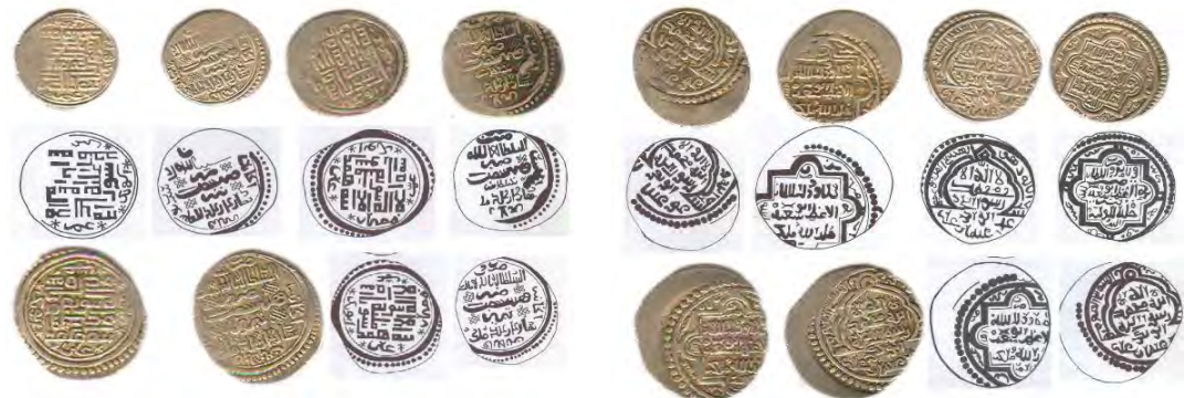
تصویر ۱۰. رو و پشت نمونه سکه‌های ابوسعید با نقش محراب همراه با طرح خطی آن در موزه ملی باغ فین. منبع: نگارندگان. تصویر ۱۱. رو و پشت نمونه سکه‌های ابوسعید با خط ایغوری همراه با طرح خطی آن در موزه ملی باغ فین. منبع: نگارندگان.

در میان سکه‌های این ایلخان، سکه‌هایی نیز مشاهده می‌شود که نام ابوسعید در پشت سکه به صورت ایغوری نقر شده است. بر روی سکه عبارت «لا اله الا الله محمد رسول الله صلى الله عليه» به خط کوفی هندسی و در حاشیه سکه نیز اسامی «ابوبکر، عمر، عثمان و علی» نقر شده است (تصویر ۱۱). در پشت سکه القاب سلطان تحت عنوان «السلطان العالم ضرب بوسعیدا سلطان بهادرخان خلد ملکه» به چشم می‌خورد. در مجموع، شعائر مذهبی این ایلخان به صورت ساده در مرکز آمده و نام خلفای راشدین در پایین سکه نوشته شده است. به نظر با توجه به درجه اهمیتی که اسامی برای طراح داشته است، این اسامی قرار گرفته‌اند. در پشت سکه‌ها نیز طراح از ترکیب یک گل چهارپر و یک مربع کادری به وجود آورده است که درون آن القاب پادشاه در مرکز دیده می‌شود (تصویر ۱۲). ابوسعید این نقشمایه را در پشت سکه‌های خود در طی سال‌های بعد از ۷۱۷ ق و به خصوص در سال‌های ۷۱۹ و ۷۲۰ ق مورد استفاده قرار داد و براساس کتاب عمر دیلر نزدیک به ۹۰ ضرب‌خانه در این دو سال اقدام به ضرب سکه با این طرح کرده‌اند (Salehi and et al., 2015, 5). نمونه این کتیبه محراب‌گون به شکل نقاشی روی گچ در سکنج‌های انتقالی گنبد بقعه سید رکن‌الدین یزد نیز مشاهده می‌شود (Salehi and et al., 2015, 5). (تصویر ۱۳).