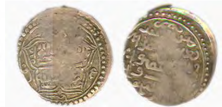
تصویر ۶. رو و پشت نمونه سکه ایلخانی غازان محمود در موزه ملی باغ فین کاشان.

۲. اولجایتو؛ سلطان محمد خدابنده (۷۰۳-۷۱۶ ق): مشروعیت‌سازی حکومت اولجایتو اغلب با استفاده از سنت‌های اسلامی در قالب القاب اسلامی، آیات قرآنی و نام بزرگان مذهبی برای نشان دادن گرایش و همراهی ایلخان با گروه‌های مذهبی و گفتمان قانونی غالب بر جامعه صورت گرفته است (شمسی و همکاران، ۱۳۹۷). به‌طور کلی، ویژگی سکه‌های ضرب شده اولجایتو در میان سکه‌های ایلخانی موزه ملی باغ فین کاشان عبارت‌اند از: نوشتار سکه‌ها دارای سبک شیعی به صورت «ضرب فی دولة المولی‌السلطان‌الاعظم مالک رقاب‌الامم غیاث‌الدینا و الدین اولجایتو سلطان محمد خلد الله ملکه» به معنی «ضرب شد در زمان پادشاهی سلطان اعظم، گرداننده ملت‌ها، پادشاه بزرگ فریادرس دنیا و دین، اولجایتو سلطان محمد خداوند پادشاهی وی را جاودان گرداند» (تصویر ۸) که به‌نظر این سجع سکه از جنبه ایرانی بودن دور شده و بیشتر به جنبه اسلامی نزدیک است. البته شایسته است که اشاره شود استفاده از شعار مذهبی «خلد الله ملکه» که در انتهای سجع بالا اشاره شد، برای اولین بار بر روی سکه‌های غازان محمود (حک: ۶۹۴-۷۰۳ ق) ظاهر می‌شود (ثواقب و امرایی، ۱۳۹۶). استفاده از واژه‌های «غیاث‌الدینا و الدین» به معنی «نجات‌دهنده دنیا و دین» که بر روی سکه‌های اولجایتو استفاده شده، کفایت وی برای سروری بر جهان اسلام به‌واسطه صاحب جان امت‌ها مورد تأکید قرار گرفته است (شمسی و همکاران، ۱۳۹۷). در حاشیه روی سکه‌های سلطان محمد خدابنده موجود در موزه، نوشتارهایی همچون «لا اله الا الله محمد رسول الله علی ولی الله» و اسامی ائمه اطهار (ع)، به‌طور مفصل، بر روی تعدادی از سکه‌های محمد خدابنده نقر شده است که متأسفانه اکثر آن‌ها سایید شده است؛ همچنین شکل هندسی سکه‌ها به دالبرهای چهارلبه‌ای تغییر