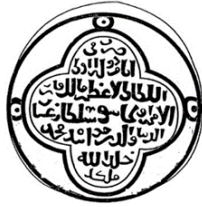
تصویر ۹. نمونه طرح‌واره کامل رو و پشت سکه از حاکم ایلخانی اولجایتو.