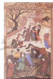
تصویر ۱۱. ضیافت دراویش، منسوب به افضل.