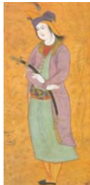
تصویر ۵. مردی با شمشیر. منبع: کن‌بای، ۱۳۹۳، ۱۴۰.