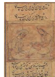
تصویر ۱۰. دو دلداده، عمل رشید.