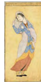
تصویر ۲. دختر چادربه‌سر.