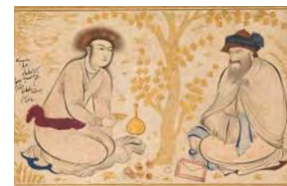
تصویر ۷. در محضر پیر، ۱۰۳۹ ق، مرکب، رنگ شفاف و مات و طلا روی کاغذ، مرقع گلشن.