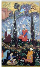
تصویر ۶. در محضر پیر، مرقع گلشن.