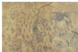
تصویر ۹. زن لمبیده، هنرمند نامعلوم، مرکب.