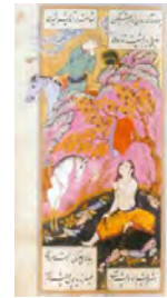
تصویر ۱. نگریستن خسرو شیرین‌را.