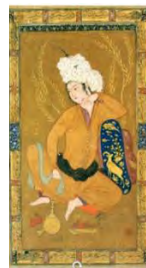
تصویر ۳. جوان نشسته با پای برهنه. منبع: سودآور، ۱۳۸۱، ۲۷۰.