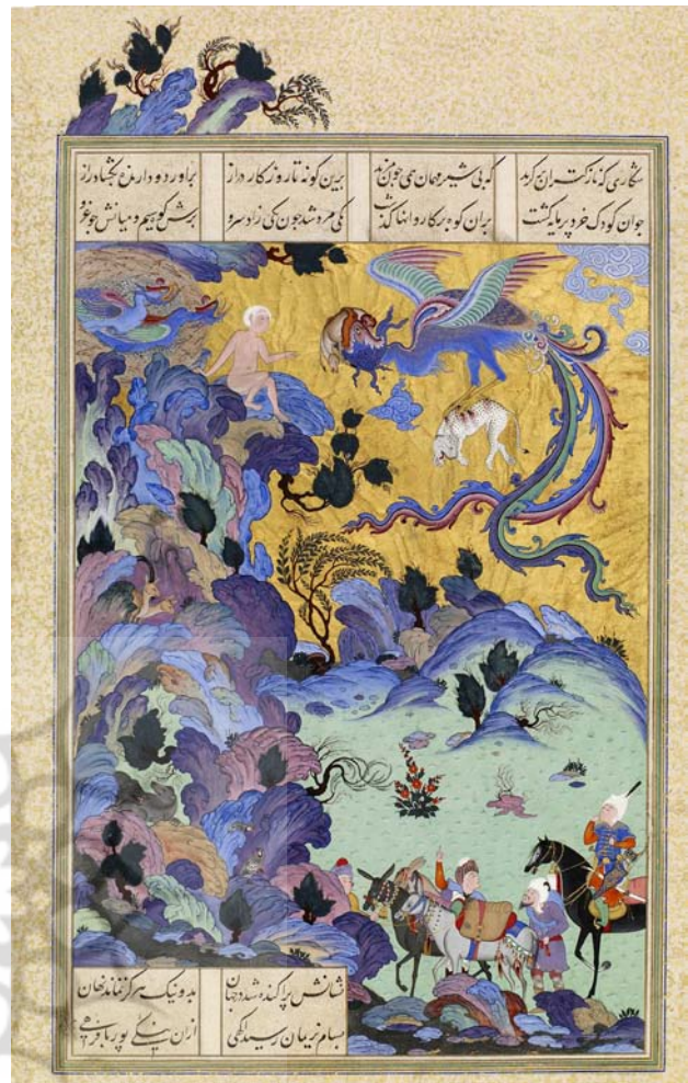
تصویر ۲. مکتب تبریز ۲، زال و سیمرغ (شاهنامه طهماسبی). مأخذ: https://manu-scriptevidence.org/wpme/simurgh-and-zal-from-a-persian-shahnameh .

خودداری می‌کرده‌اند (فخر مدبر، ۱۳۴۶، ۳۲۷). بنابر آنچه گفته شد، ترسیم و تصویر فیل جنگی برای هنرمندان تبریز ۲ و نیز برای هنرمندان استرآباد یا هر جای دیگری، در شمار افسانه و نمادی ما بین افسانه و حقیقت (بین اژدها و اسب) بوده و ناآشنایی مردمان و هنرمندان این سرزمین‌ها با فیل را به استفاده از استعاره ناشناختگی فیل برای تمثیل ابهام در فهم جهان و کردوکار گیتی سوق داده است. در طول تاریخ از پیروزی انسان بر نوع حیوان، به‌عنوان پیروزی انسان بر طبیعت یا پیروزی بر علقه‌های حیوانی خود خویشتن است. از کهن‌ترین نگاه‌های سنگی و سفالی تا نوشته‌های معاصر می‌توان از این الگوی فکری-هنری به صورت‌های جنگ، شکار، قربانی، مرحله گذر پهلوانی و غیره نام برد. کوفتن سر فیل توسط رستم دستان، در راستای طرح‌های موجود بر مهرهای هخامنشی - که در آنها شاه / قهرمان به هموردی جانوری افسانه‌ای می‌پردازد- قابل تفسیر است. فیل به جهت غیربومی بودن و عاری بودن از رفتارهای خشن، در خاورمیانه چندان جایگاه افسانه‌ای پیدا