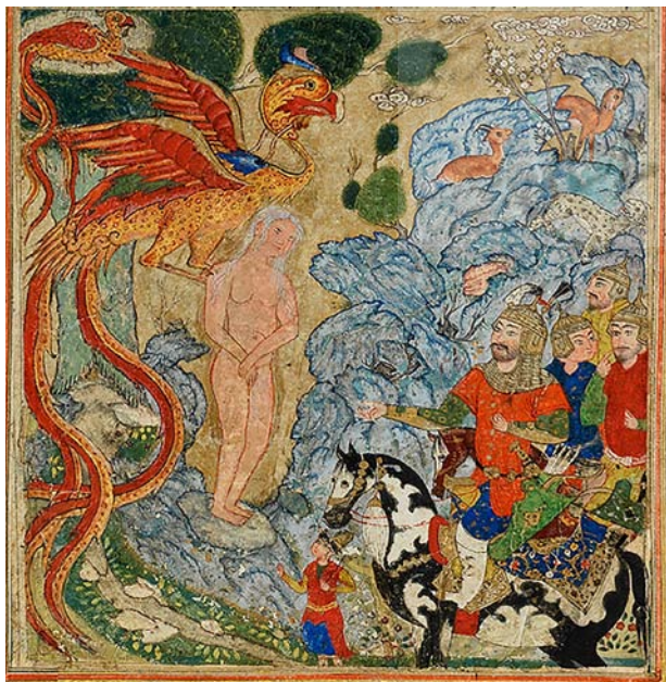
تصویر ۱. مکتب استرآباد، زال و سیمرغ (شاهنامه استرآبادی).

وجود فیل‌ها در جنگ، مهابت و وخامت آوردگاه را نشان داده و شجاعت و ابهت جنگیان را می‌نمایانده است. شاید فیل‌ها در جنگ‌های پیچیده و تخصصی سده‌های میانه و حتی پیش‌تر از آن، از زمانی که اسب و استر به‌عنوان سواره‌نظام و لازمه اردوکشی به جنگ‌ها افزوده شدند، کارایی چندانی نداشته است. چه این که آنها نه‌تنها چالاکی اسبان را برای کنترل توسط سوارانشان نداشتند، بلکه آب‌وهوای منطقه مدار معتدل زمین که تمدن‌ها در آن شکل گرفته‌اند، برای آنها مناسب نبود. آنها در برابر سلاح‌هایی که پیشرفت کرده بودند، بسیار آسیب‌پذیر بودند. آشفتگی جنگ موجب رم‌کردن و پیدایی حالت جنون در آنان می‌شد و نیز به‌آسانی قابل تکثیر و تربیت برای عملیات نظامی گسترده نبودند. در نهایت برای بومیان منطقه ذکرشده، برقراری ارتباط ذهنی با این حیوانات سترگ اما روحیه ظریف و عاطفی ممکن نبود. این است که وجود فیل در جنگ‌ها، یا تبار افسانه را به دوره اساطیری می‌کشاند، یا این که از آنها فقط در حد بسیار اندک، دور از طلایه و قلب سپاه نگاه‌داشته می‌شده است. چنان که گفته می‌شود هندیان نیز از تعبیه پیلان در صفوف و رده‌های مقدم سازمان جنگی