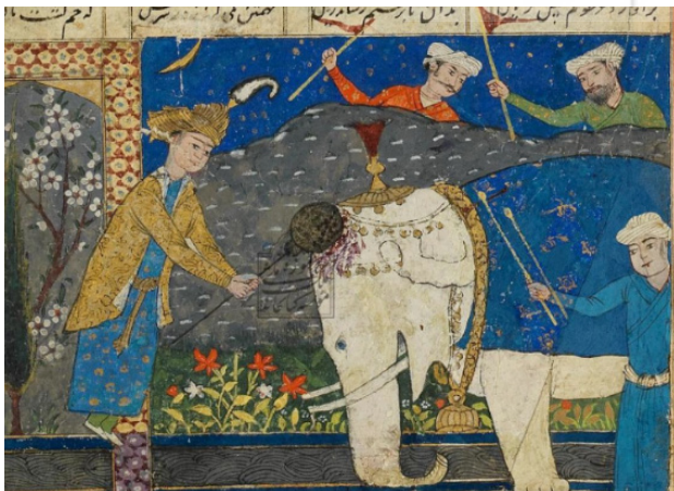
تصویر ۳. مکتب استرآباد، کشتن رستم پیل سپید را (شاهنامه استرآبادی).