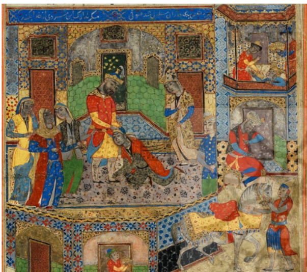
تصویر ۷. مکتب استرآباد، رفتن شیرین به کاخ خسرو (شاهنامه استرآبادی).

می‌راند. عاشق و معشوق به دیدار نشستند؛ گروهی از ملازمان به گرداگرد آنها به چمیدن مشغول‌اند. دو دلداده فضایی مهجور و مستور دارند و دور از دیدرس اطرافیان‌اند. اگرچه به دلیل ناآشنایی با اصول پرسپکتیو، نتوانسته است آنها را مجزا کند. نگارگر با افزودن پایه‌های تخت، فضا را تا حدی جدا کرده و ضمن آن، جایگاه عشق و پادشاه را افزوده است. در بیرون کاخ، دربان و سایر خدمتکاران نشسته‌اند. کاخ پادشاه با طراحی ریز و ظریف نقوش هندسی گره‌چینی، بسیار بزرگ‌تر نشان داده شده