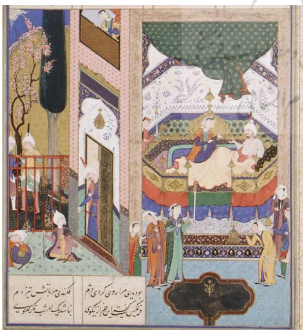
تصویر ۸. مکتب تبریز ۲، رفتن شیرین به کاخ خسرو (شاهنامه طهماسبی).