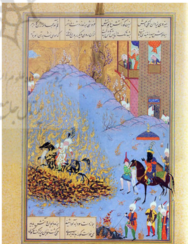
تصویر ۱۰. مکتب تبریز ۲، گذر سیاوش از آتش (شاهنامه طهماسبی).