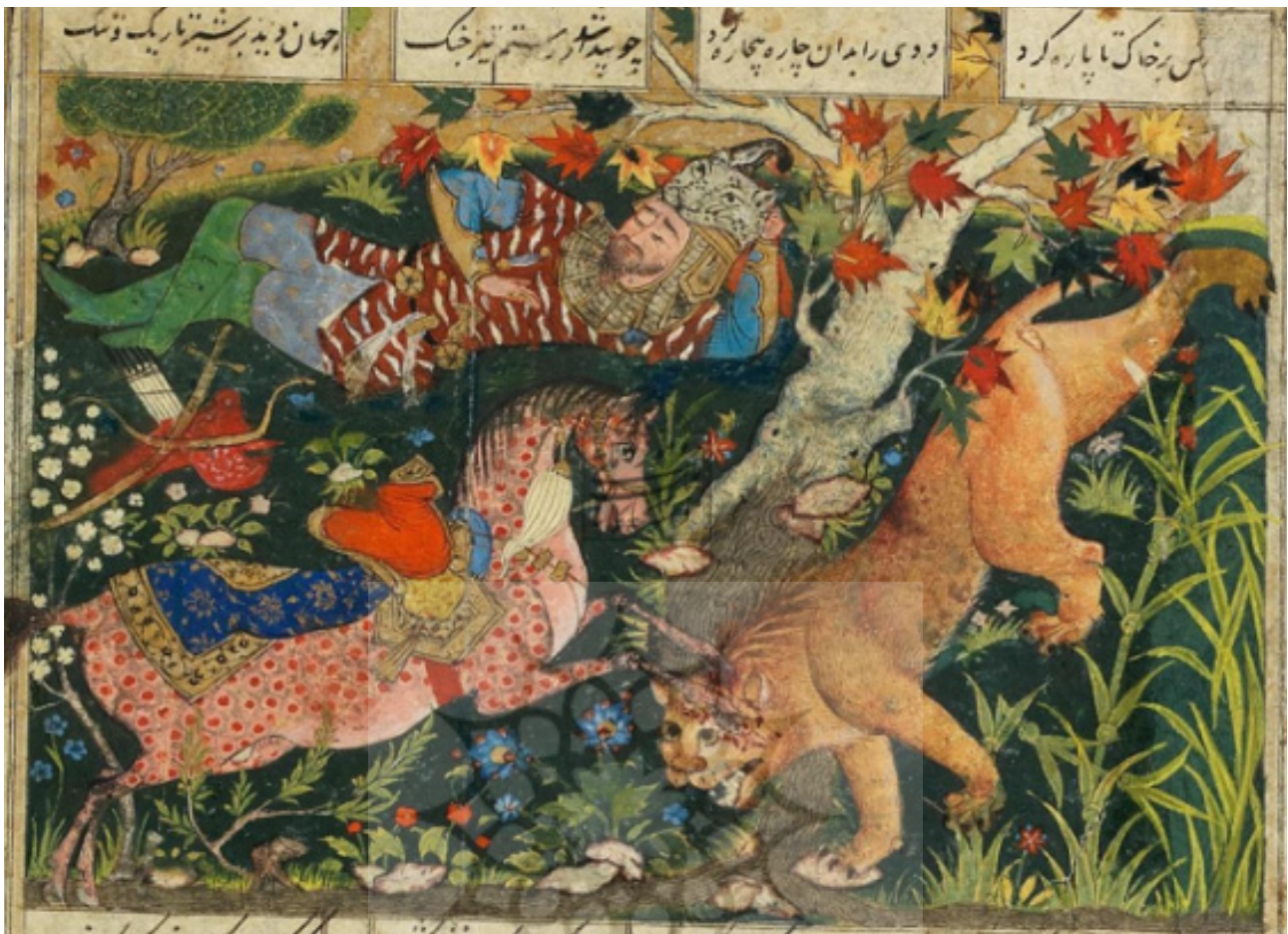
تصویر ۵. مکتب استرآباد، نبرد رخس و شیر (شاهنامه استرآبادی).