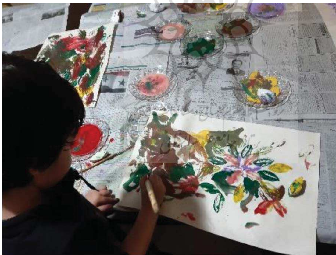
کارگاه هنر کودک والد، ۱۳۹۹، آموزشگاه هنرهای تجسمی، گرگان، مأخذ: نگارندگان