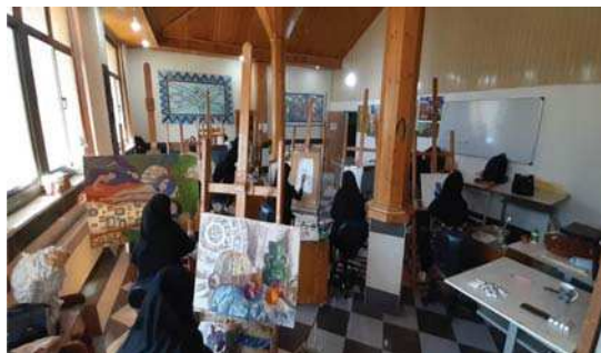
تصویر ۱. آتلیه نقاشی، دانشکده هنر، یکی از دانشگاه‌های استان گلستان