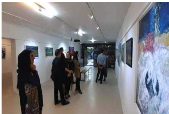
تصویر ۳. نمایشگاه نقاشی، یکی از گالری‌های استان گلستان

مشکل اقتصاد هنر در استان گلستان می‌باشند.