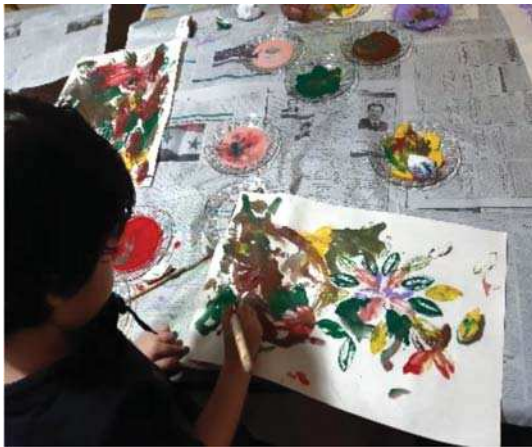
تصویر ۲. کارگاه هنر کودک والد، ۱۳۹۹، آموزشگاه هنرهای تجسمی، گرگان، مأخذ: همان

فقر قیمتی در فرایند تولید، ظرفیت بهره‌وری آن محدود می‌شود؛ سوم اینکه برای تعیین ارزش کار باید همکاری عوامل متعدد را در محاسبه آورد؛ چهارم انگیزه‌ی نوآوری مادی نیست. (Zorloni, 2013, 26)